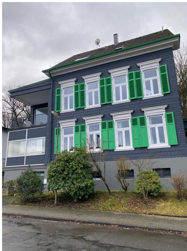
Außenansicht von vorne