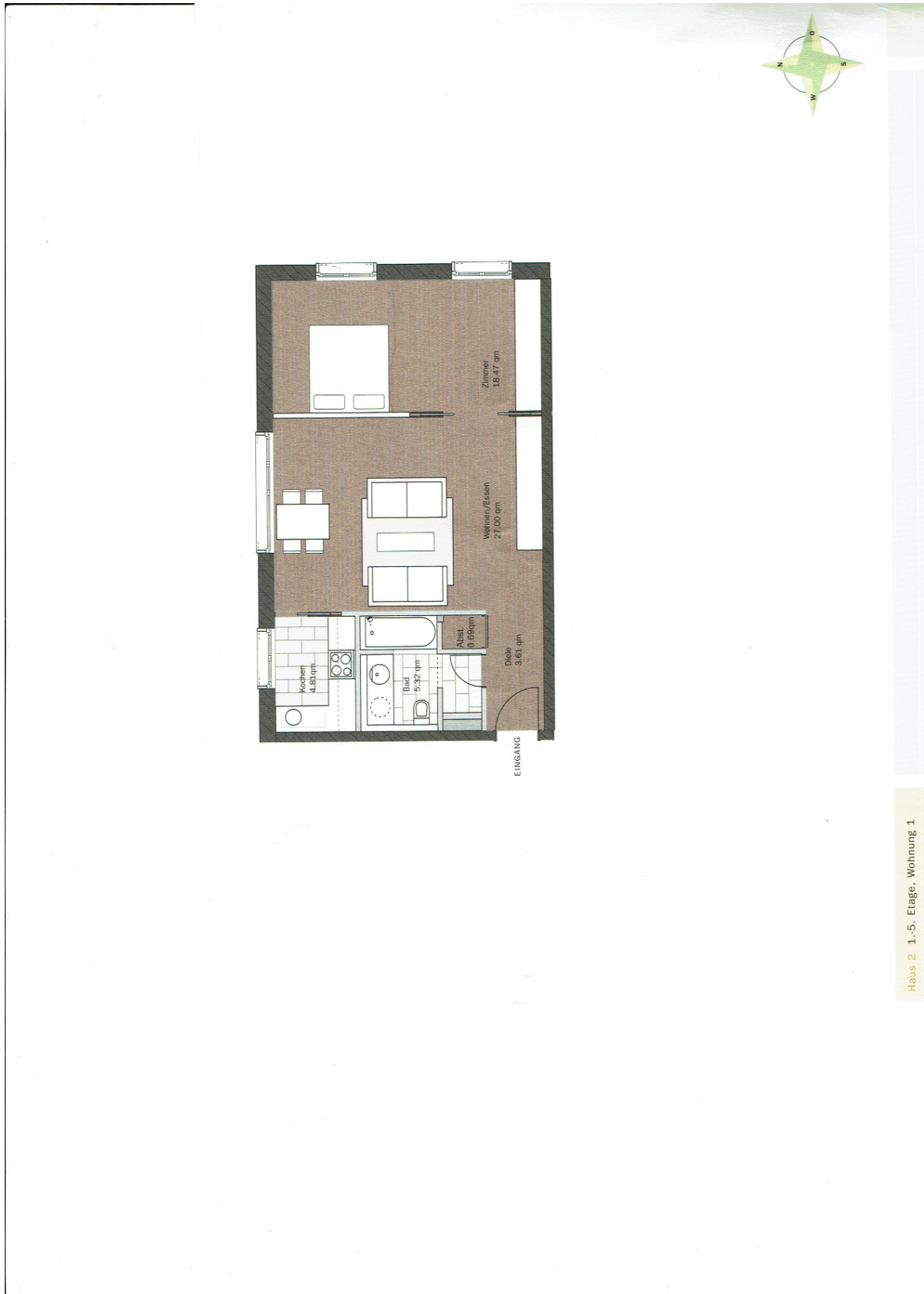
Haus 2 1.-5. Etage, Wohnung 1