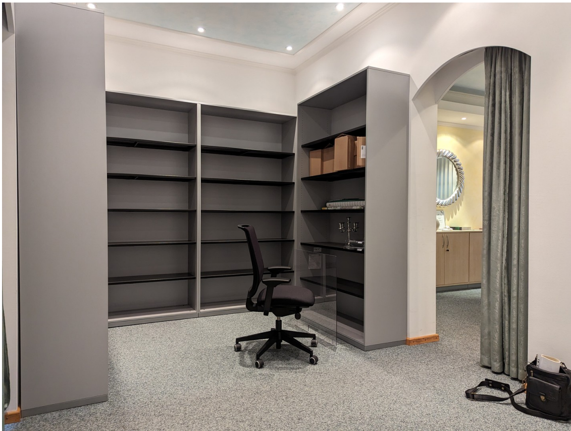
abgetrennte Lager / Bürofläche