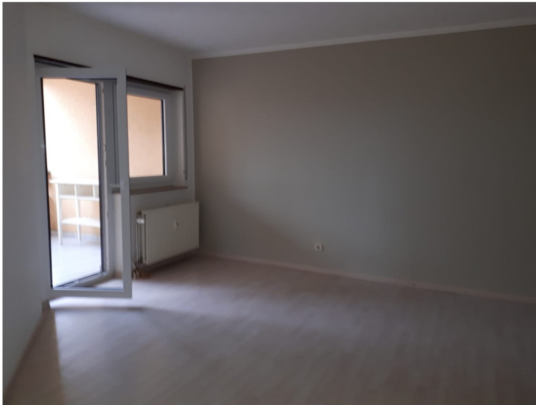
Schlafzimmer mit Zugang Balkon