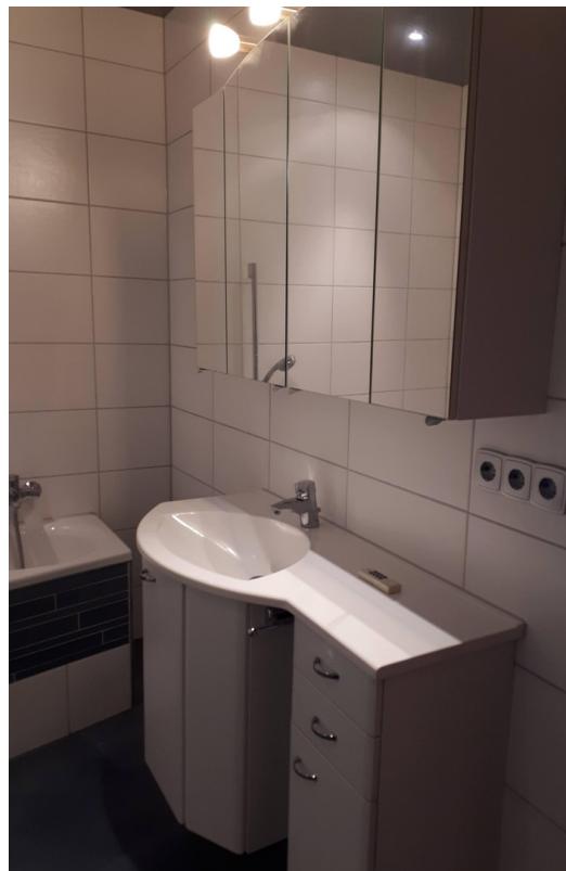
Bad m integr Waschbecken/Möbel