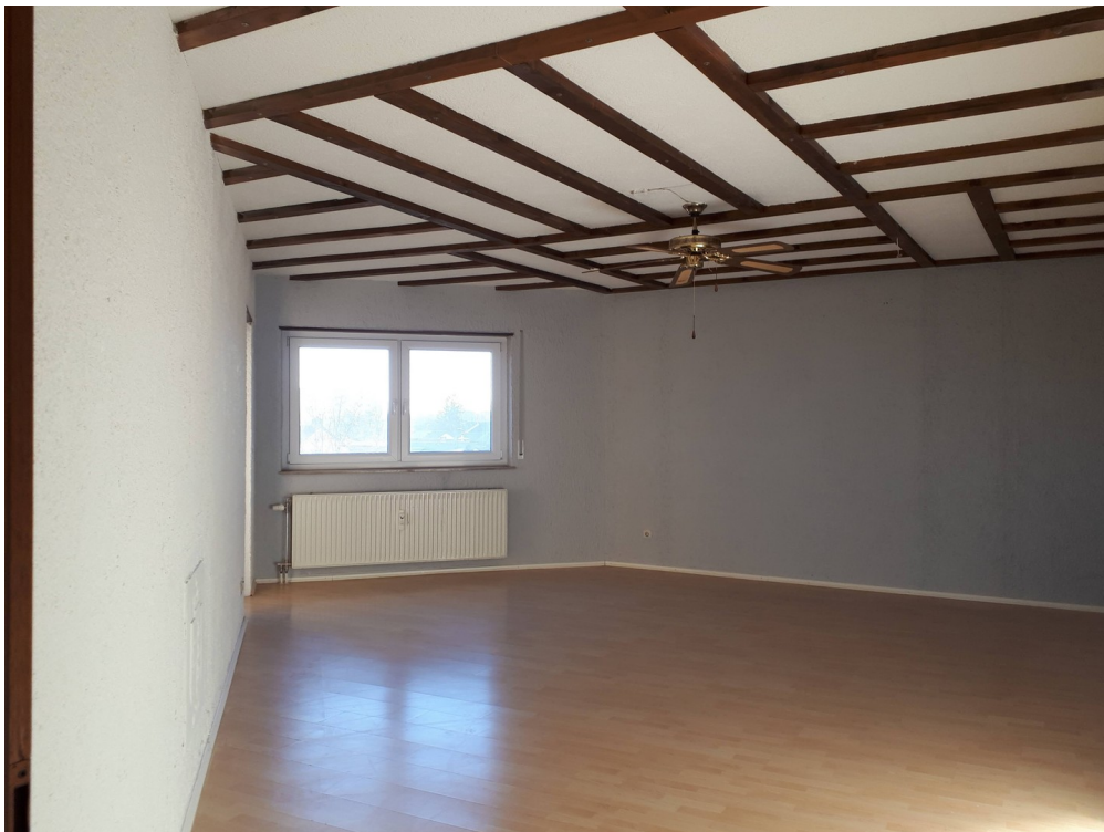
Wohnzimmer mit Zugang Balkon