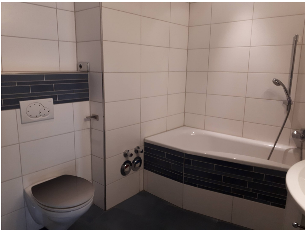
Renov. Bad mit B-Wanne/Dusche