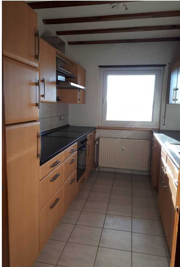
Vollausgestattete EB Kueche