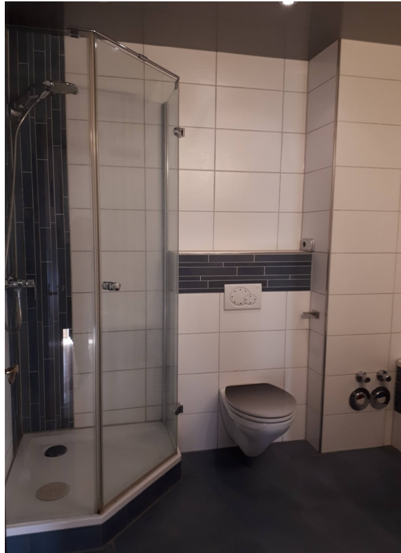
Bad mit Dusche/Badewanne/Möbel