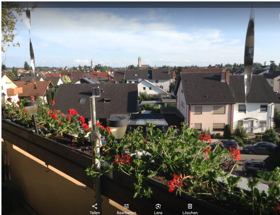
Balkon Ausblick Hockenheim