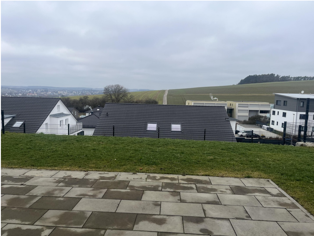
Terrasse mit Ausblick