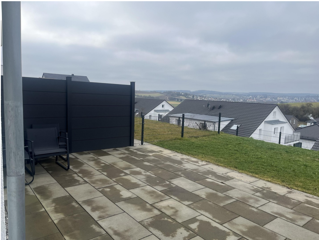
Terrasse mit Sichtschutz