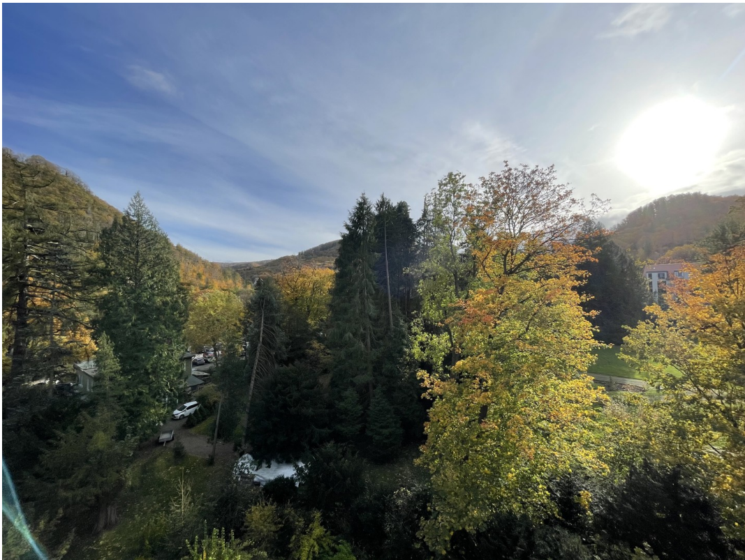
Blick nach Südosten