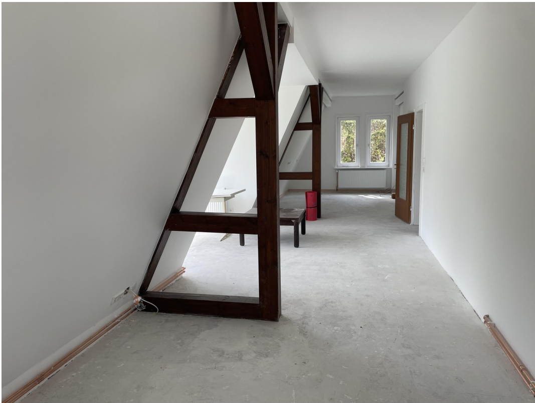
Wohnzimmer nach Westen