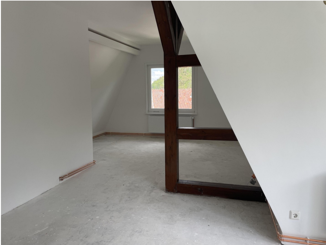
Wohnzimmer nach Osten