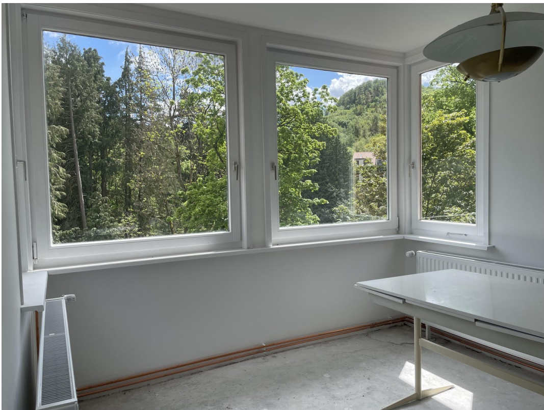
Erker Fenster nach S, O, W