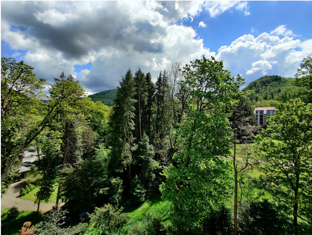
Blick nach Süden