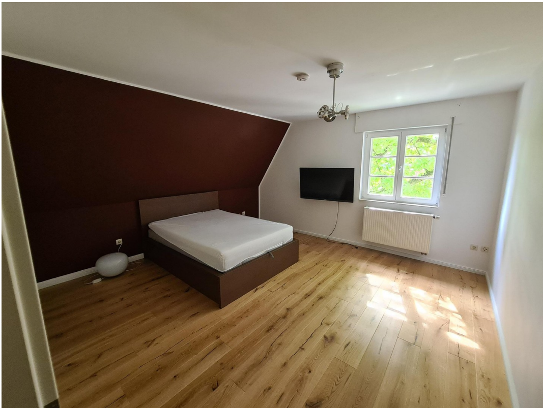
Schlafzimmer 2. OG