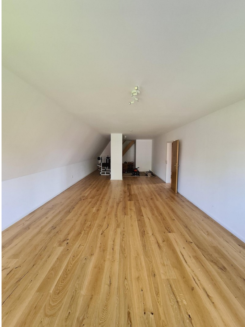
Dachboden 2. OG