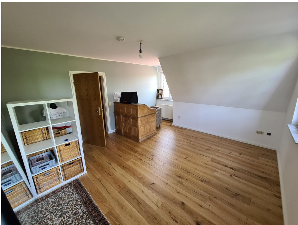
Schlafzimmer 2. OG