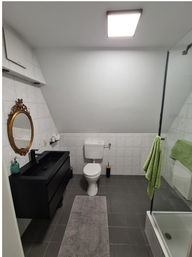
Bad 2. OG