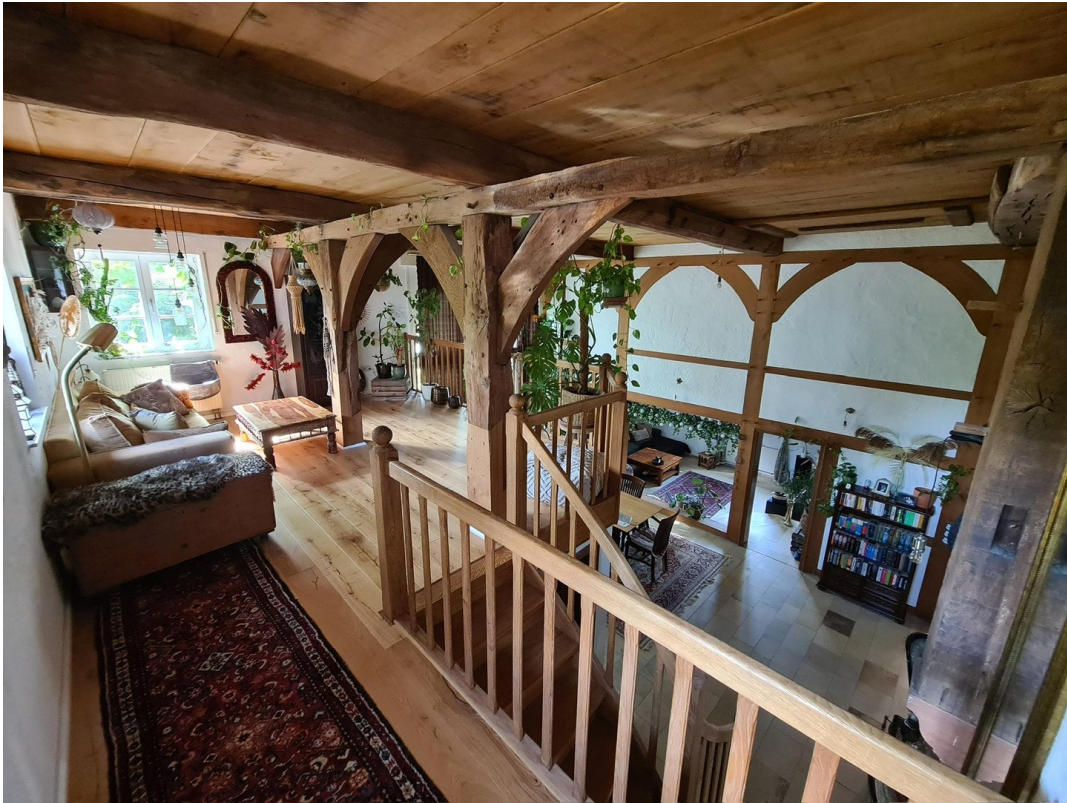
Galerieblick aufs Wohnzimmer