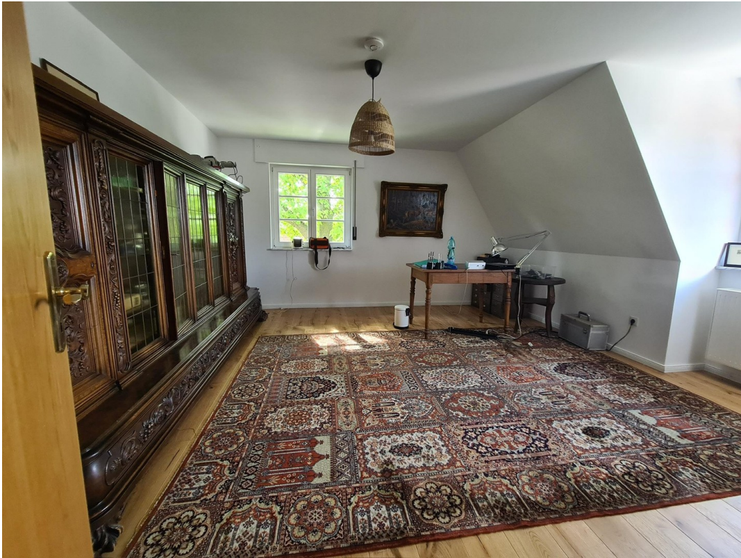
Schlafzimmer 2. OG