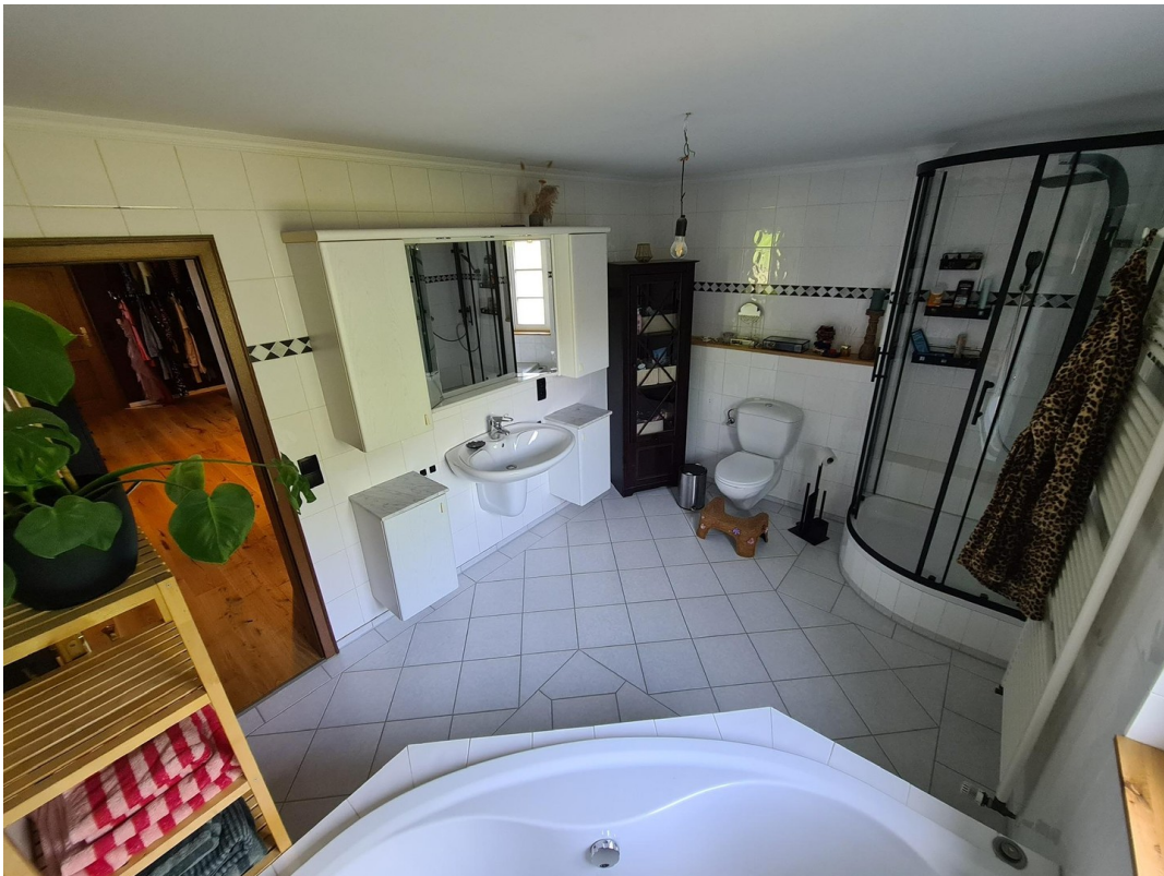
En-Suite-Bad Schlafz. Galerie