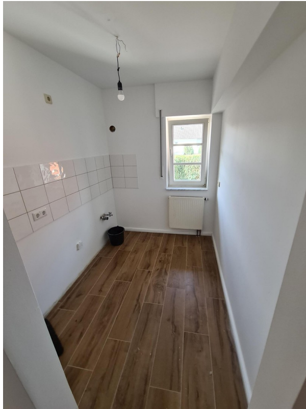
Teeküche 1. OG