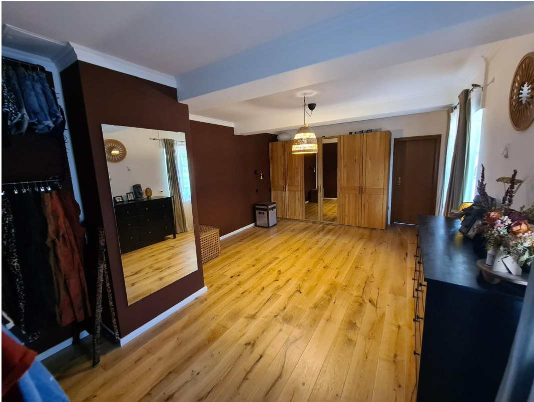
Schlafzimmer an d. Galerie