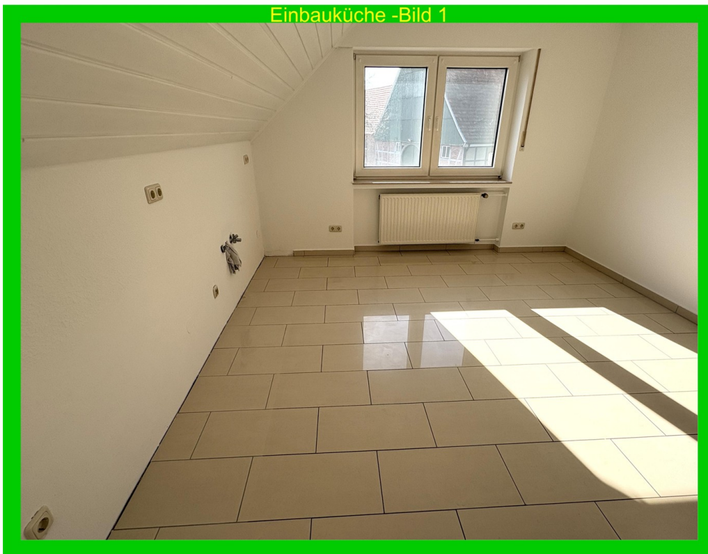
Einbauküche -Bild 1