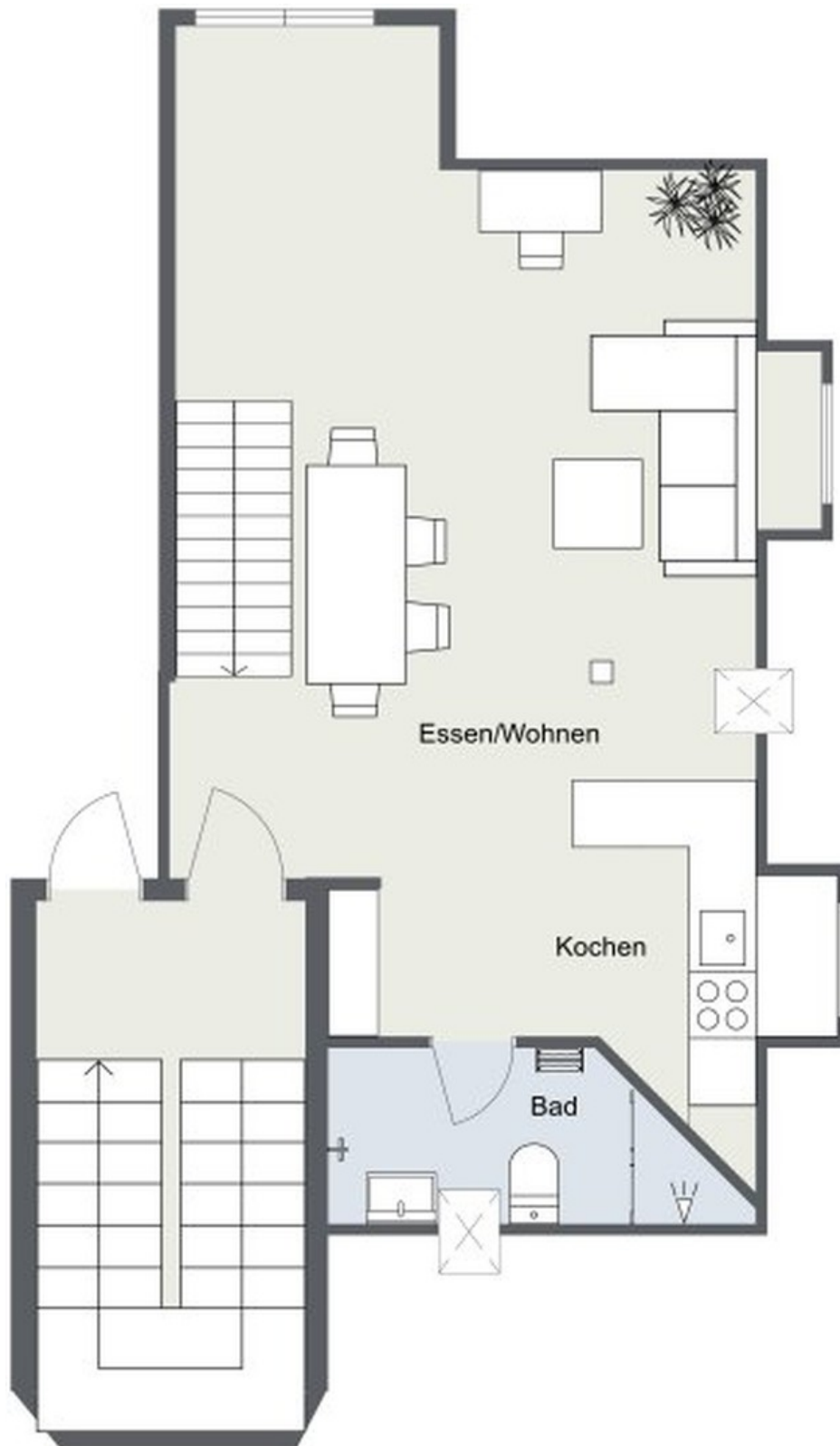
1. Ebene Galeriewohnung