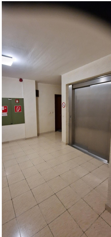
Treppenhaus + Aufzug