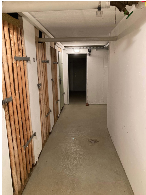
trockener, warmer Keller