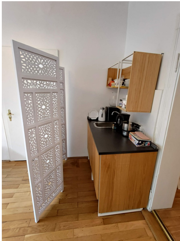
Teeküche zur Mitnutzung