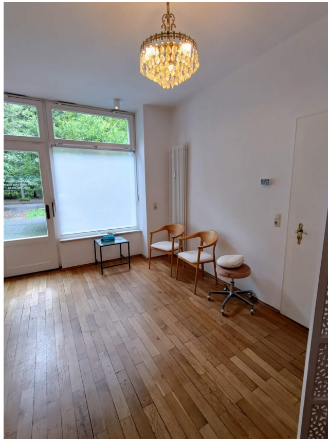
Eingangsbereich zur Mitnutzung