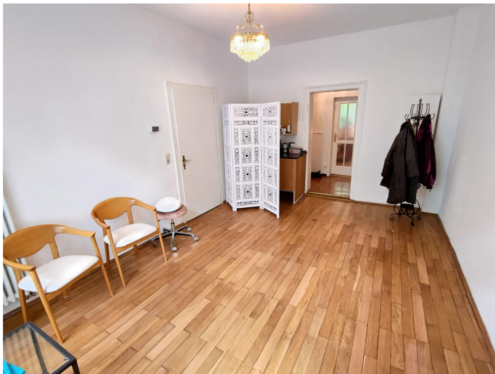
Eingangsbereich zur Mitnutzung