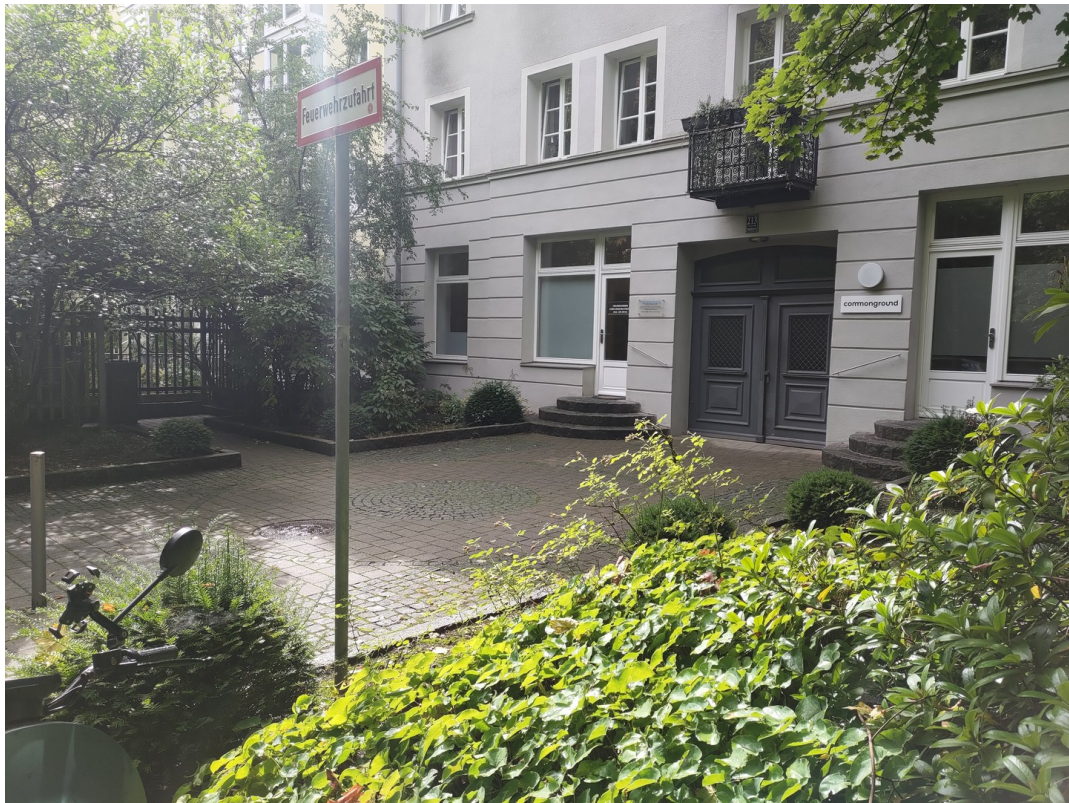
Blick auf Praxis