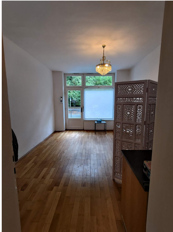
Blick nach draußen