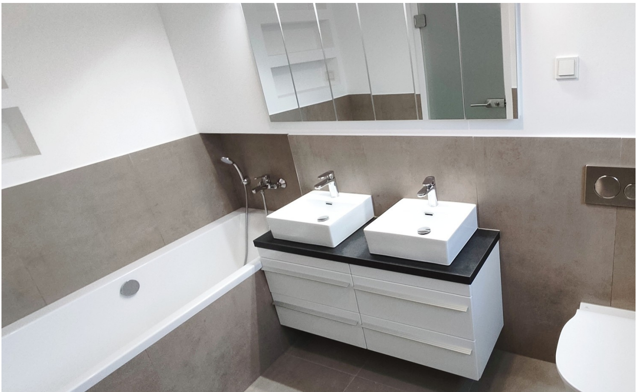
Das herrliche Kinderbad