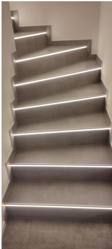
Die beleuchtete Kellertreppe