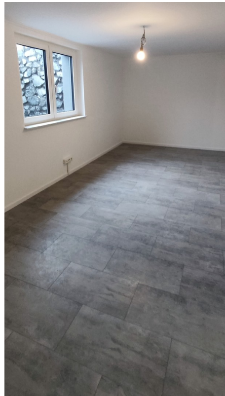
Das großzügige Arbeitszimmer