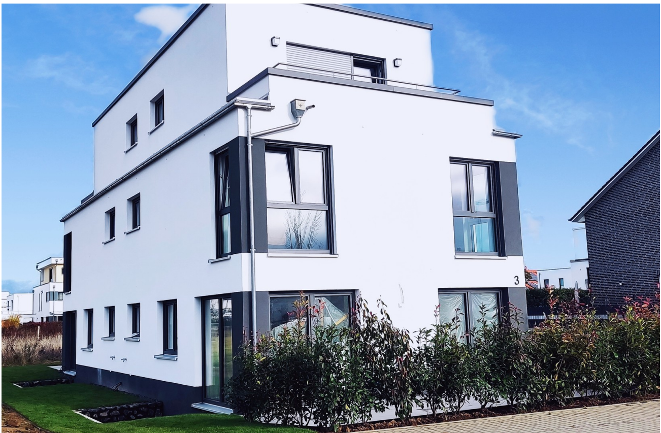
Der Blick von der Straße