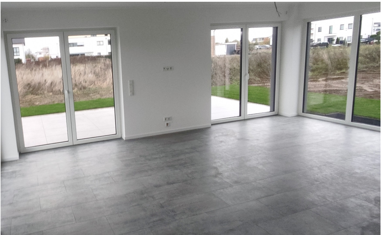
Der helle Wohnbereich