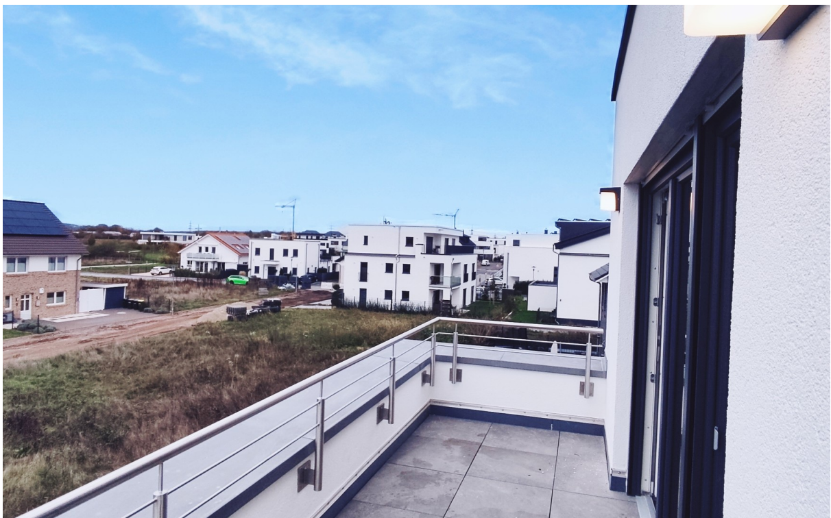
Die traumhafte Dachterrasse