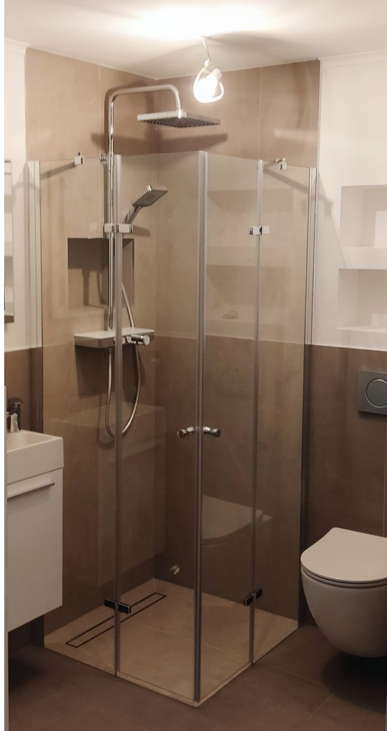
Das Gäste- bzw. Saunabad