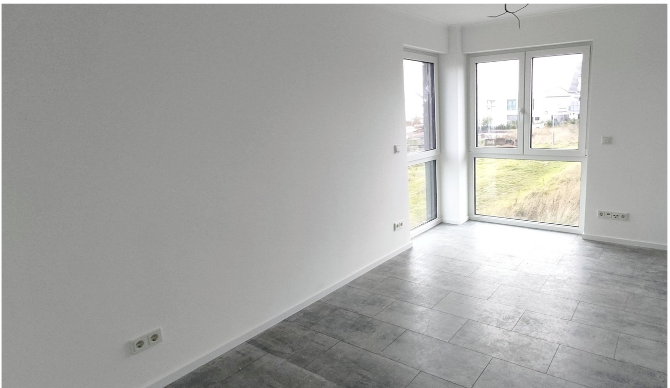
Zwei identische Kinderzimmer