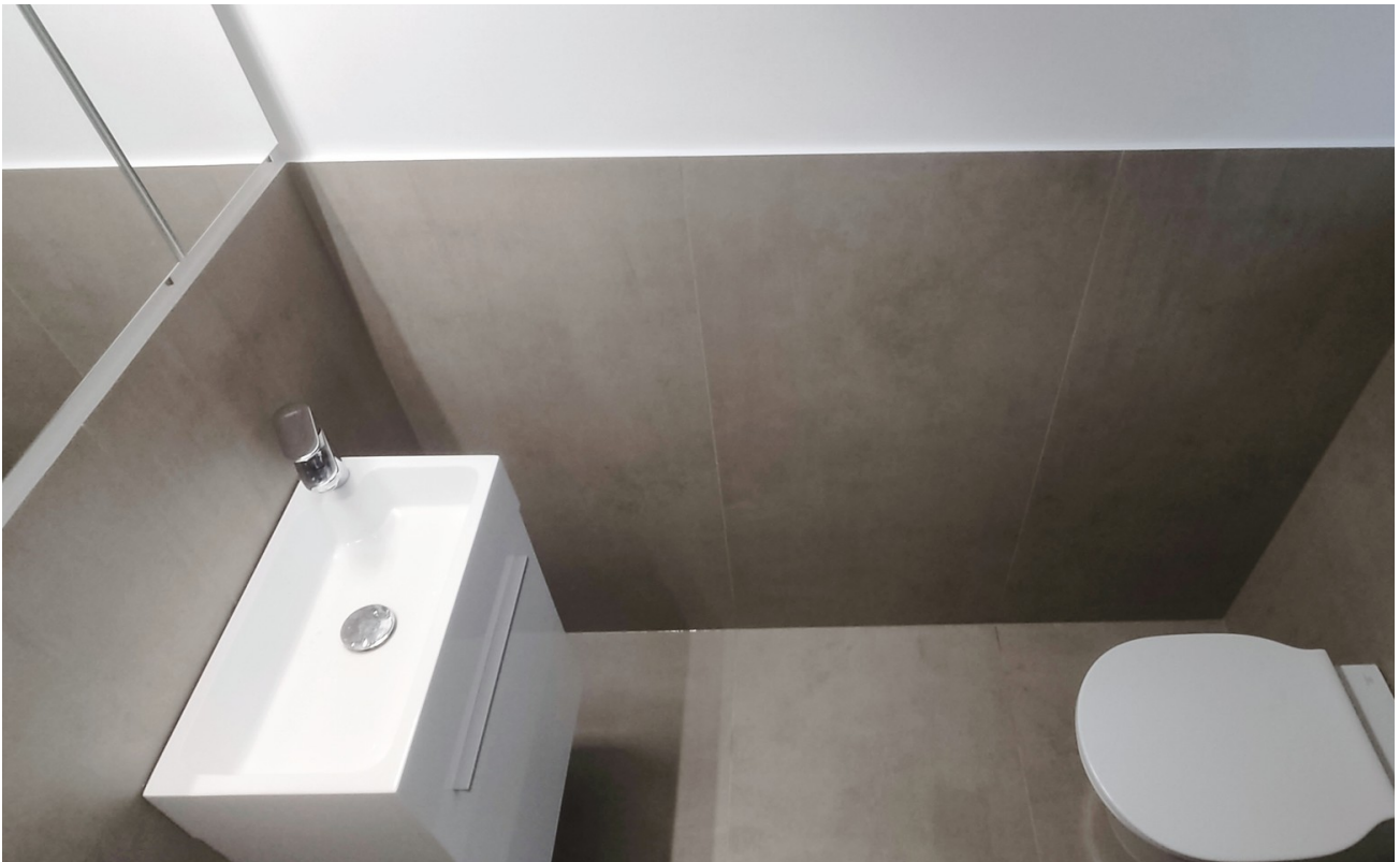
Das WC im Erdgeschoss