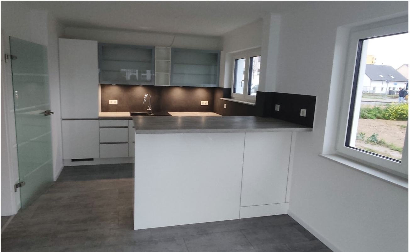
Hochwertige Küche mit Theke