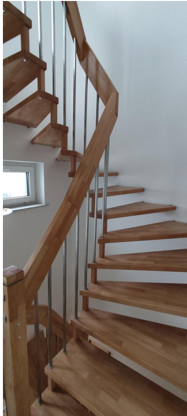
Die edle Treppe