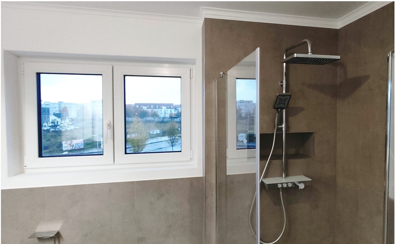
Regendusche im Elternbad