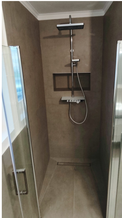
Die ebenerdige Kinderdusche