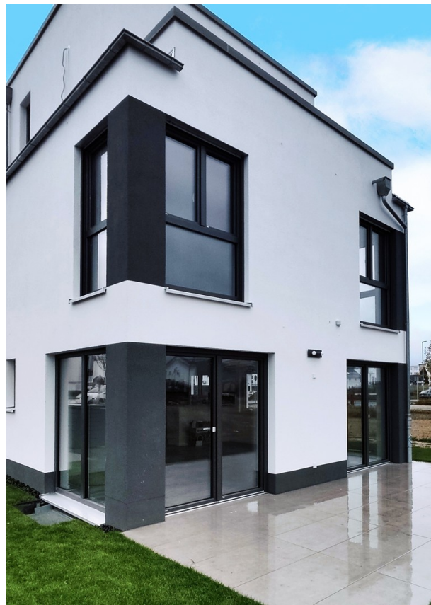
Die rückseitige Terrasse