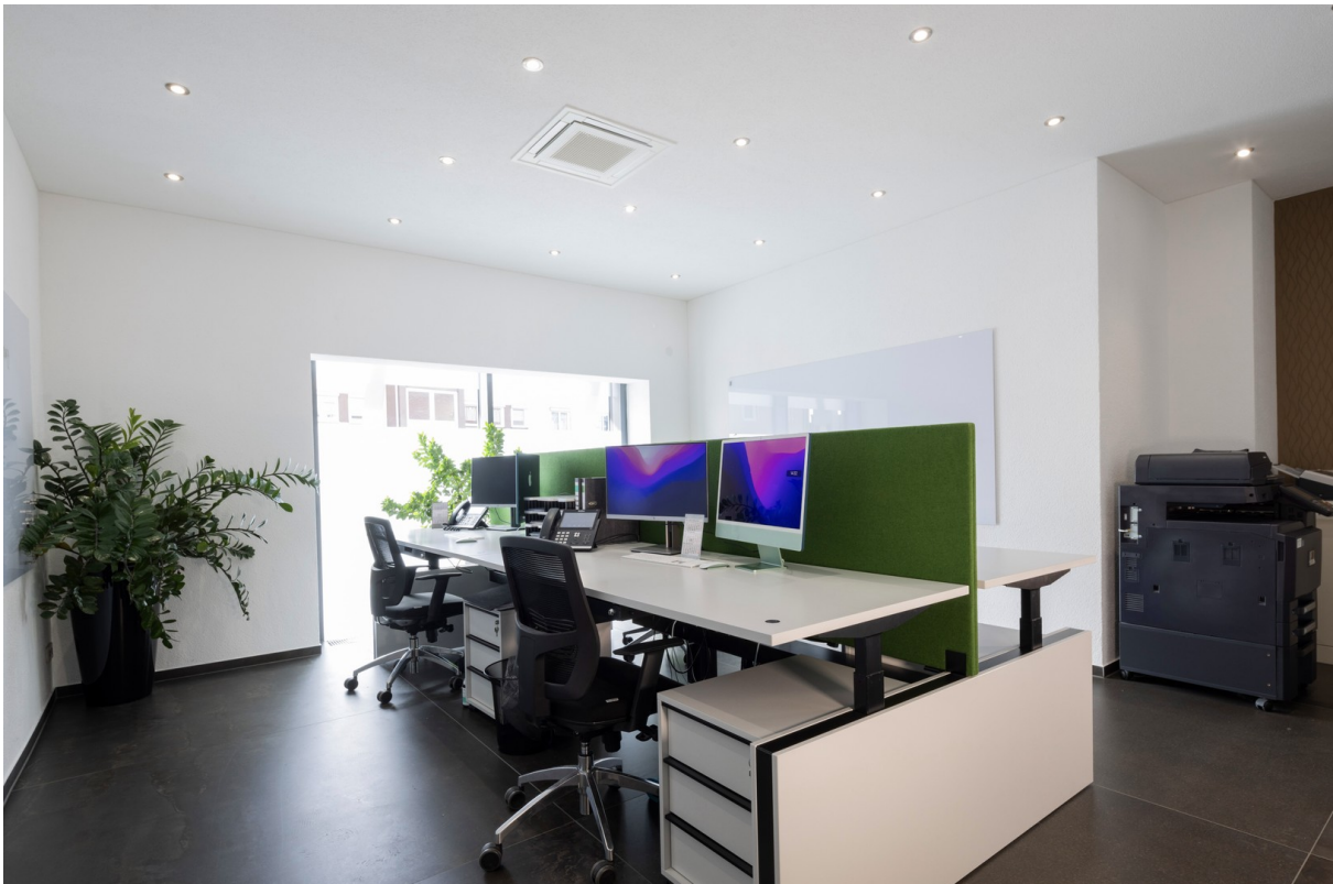
4-Desk (höhenverstellbar Desk)