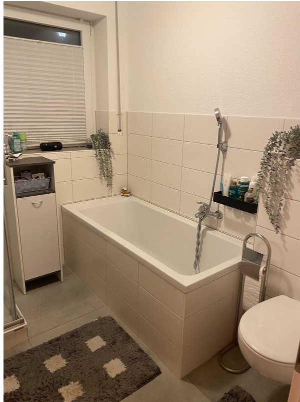
Bad mit Badewanne und Dusche