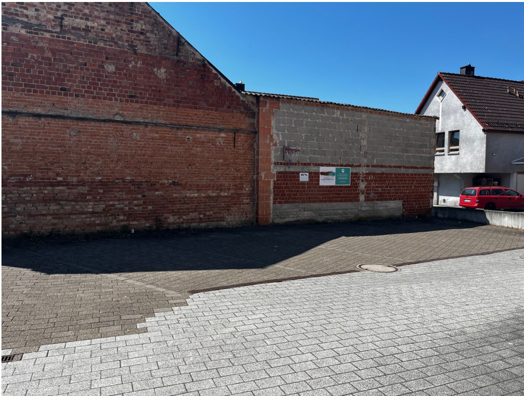
18 - Stellplatz