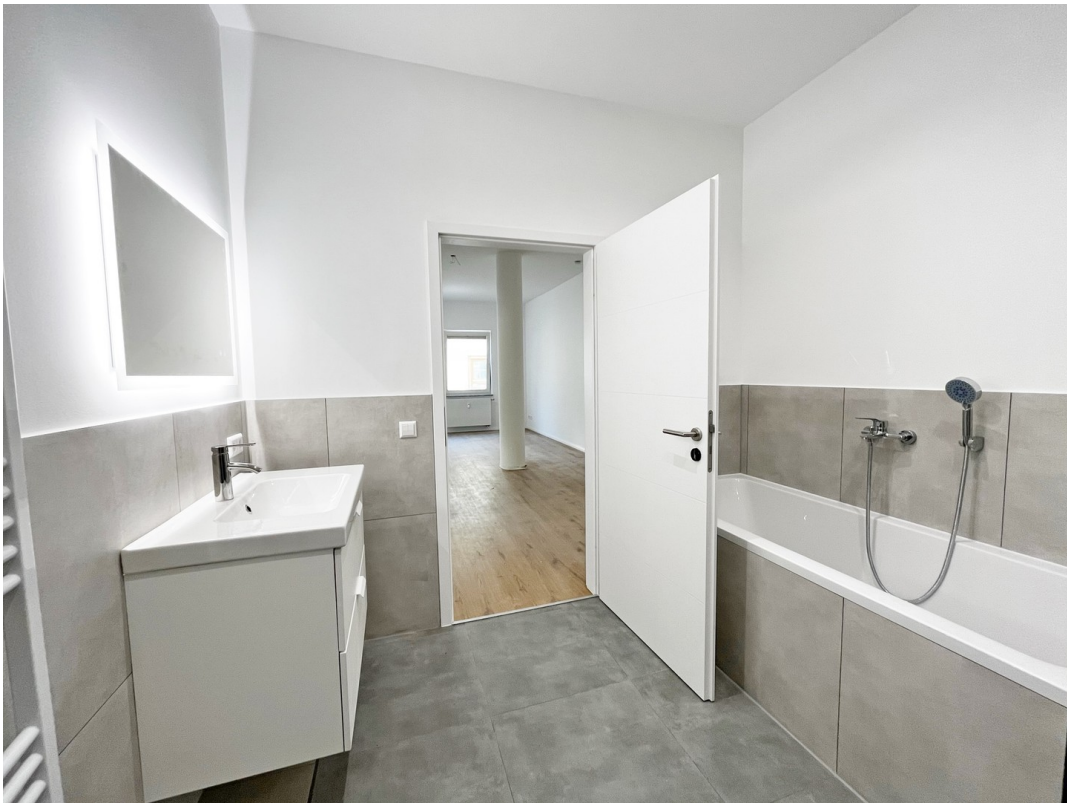
10 - Bad 02