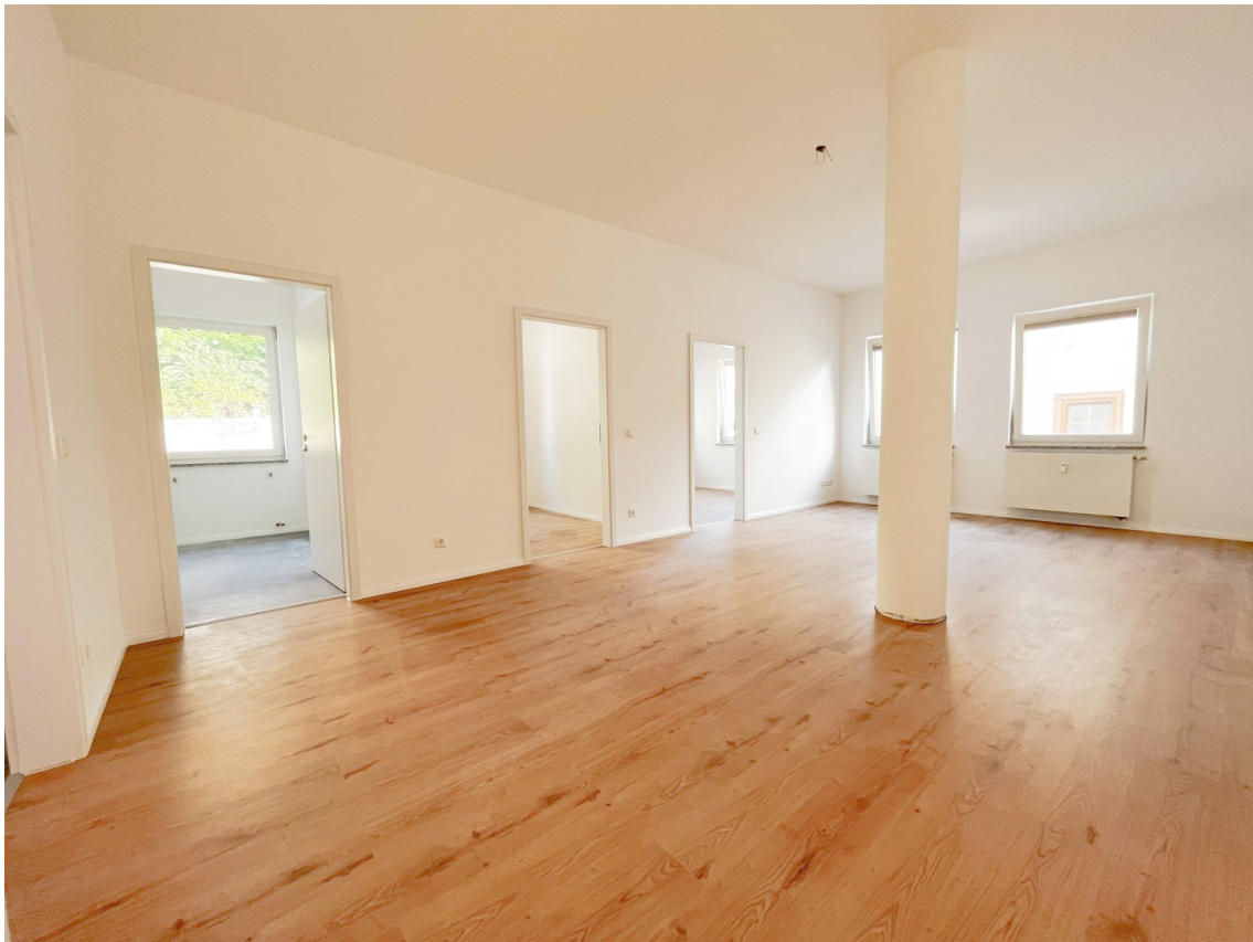
02 - Wohnen, Essen