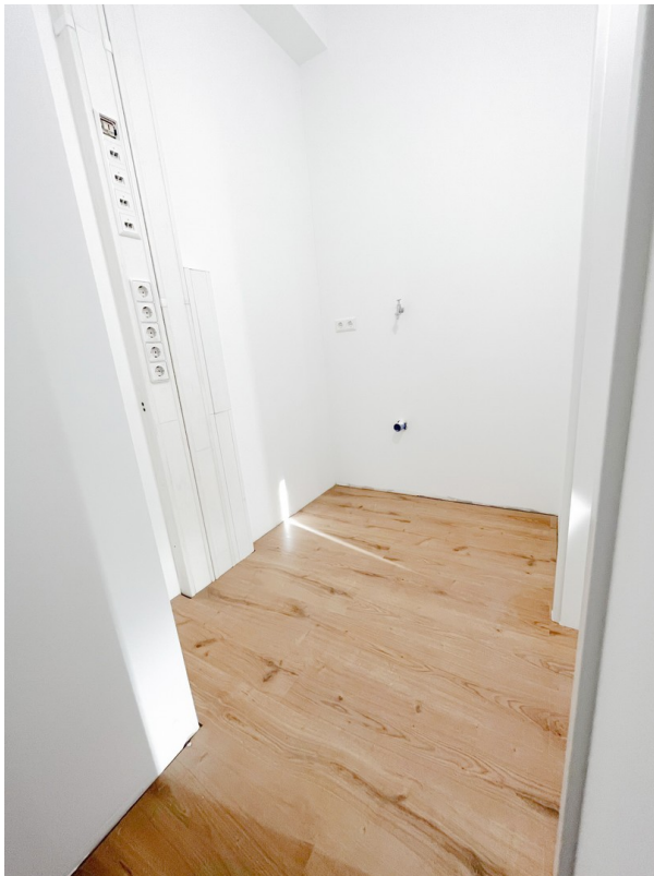
16 - Abstellraum