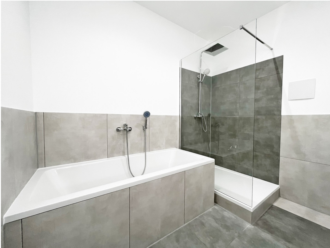
09 - Bad 01