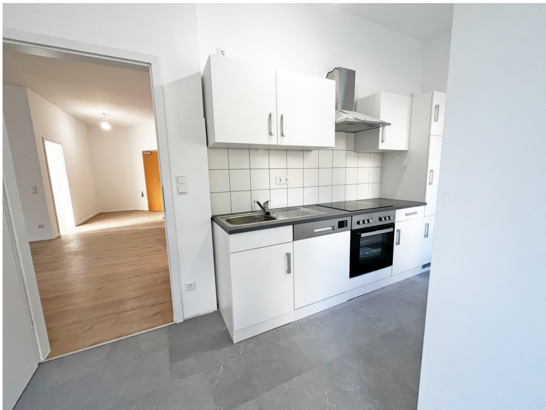
12 - Küche 01