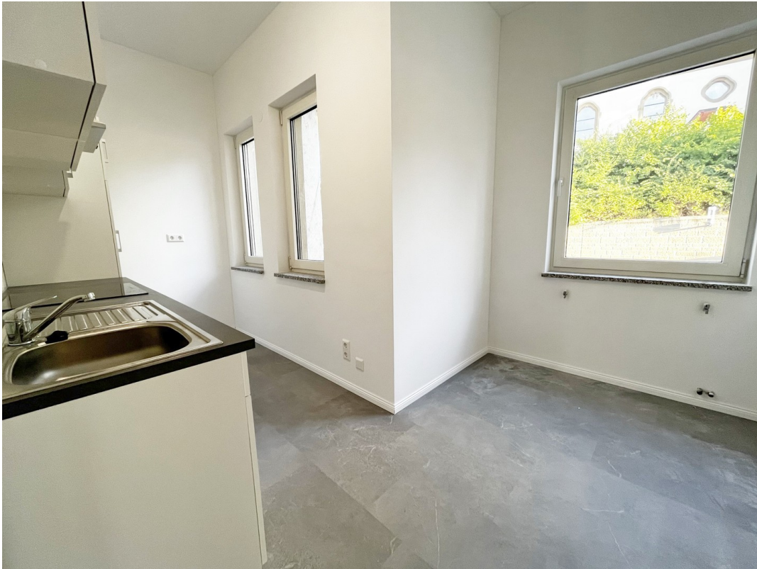
13 - Küche 02