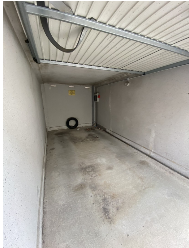
17 - Garage