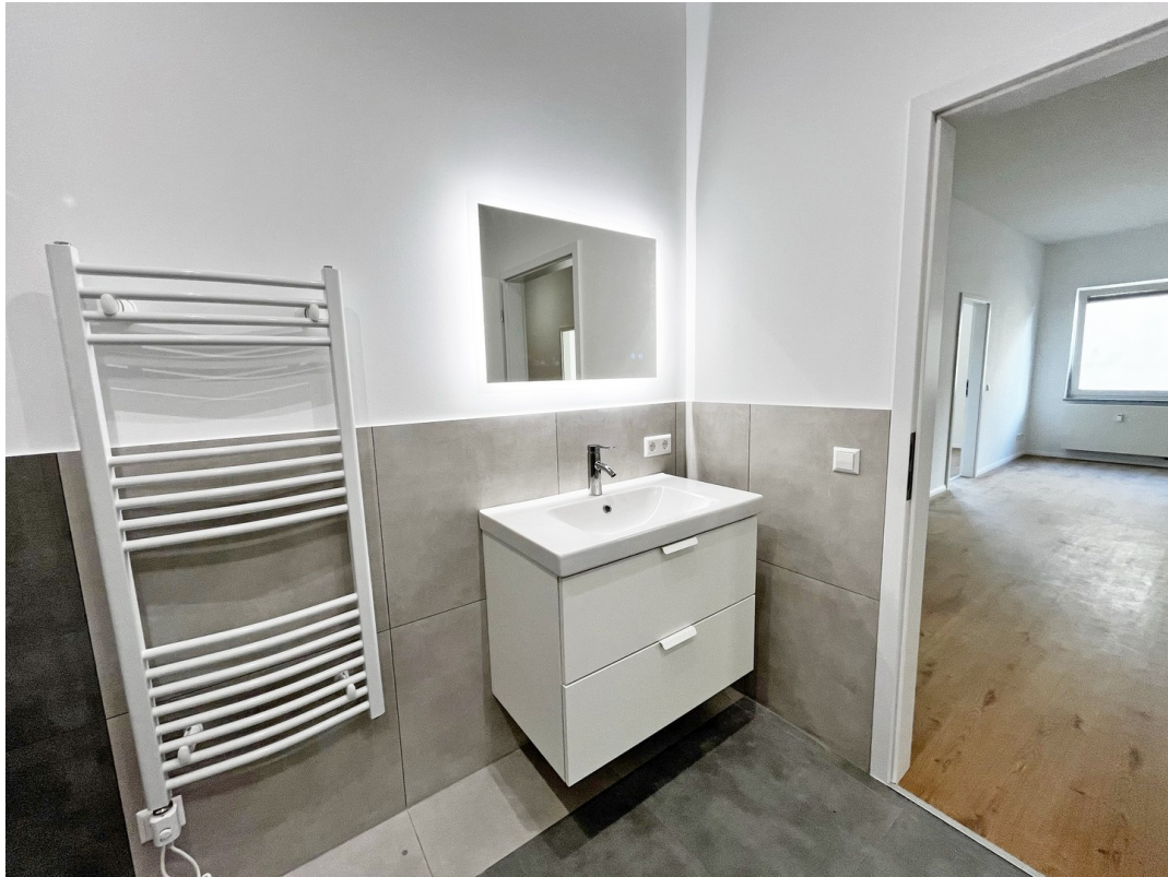
11 - Bad 03