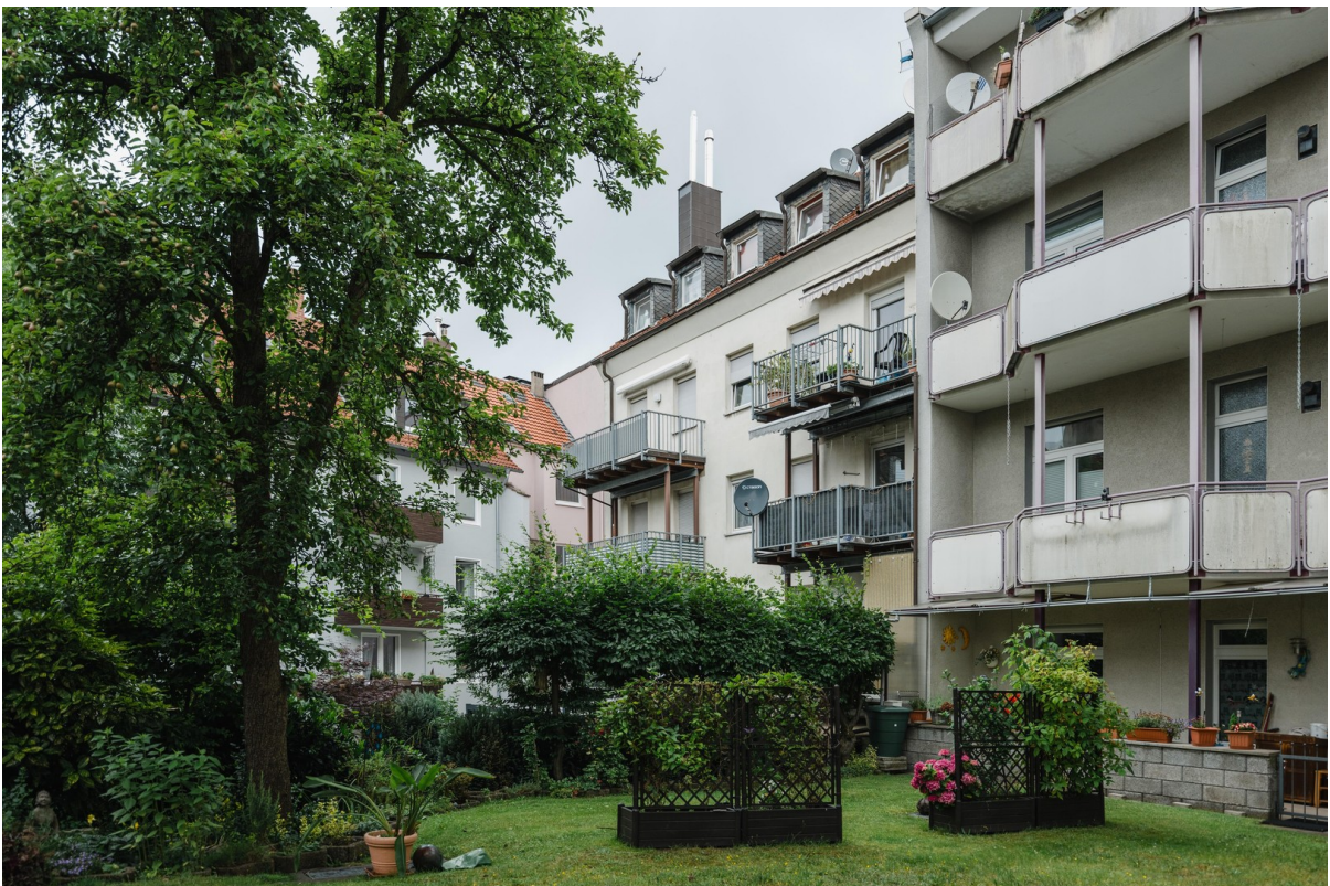
Rückansicht des Hauses