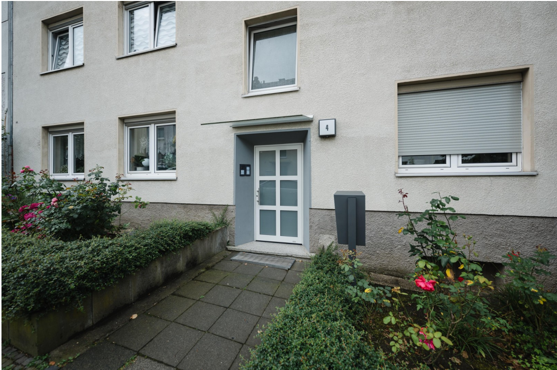
Eingang des Hauses