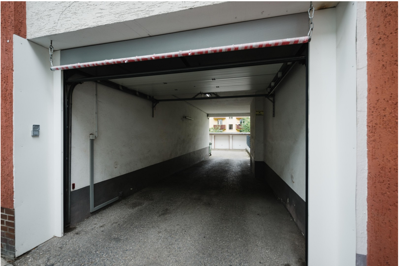
Zufahrt zum Parkplatz