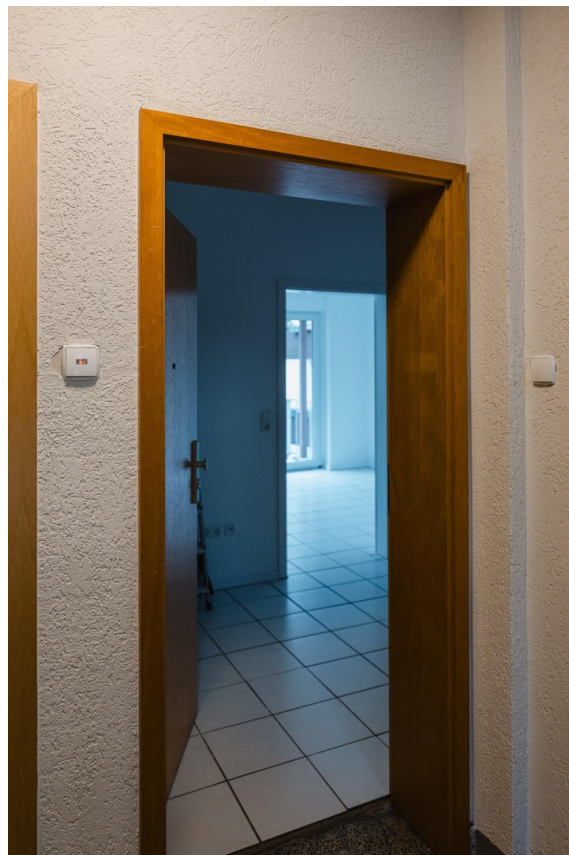
Eingang zur Wohnung