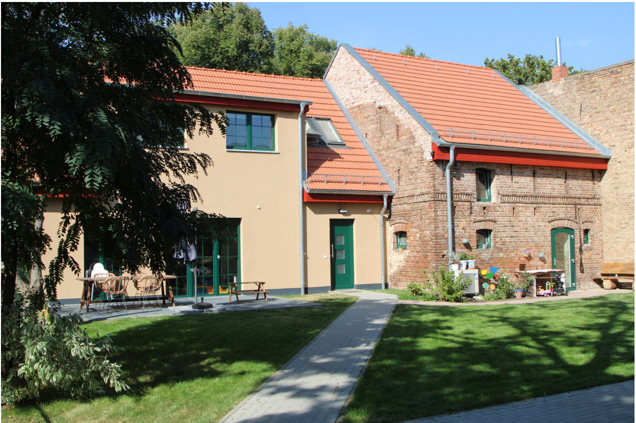
Blick vom Parkplatz