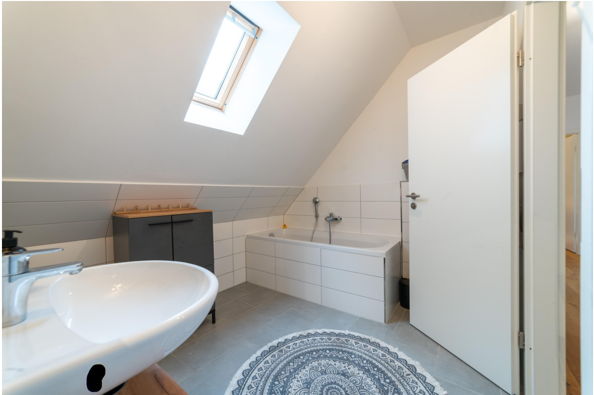
Bad mit Wanne & Dusche OG