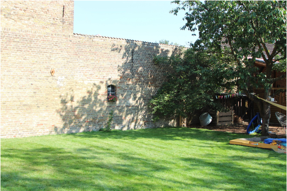
Grünfläche mit Kirschbäumen