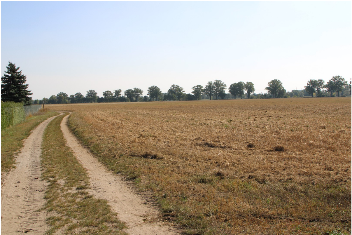
Feldblick vom Garten