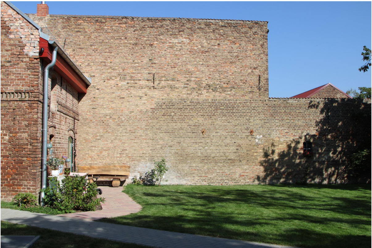
Mauer zum Nachbarshof