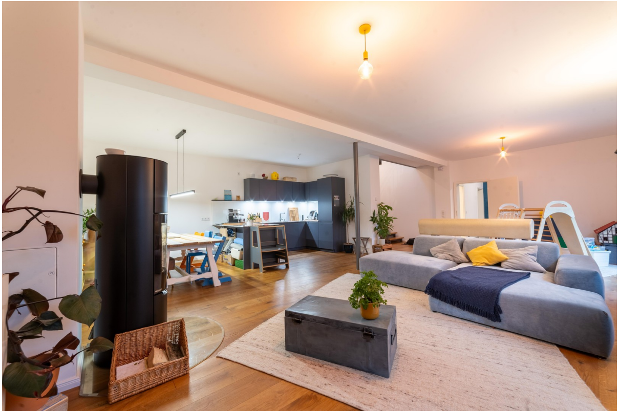
offene Wohnküche und Kamin