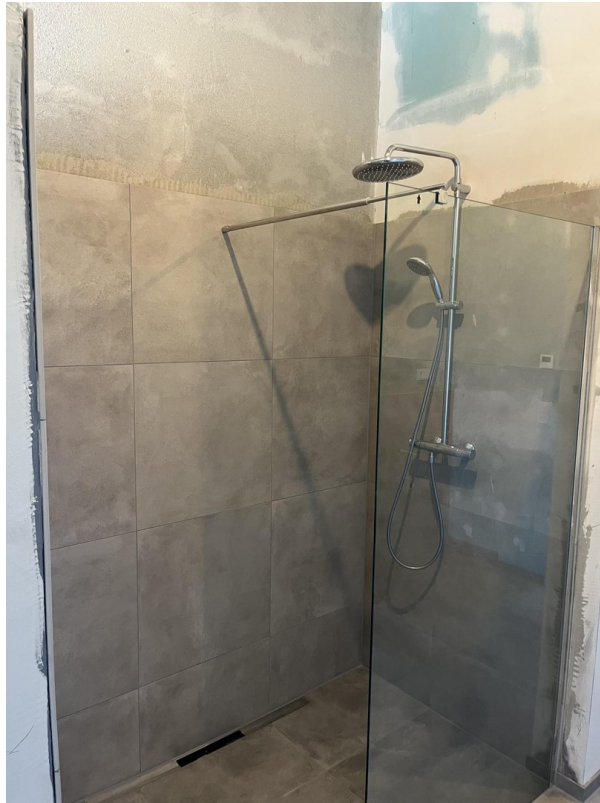
Bad OG Dusche