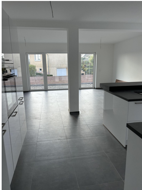
Wohnen/Essen Küche (bspw)