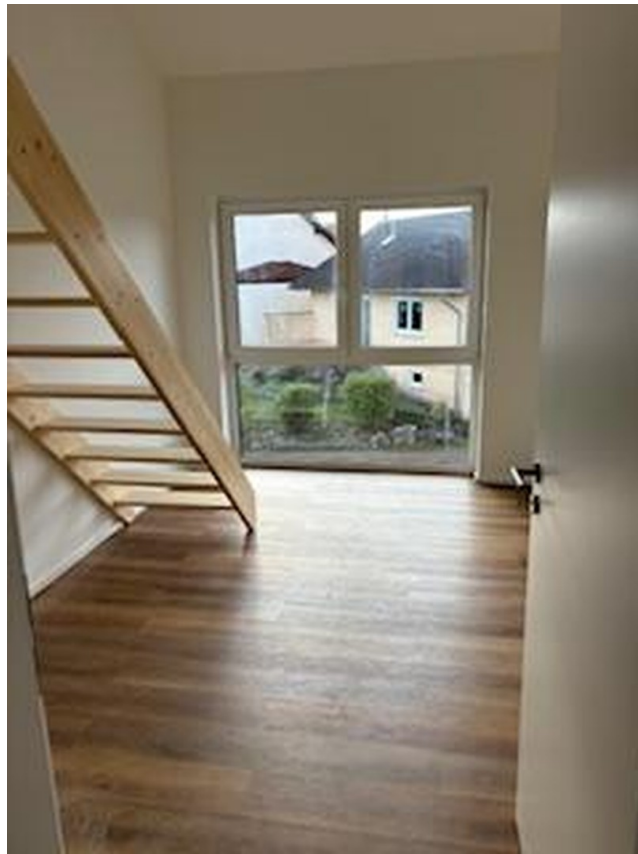
Kinderzimmer 1 (bspw)