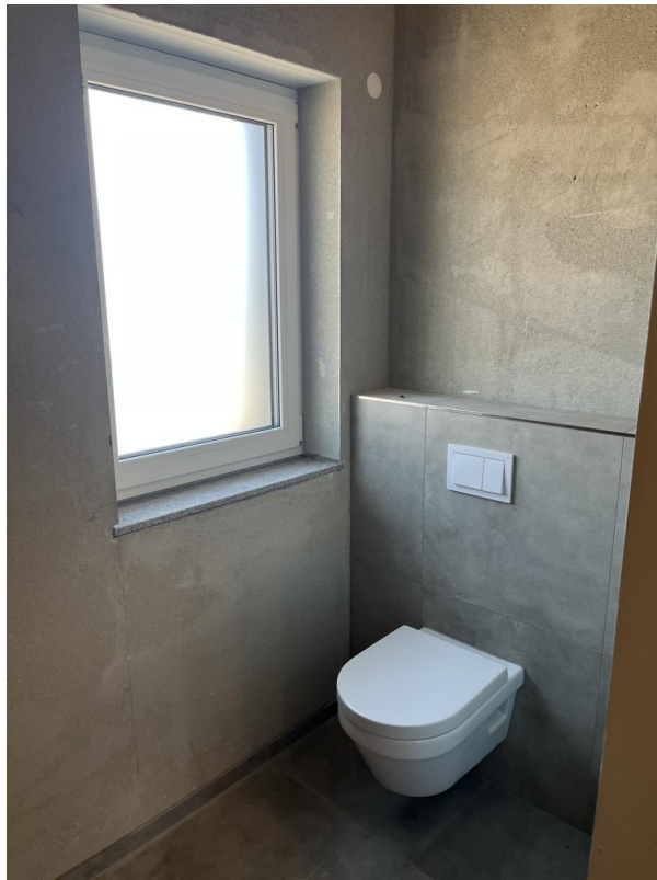
Bad OG WC