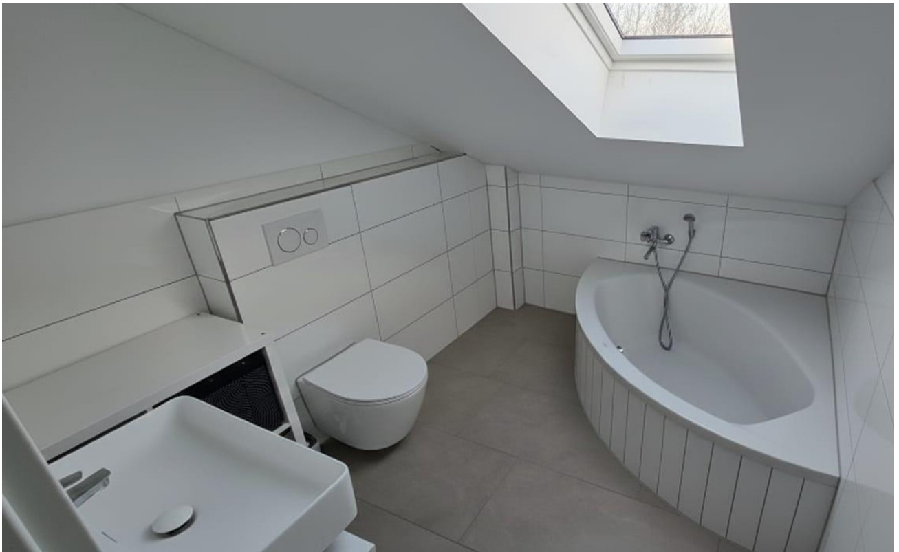
Bad 2. OG