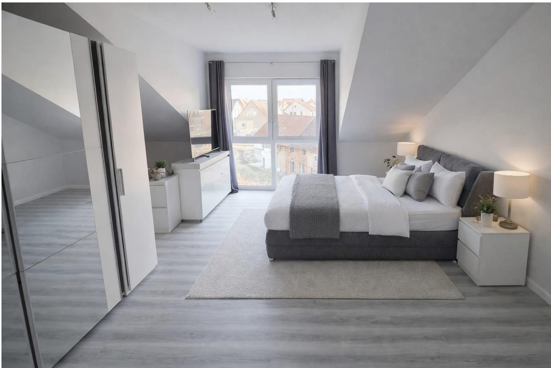
Zimmer 2. OG