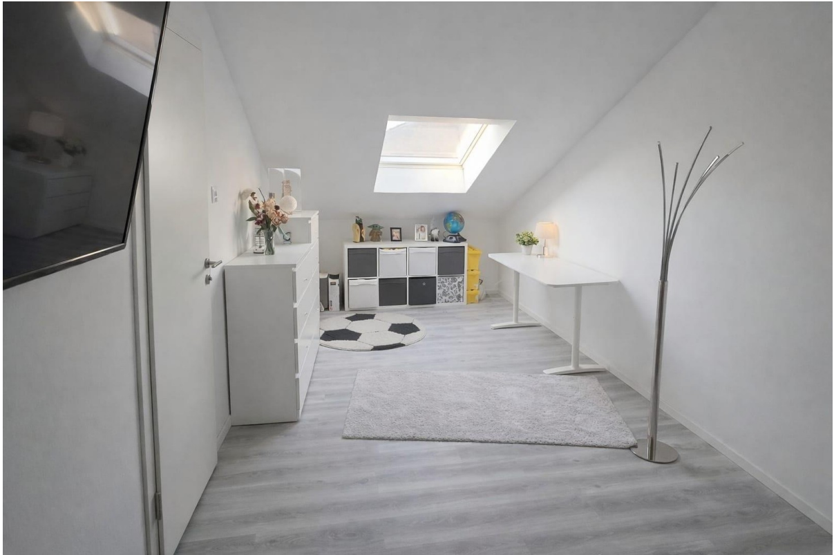
Zimmer 2. OG