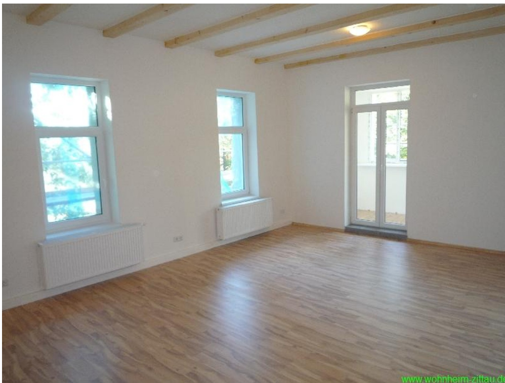
Zi. 2.2 m. Zugang Wintergarten