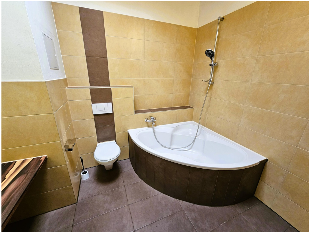
Bsp Bad vor Sanierung