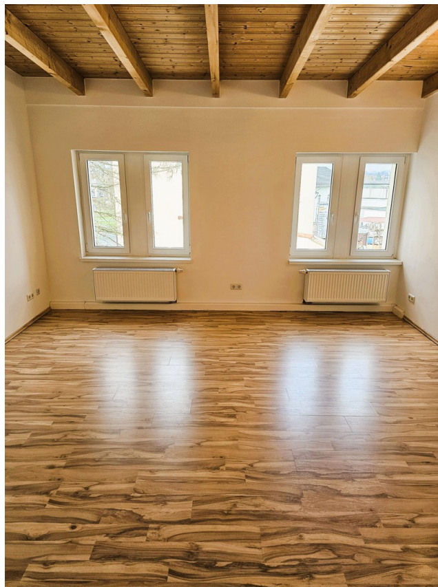
Zi. 2.3 mit 2 Fenstern