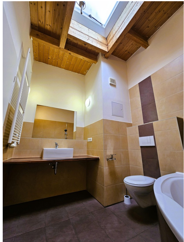
Bsp Bad vor Sanierung