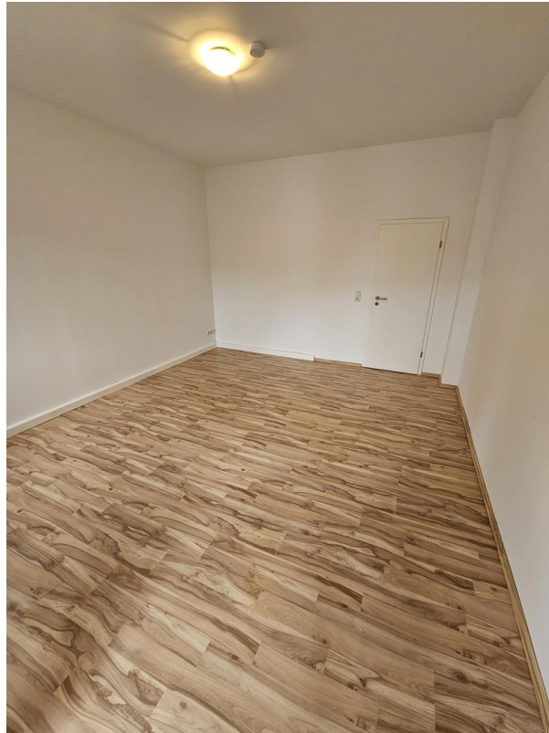
Zimmer 2.1 Tür zum Flur