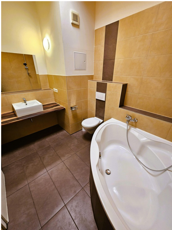
Bsp vor Sanierung