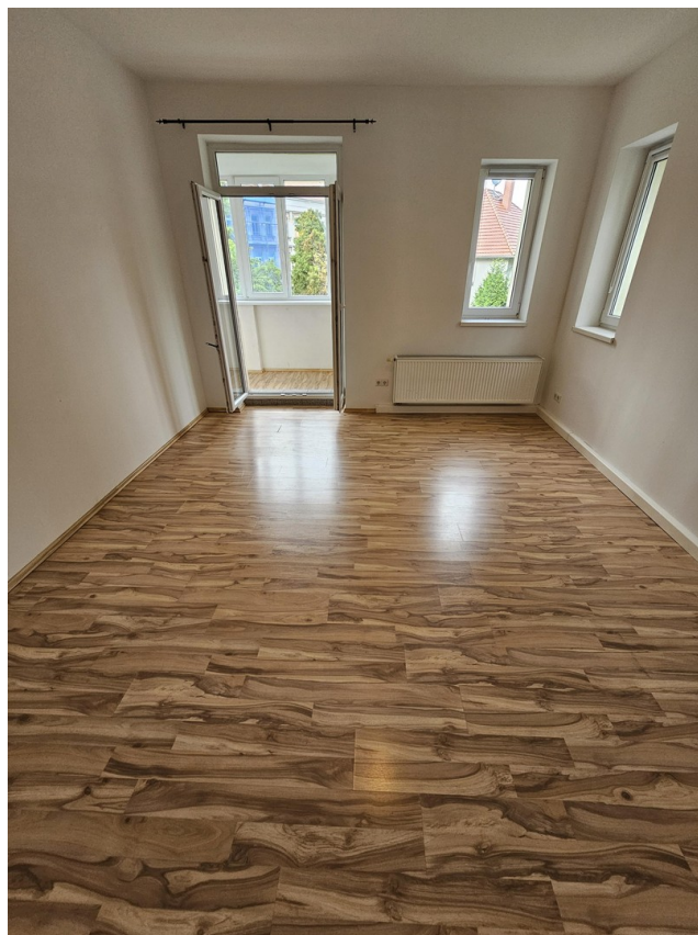
Zimmer 2.1 Zugang Wintergarten