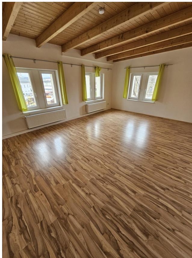
Bsp. Zi. 2.2