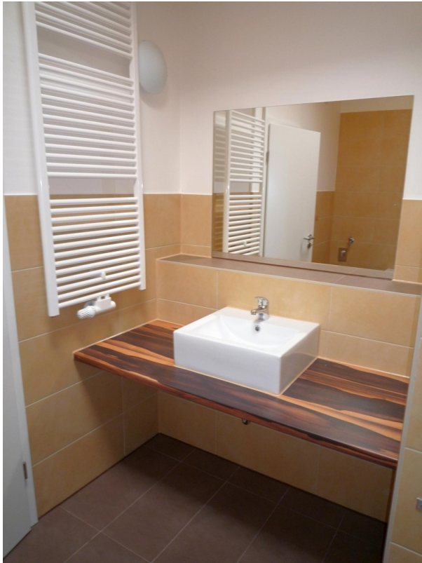
Bsp Bad vor Sanierung