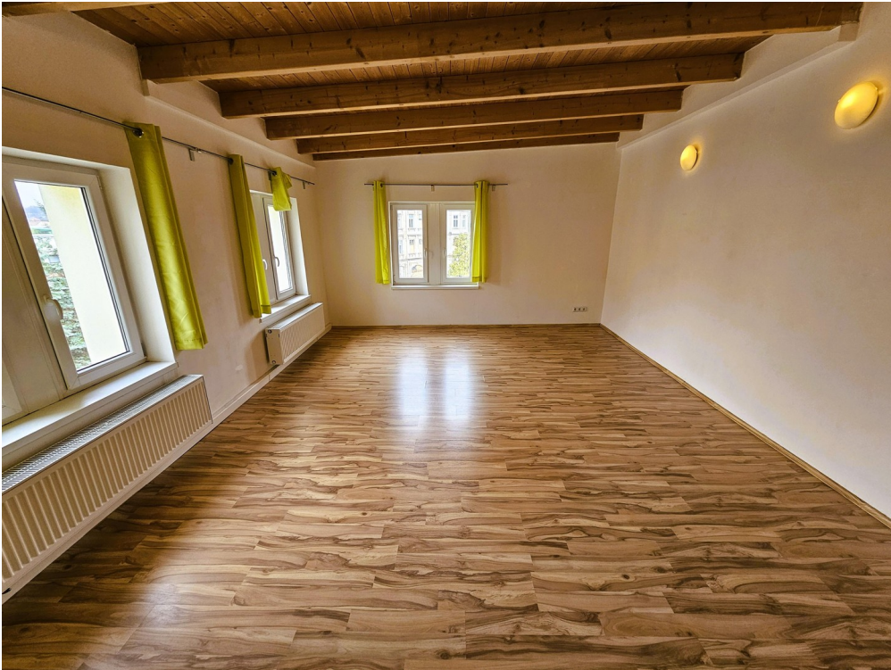
Bsp. Zi. 2.2