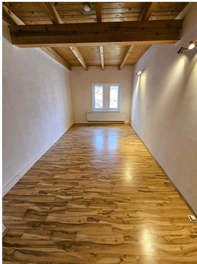
Bsp. Küche vor Sanierung