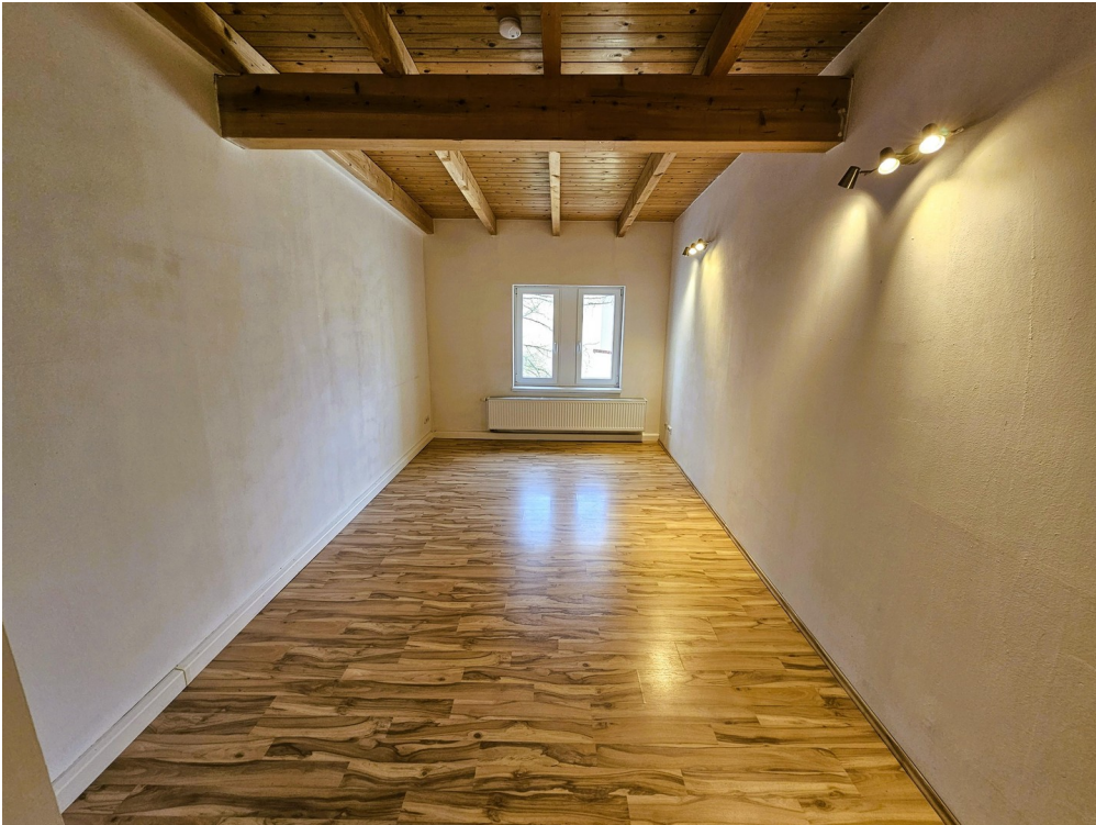
Bsp. Küche vor Sanierung