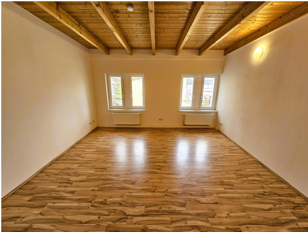
Zi. 2.3 mit 2 Fenstern