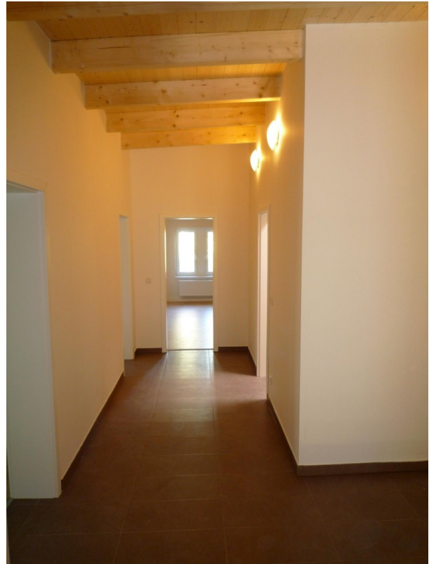
Bsp Flur vor Sanierung