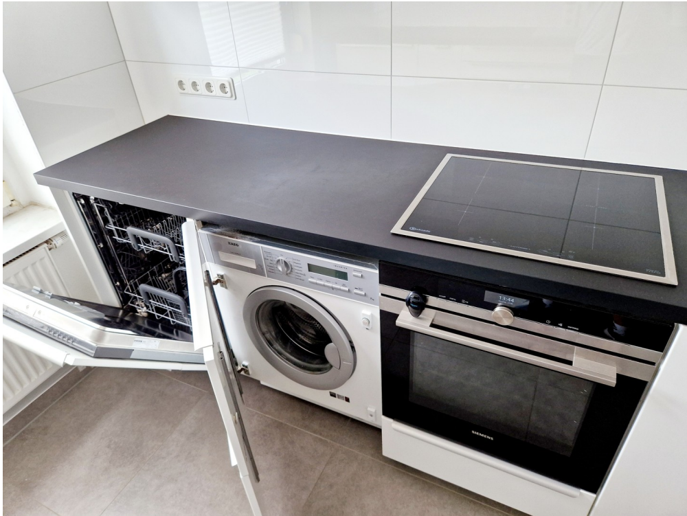
Einbauküche - Geräte