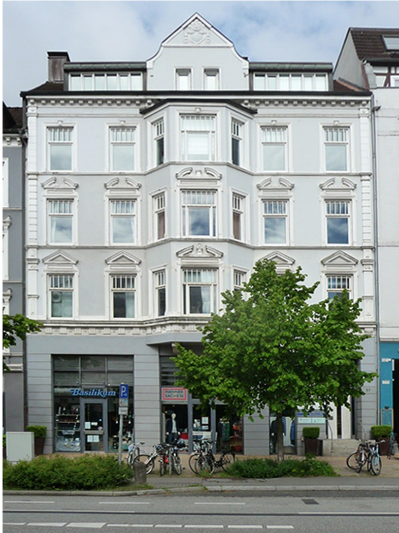
Außenansicht Haus 57