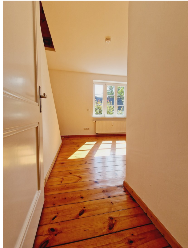
Zweites Zimmer OG