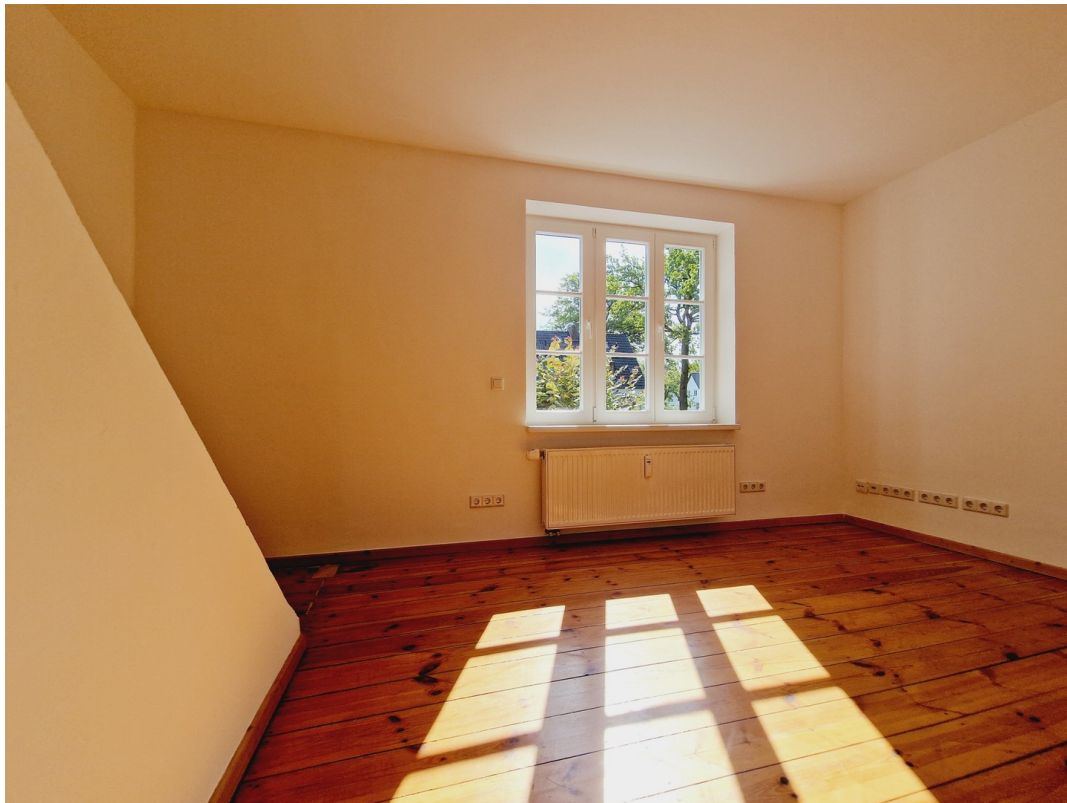
Zweites Zimmer OG