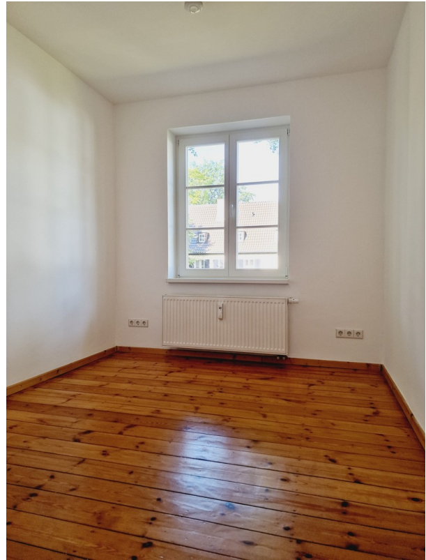
Erste Zimmer OG