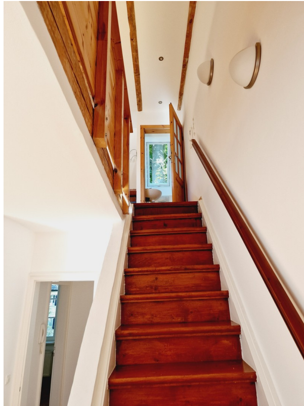
Treppe zum DG