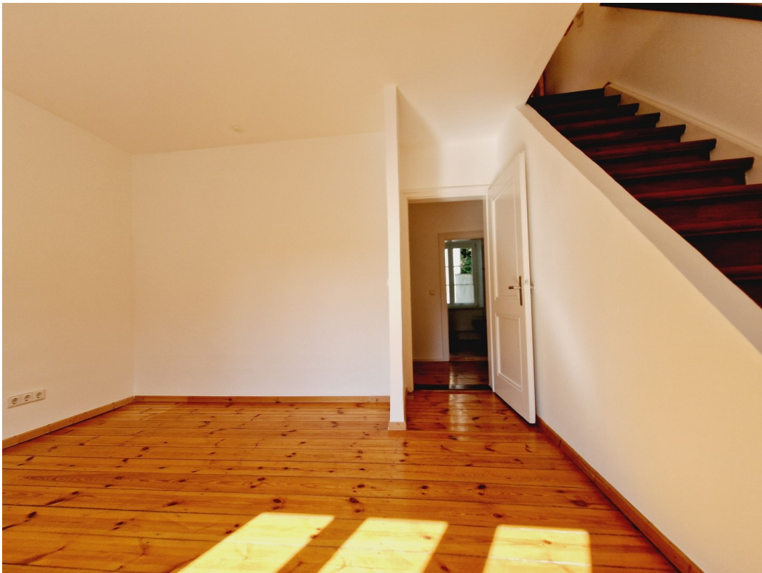
Zweites Zimmer OG