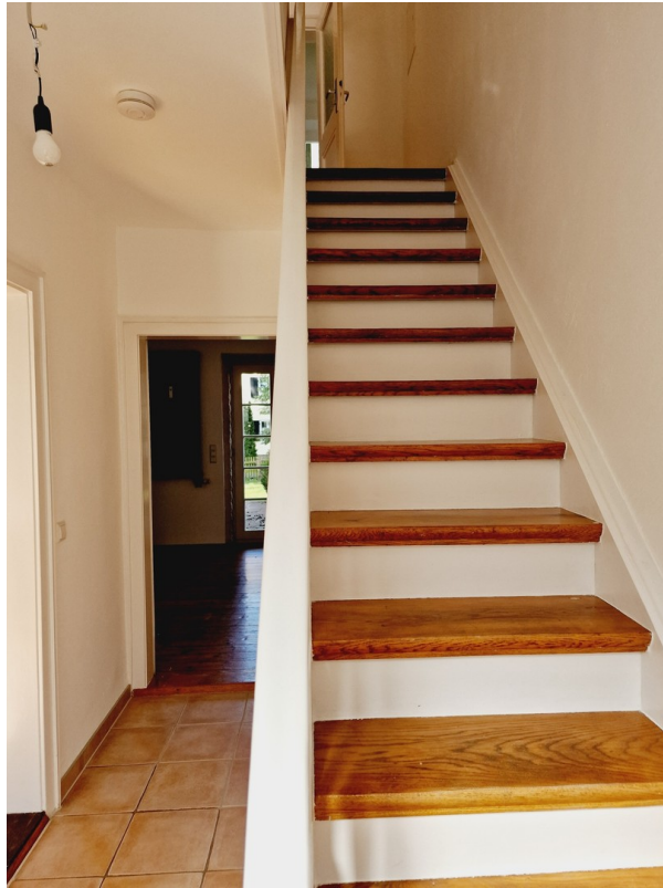
Flur im EG