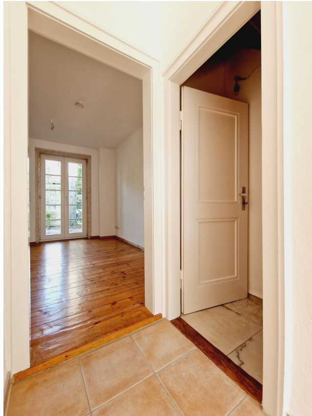
Flur zum KG