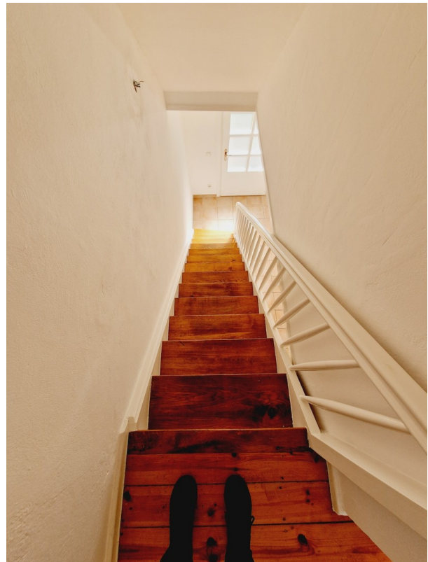
Treppe zum EG