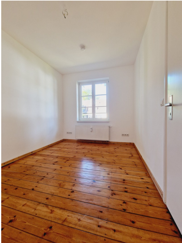
Erste Zimmer OG