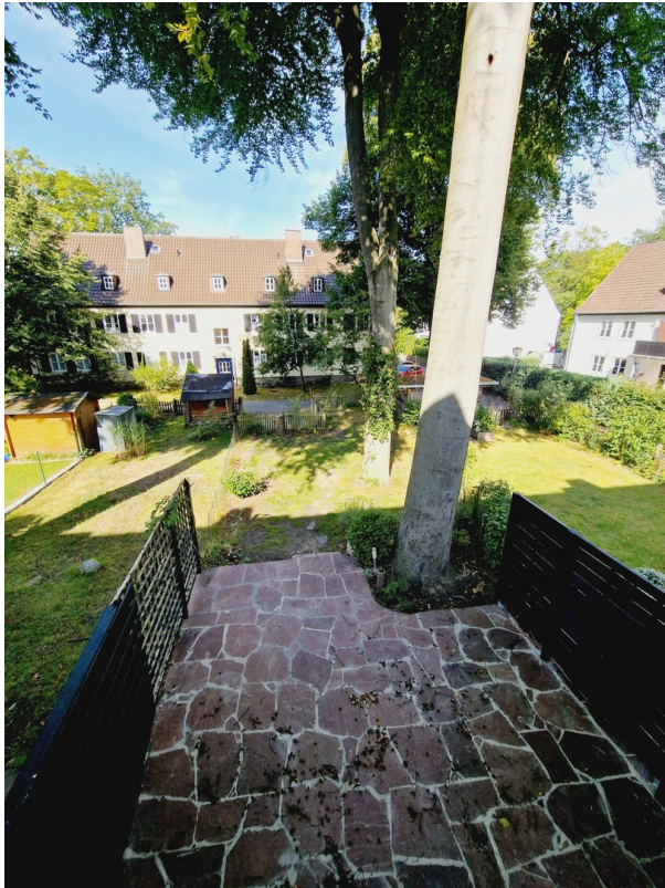
Blick auf die Terrasse OG