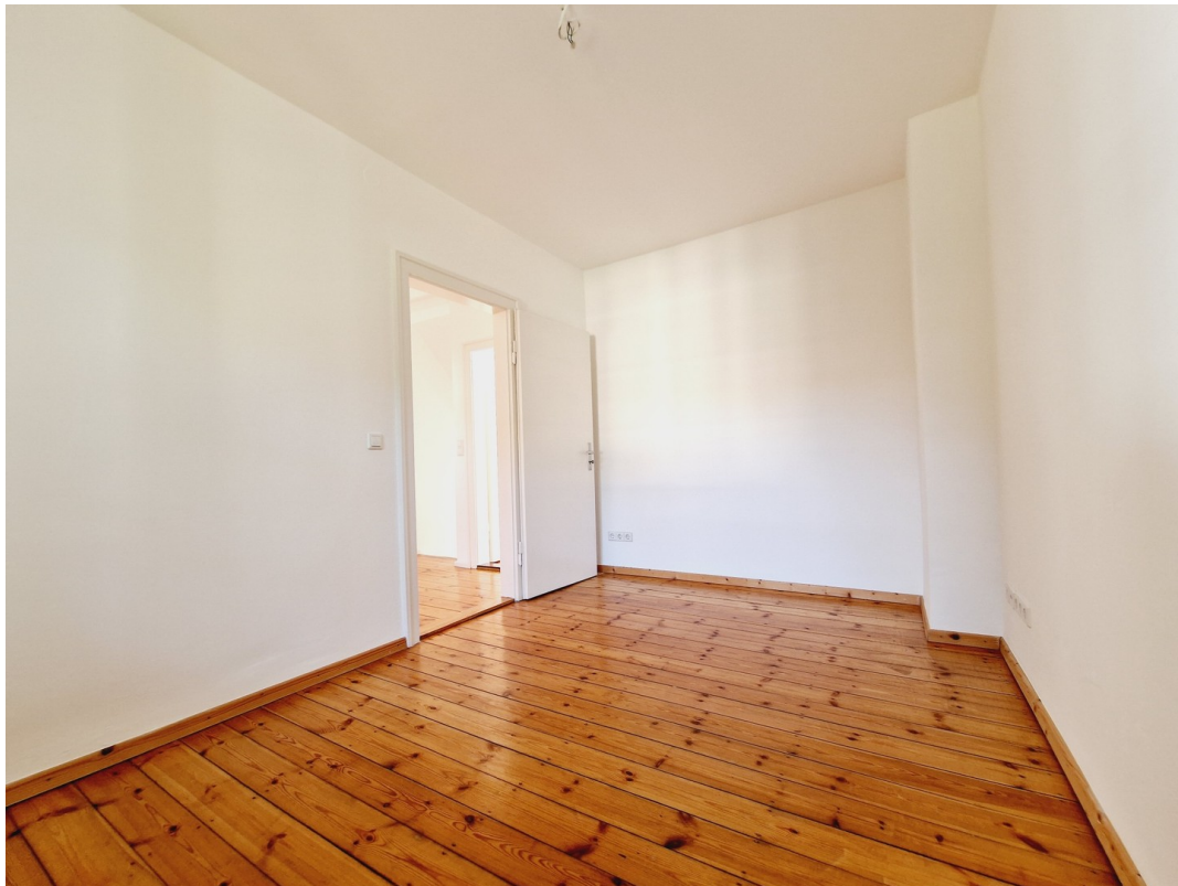
Erste Zimmer OG