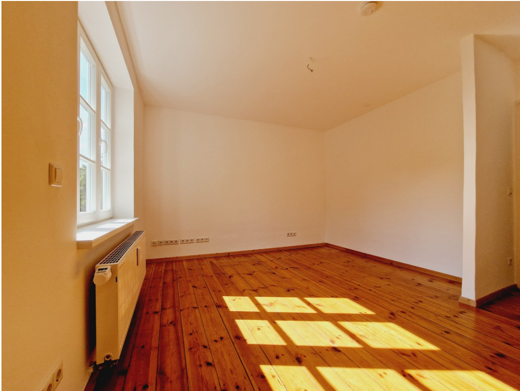
Zweites Zimmer OG