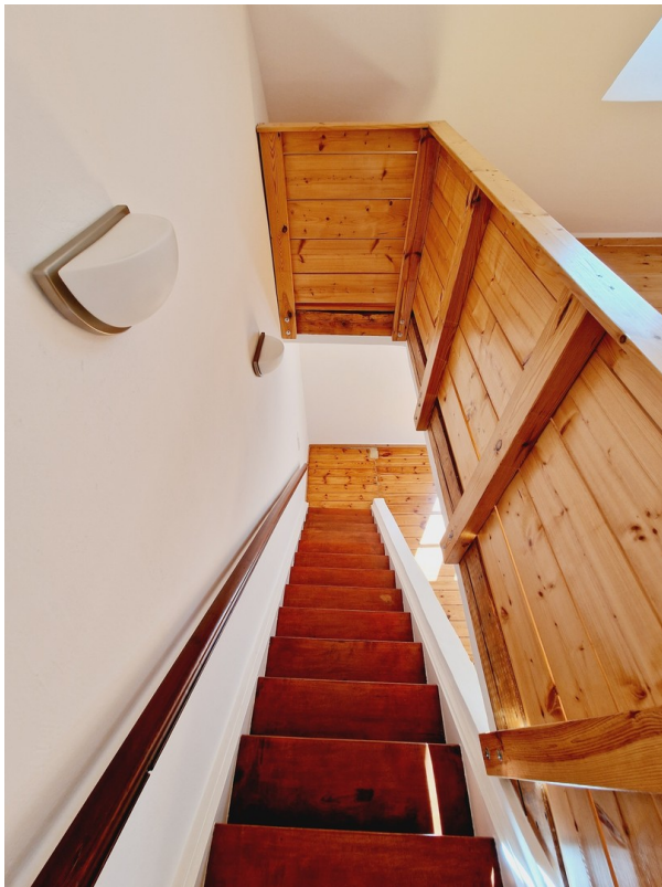
Treppe zum OG