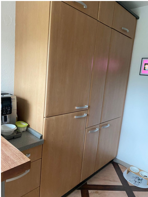
Viel Abstellfläche in Küche