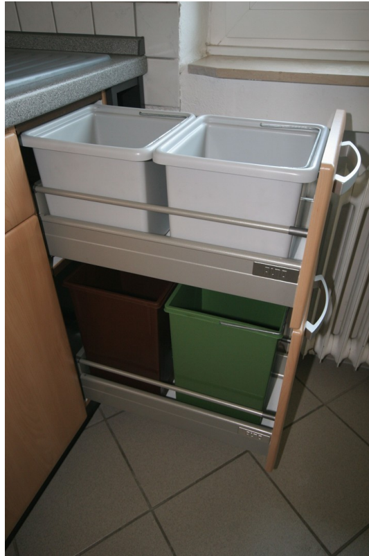
Küche mit Mülltrennungssystem