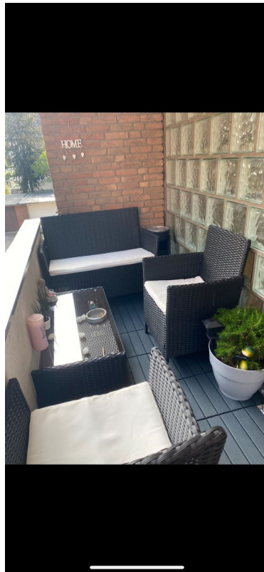
Gemütlicher privater Balkon