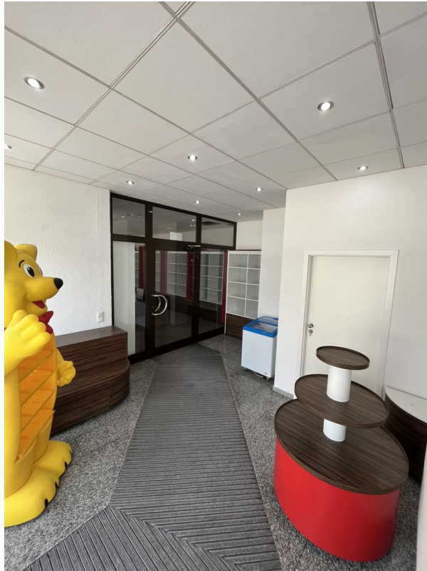
Vorraum / Windfang 1