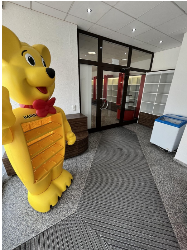
Vorraum / Windfang 2