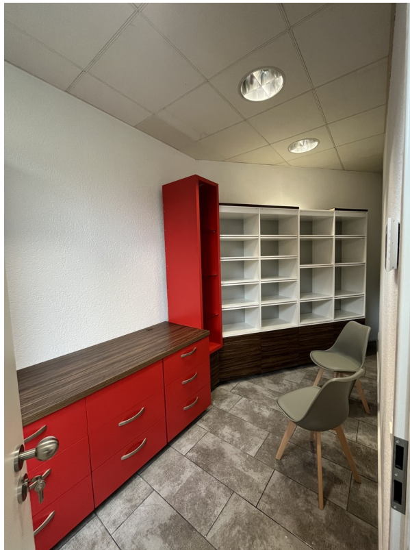
Büro / Pausenraum 2