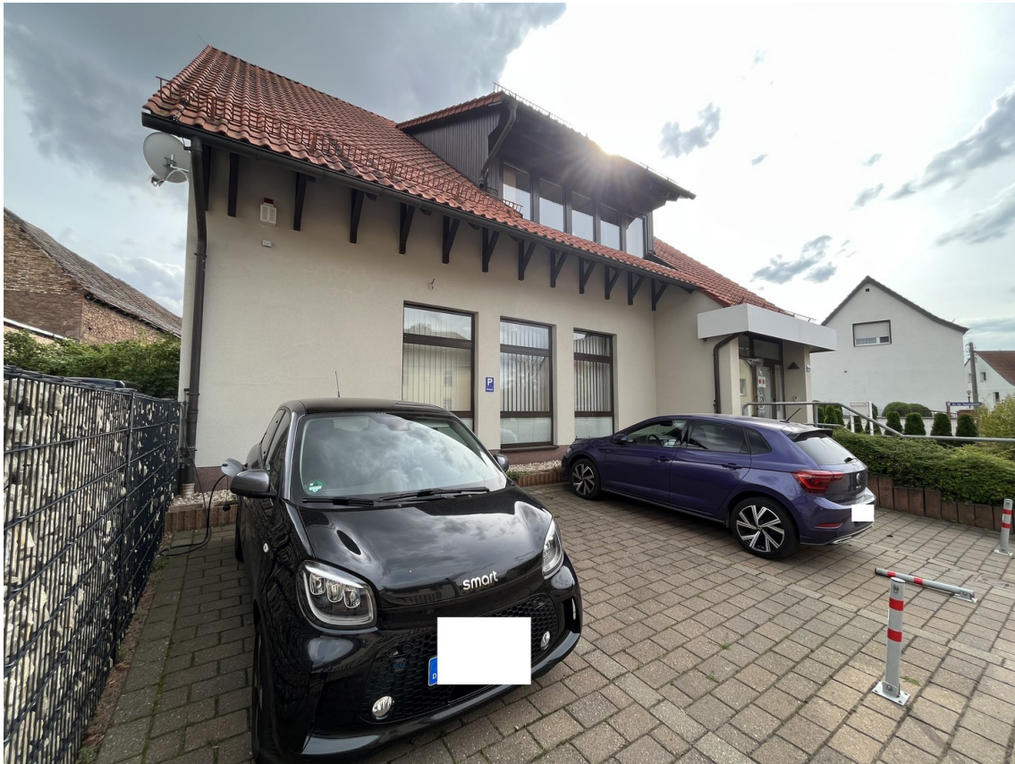
Ansicht Hauptstraße 2