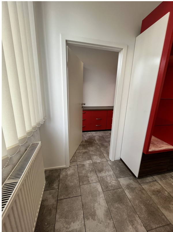
Zugang Büro / Pausenraum