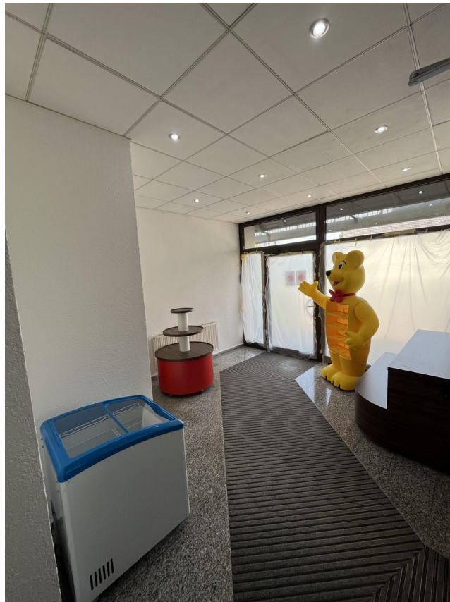
Vorraum / Windfang 3