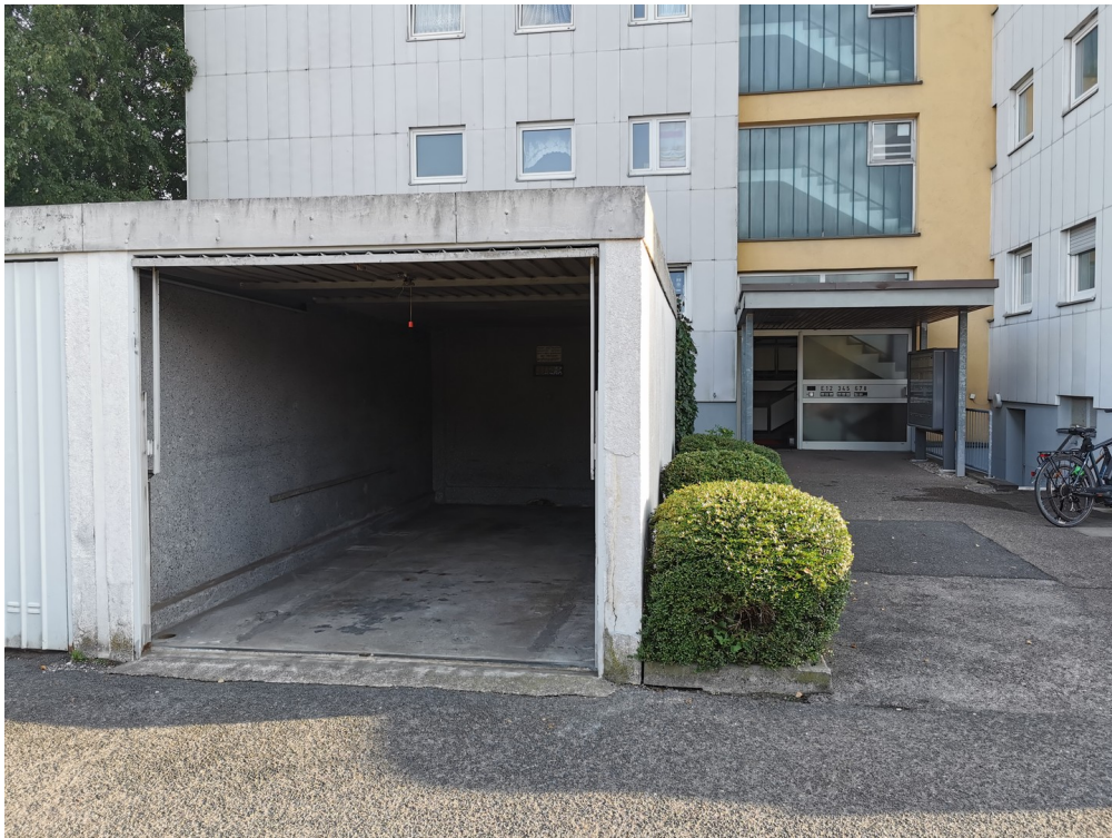
Ihre Einzelgarage am Eingang