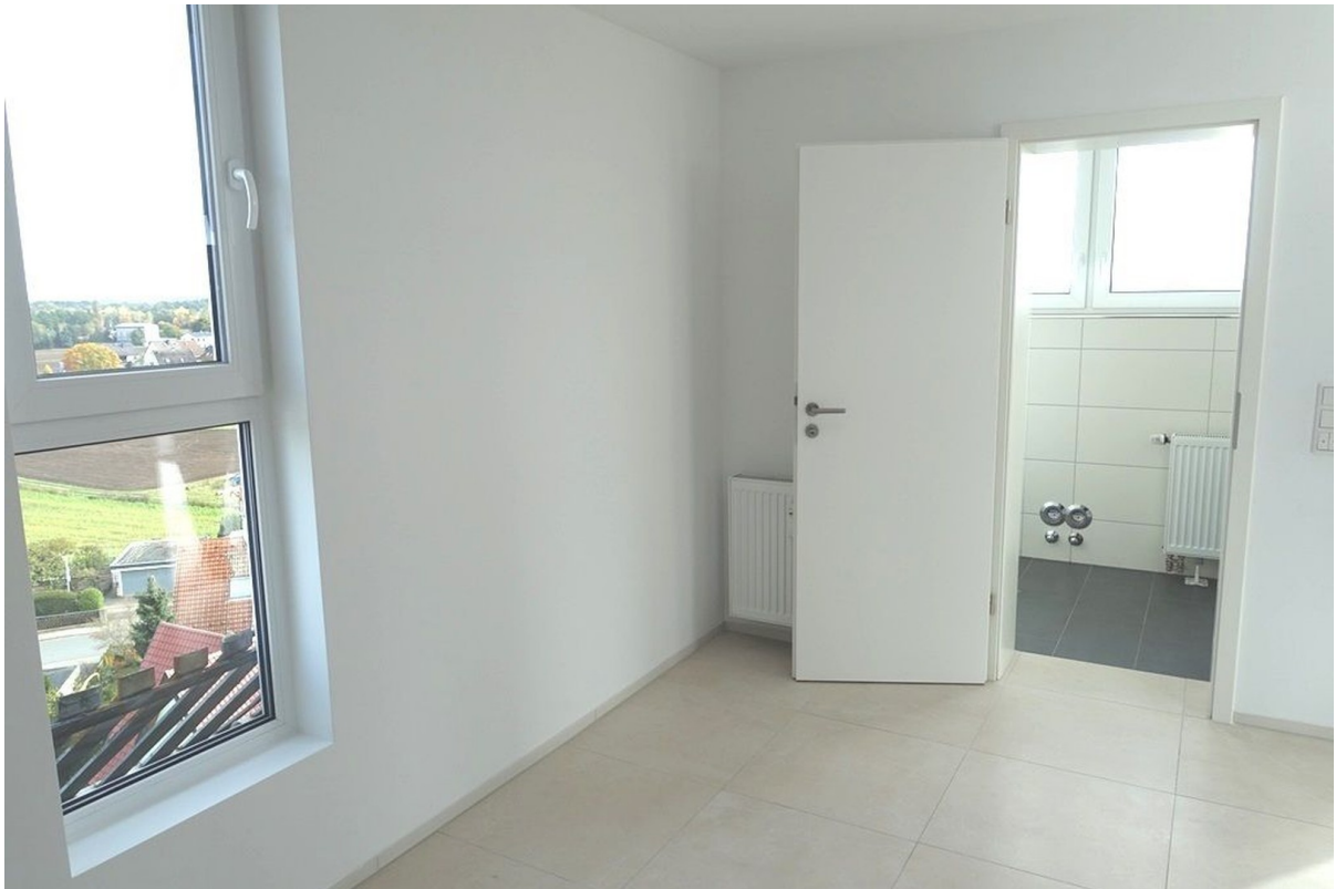
Vom Schlaf- ins Badezimmer