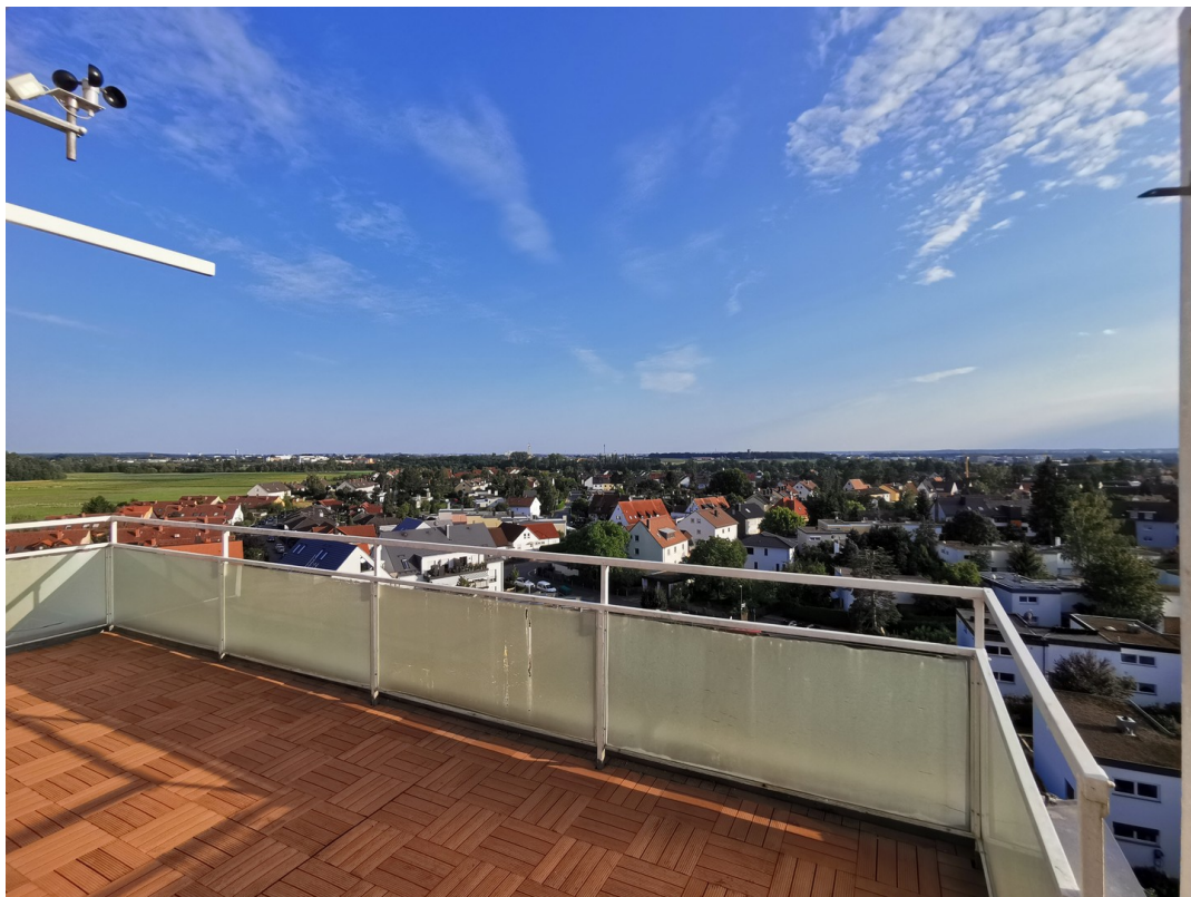
Blick Nürnberg - Fürth