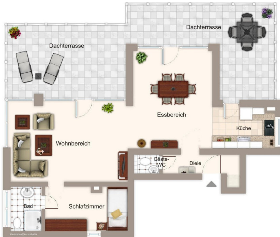
Grundriss mit Bsp.-Möblierung