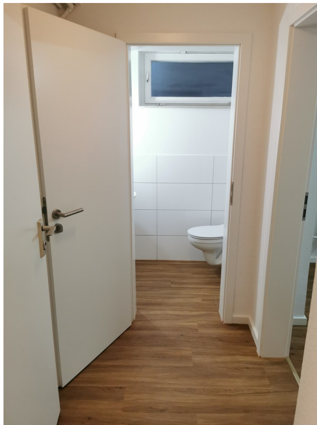
Flur u. Toilette im Souterrain