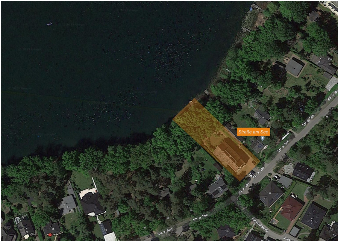
Grundstück von oben