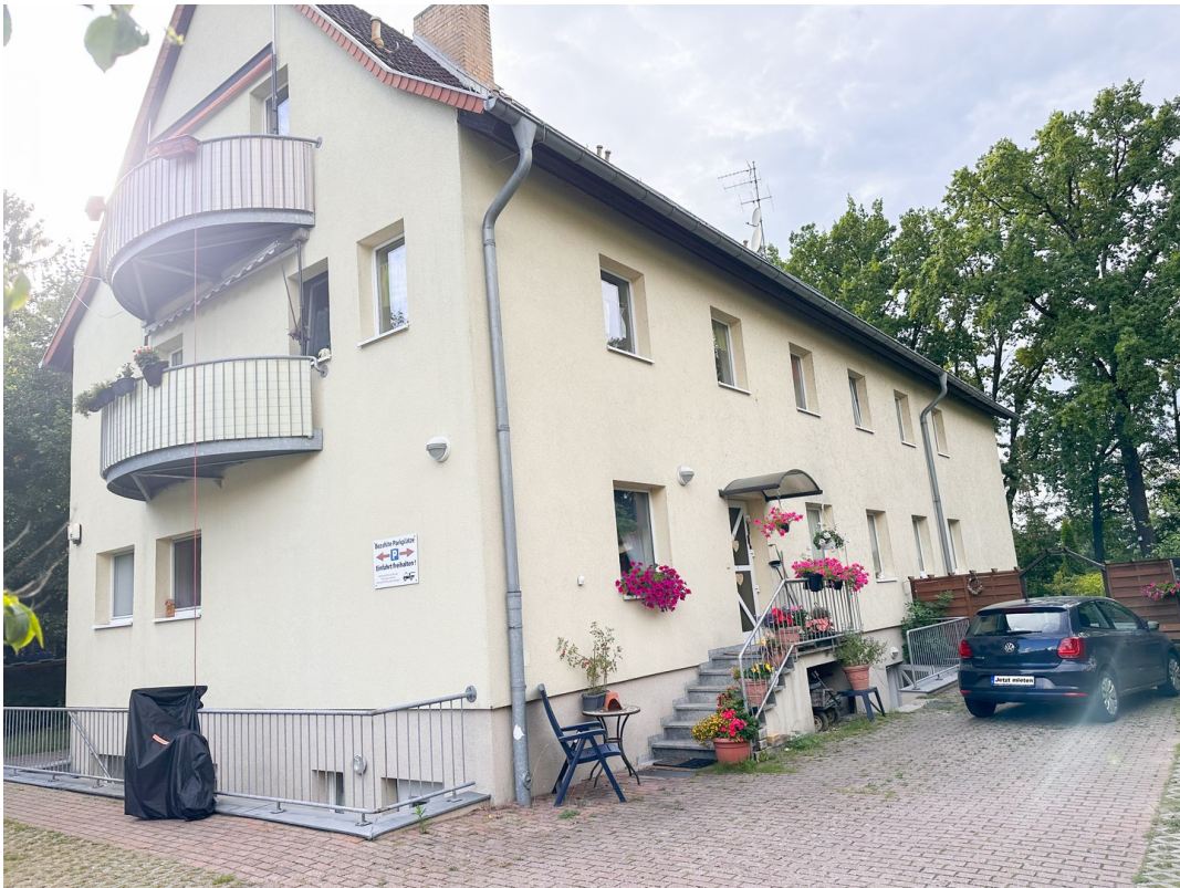
Straßenseite mit Parkplätzen