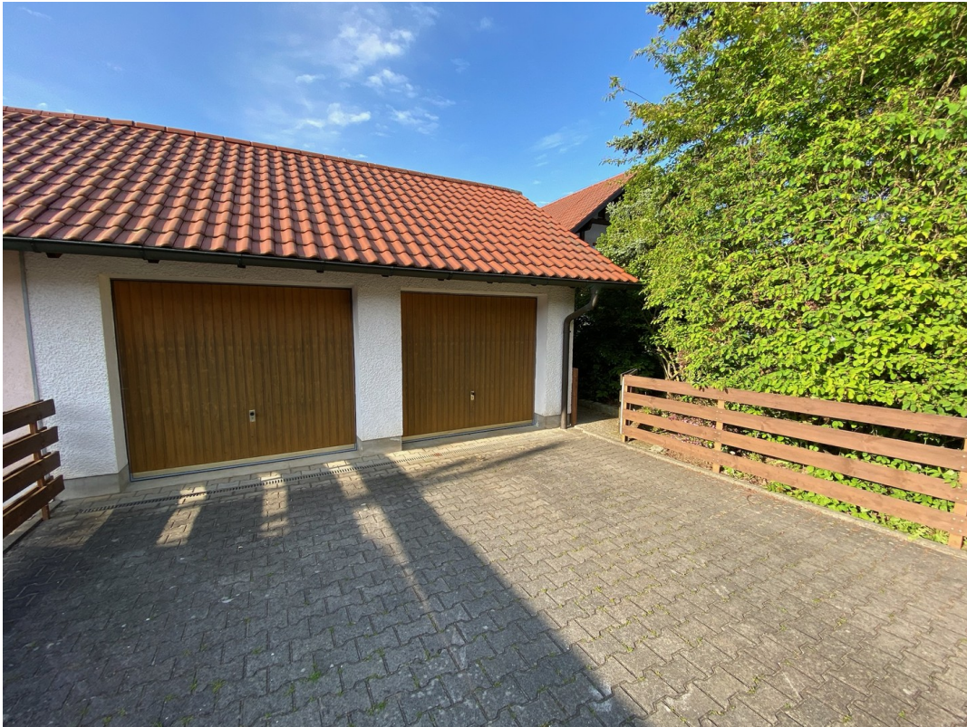
Garage mit Stellplatz (rechts)