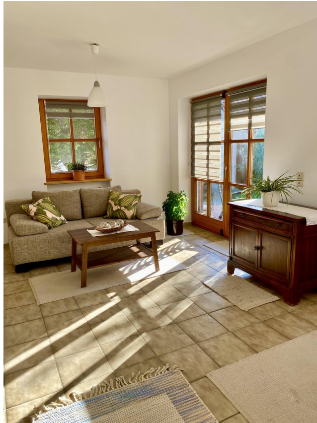
Zimmer 1 weitere Ansicht