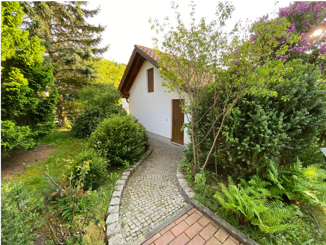
Weg zu Garage