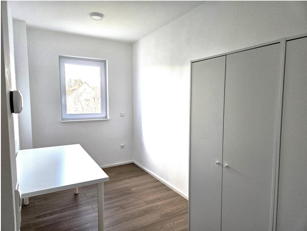
Arbeits- / Ankleidezimmer