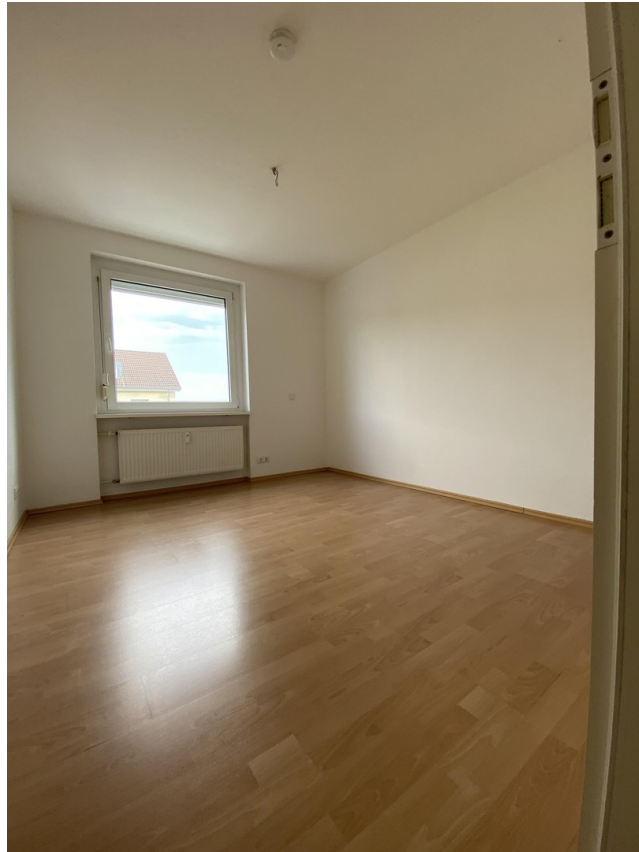
Kinder- oder Arbeitszimmer 2