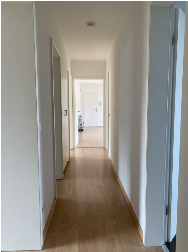
Flur mit Einbauschränk