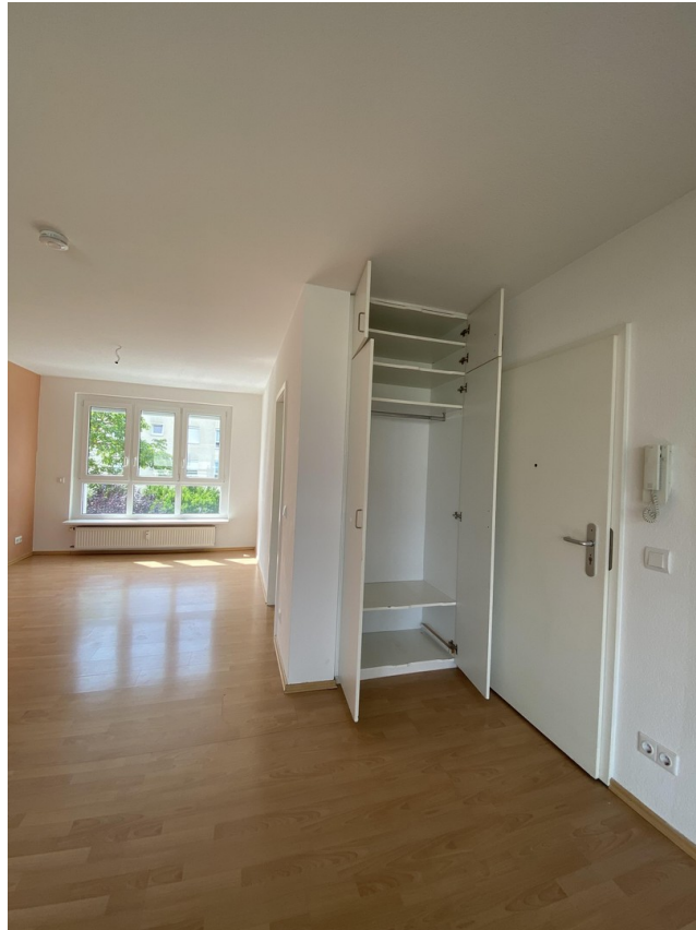
Eingang mit Einbauschränk