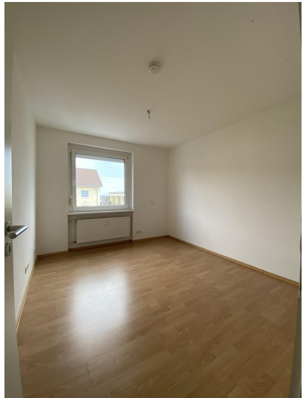
Kinder- oder Arbeitszimmer 1