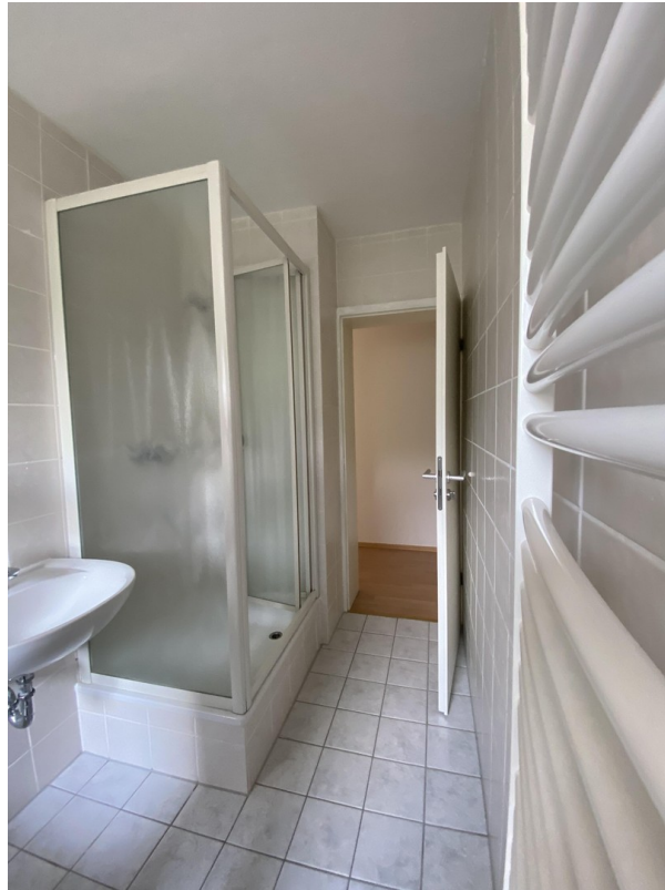
Bad mit Wanne und Duschkabine