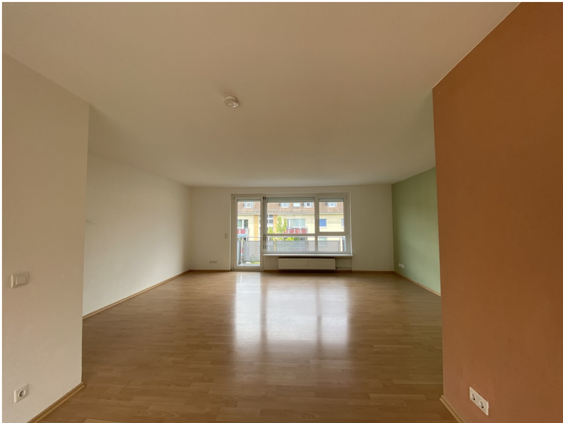
Helles Wohnzimmer mit Balkon