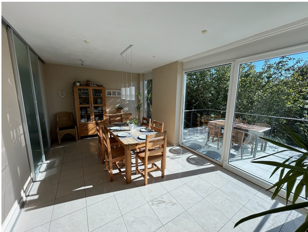
Esszimmer mit Terrasse