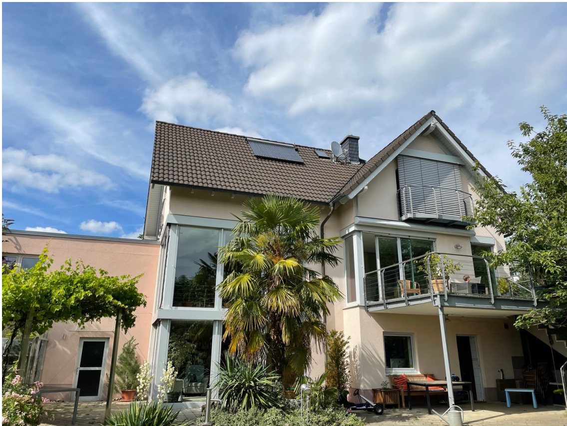
Ansicht vom Garten