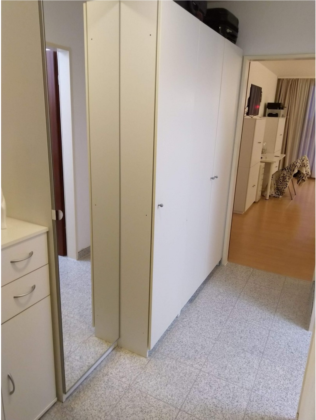
Flur mit Schränken