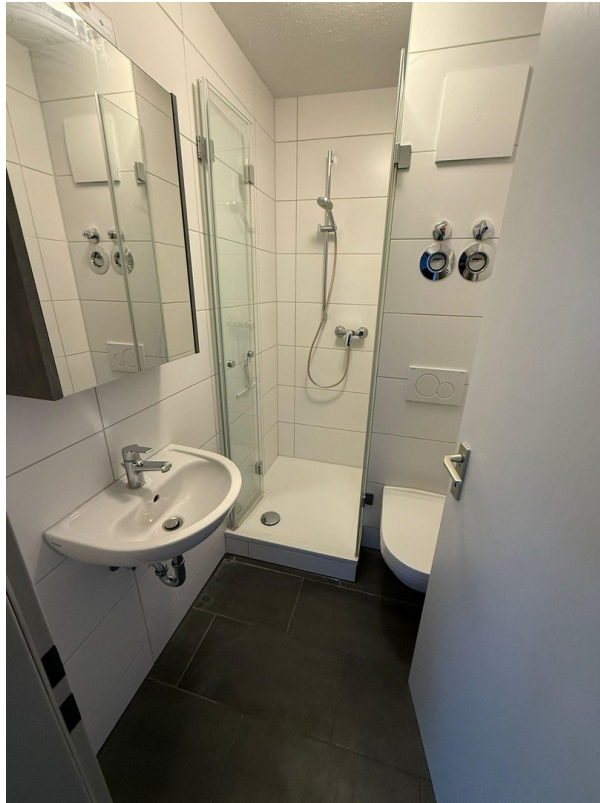
WC / Dusche