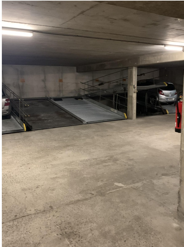
Ansicht Stellplatz (oben recht)