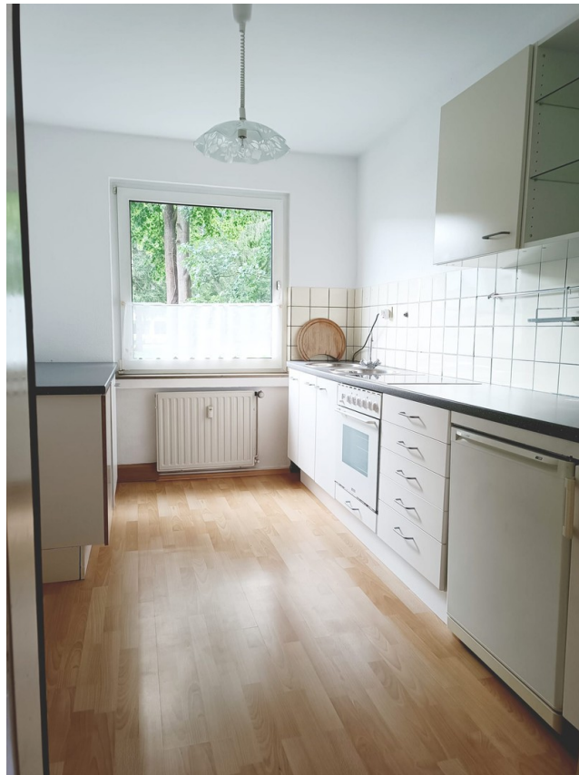
Einbau-Küche ist inklusive