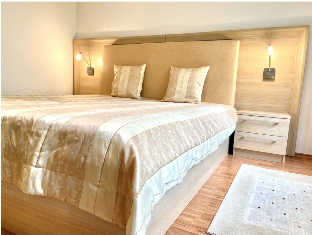
Schlafzimmer - Foto 1