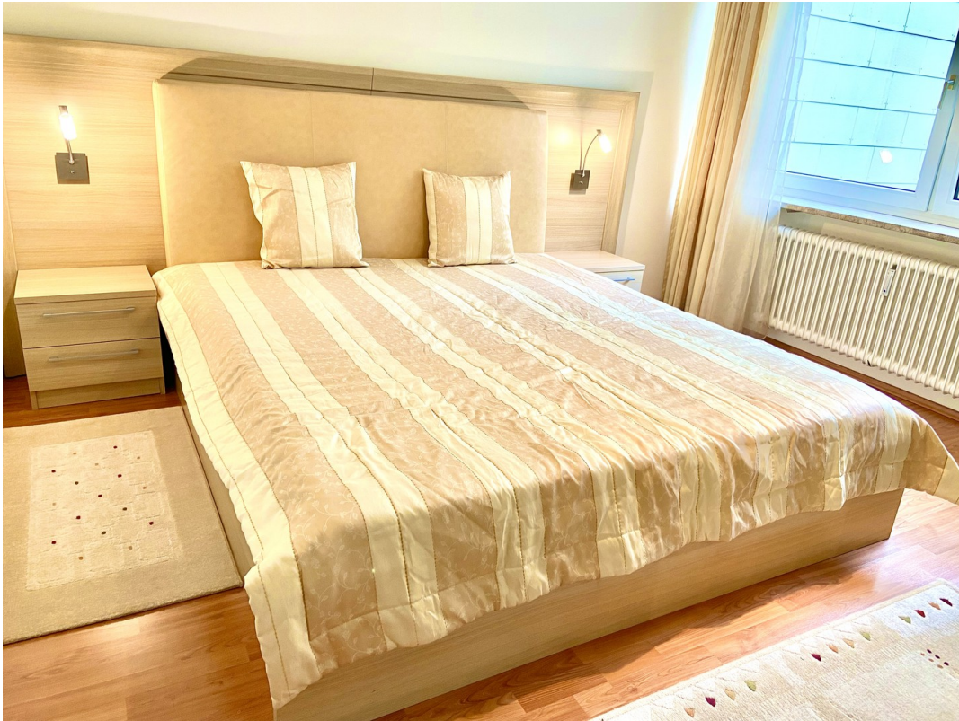
Schlafzimmer - Foto 1