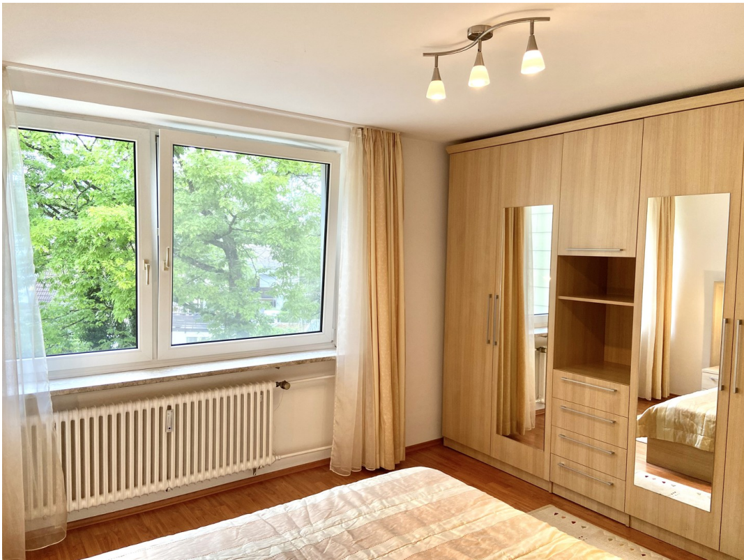
Schlafzimmer - Foto 1