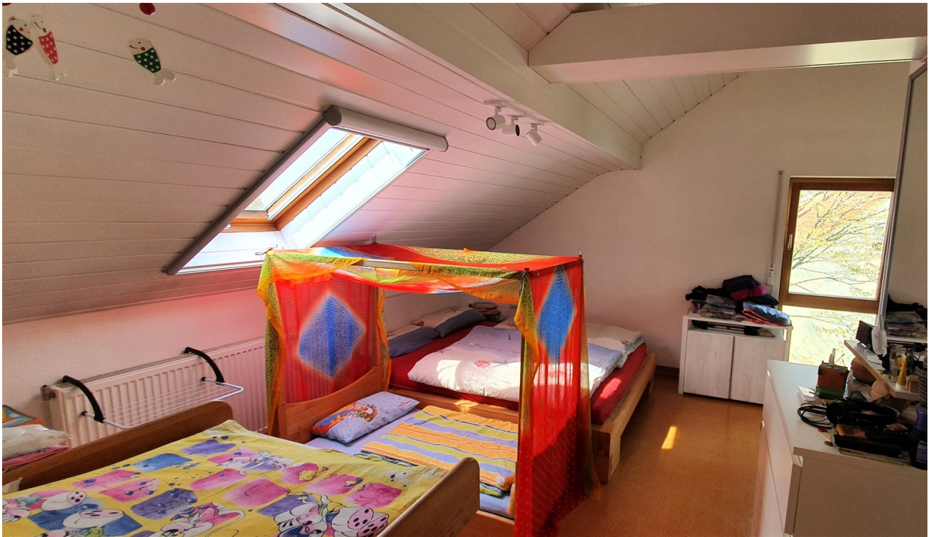
Schlaf- oder Kinderzimmer 1