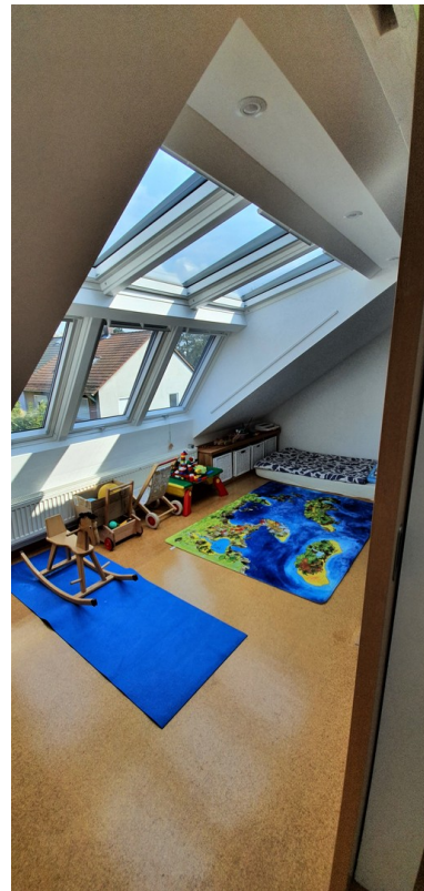
Schlaf- oder Kinderzimmer 3