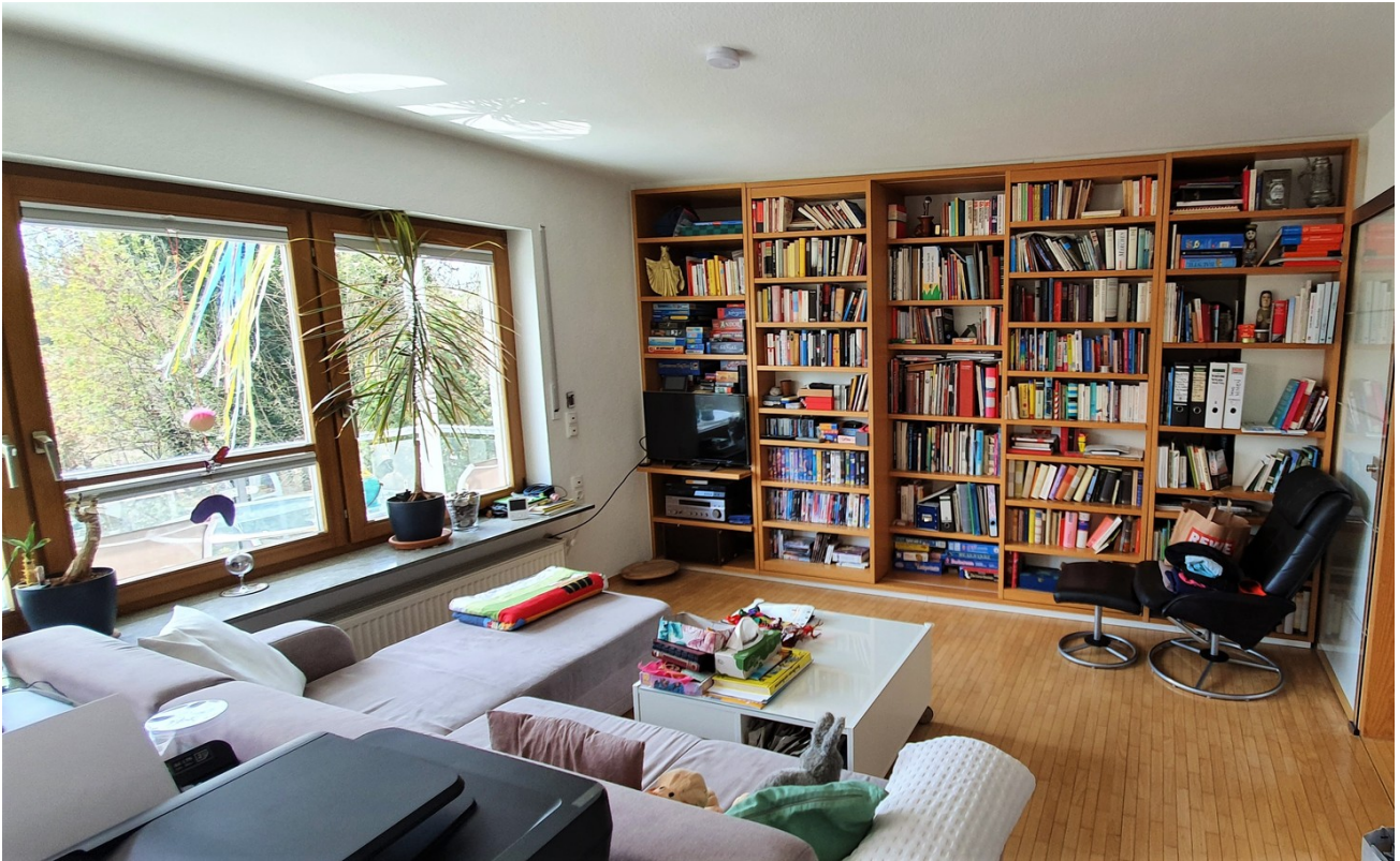
Wohn- und Arbeitszimmer