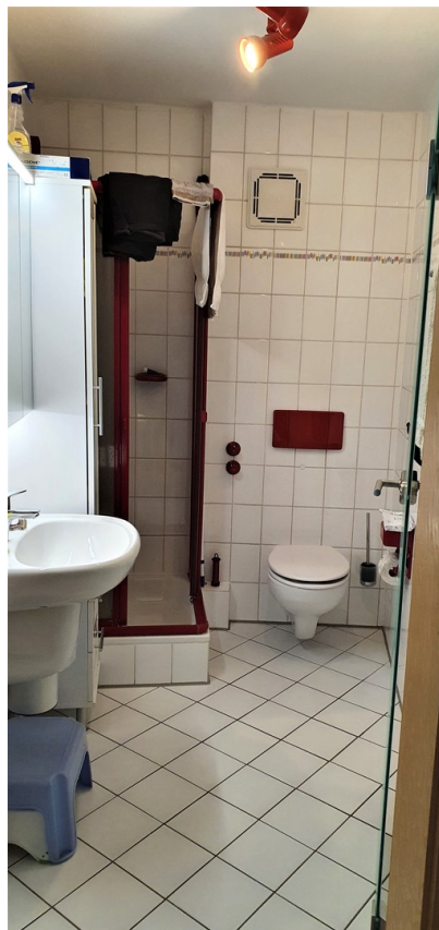
Kleines Bad im 1. OG