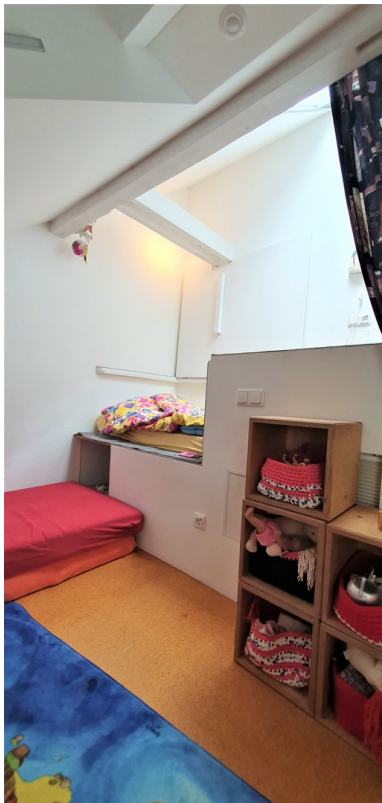
Schlafkoje und Spielen