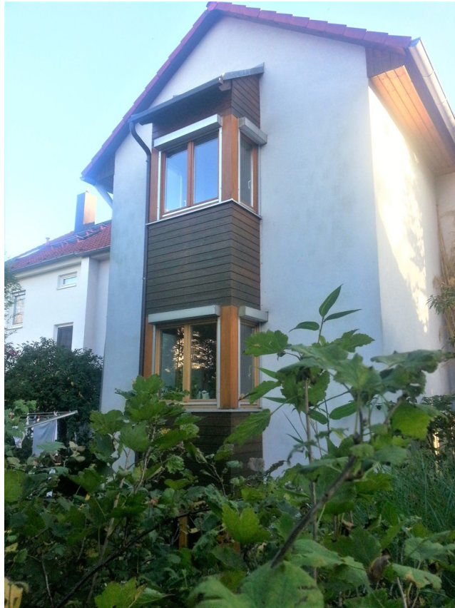
Blick von Garten 2