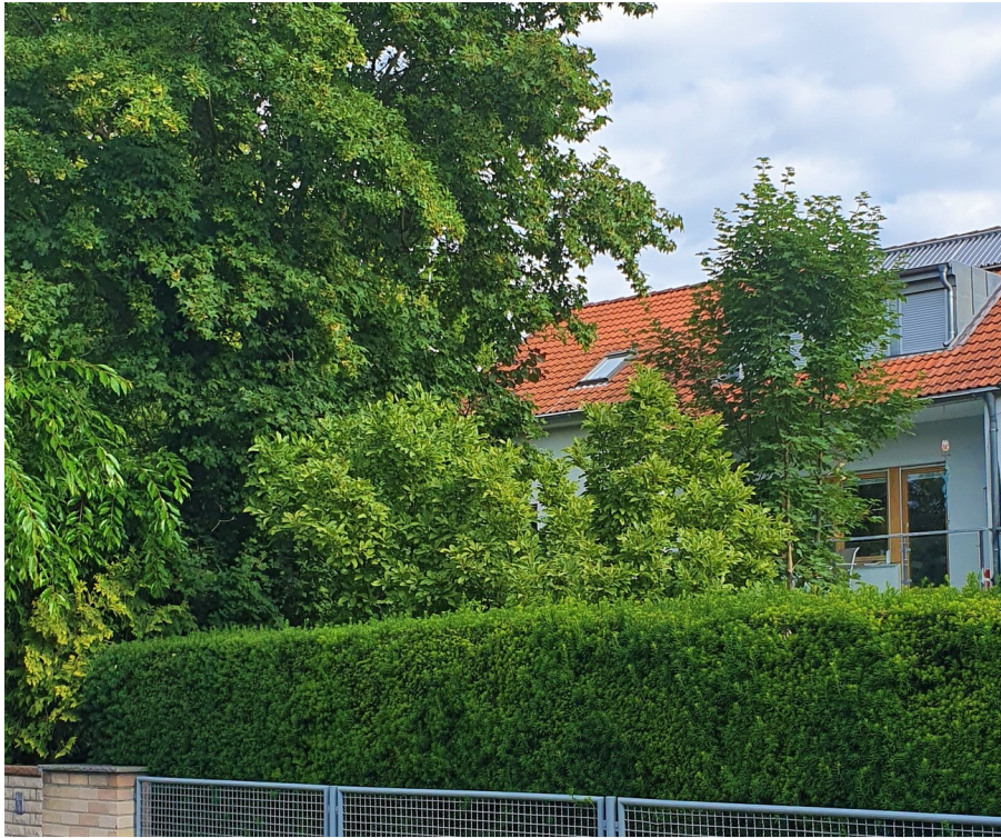
Wohnen im Grünen