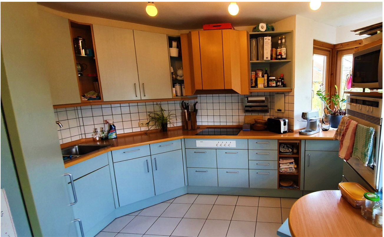
Einbauküche mit vielen Extras