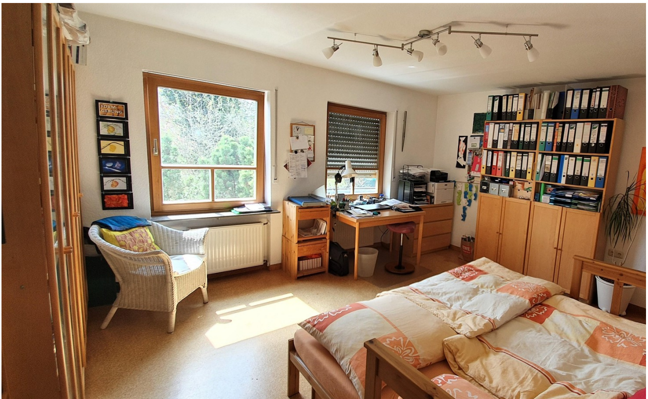
Arbeit-, Kinder- o. Gästezi.