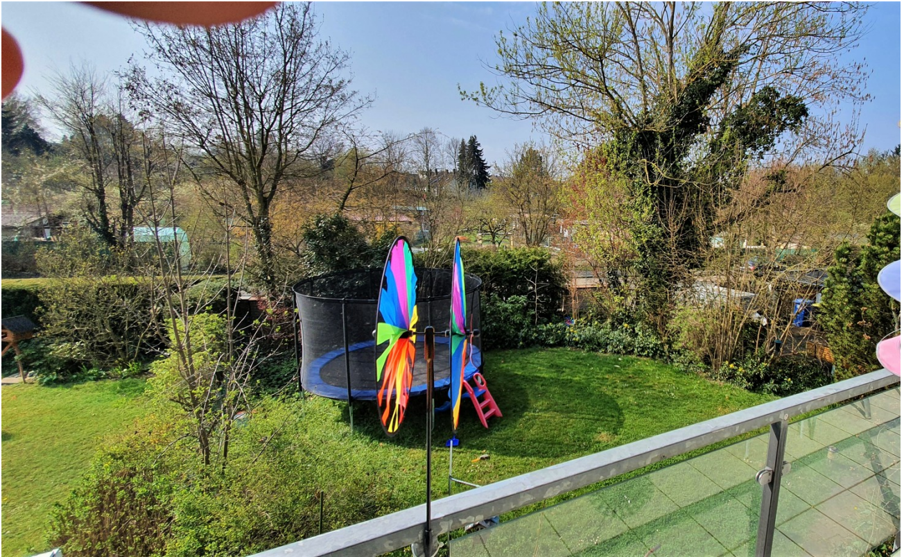
Blick vom Balkon im Winter