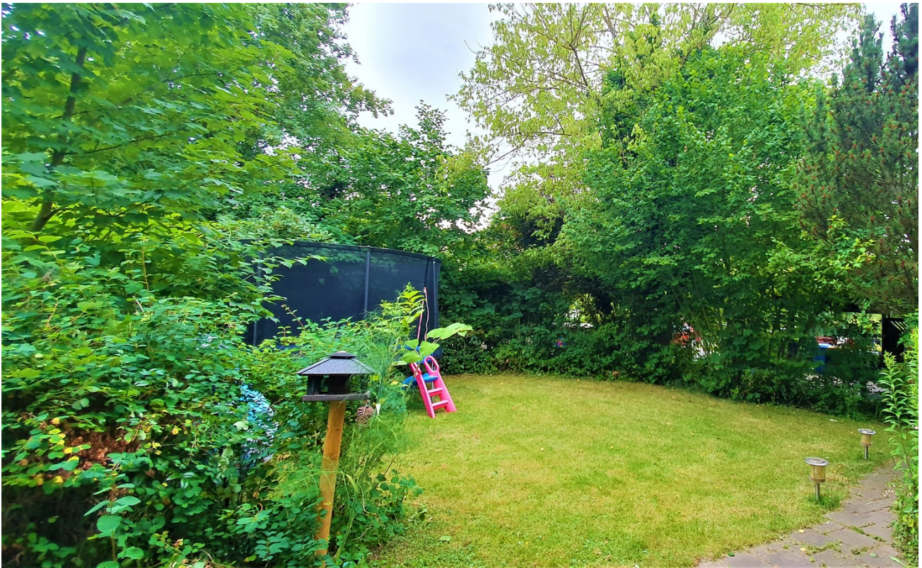
Garten 1 Südseite