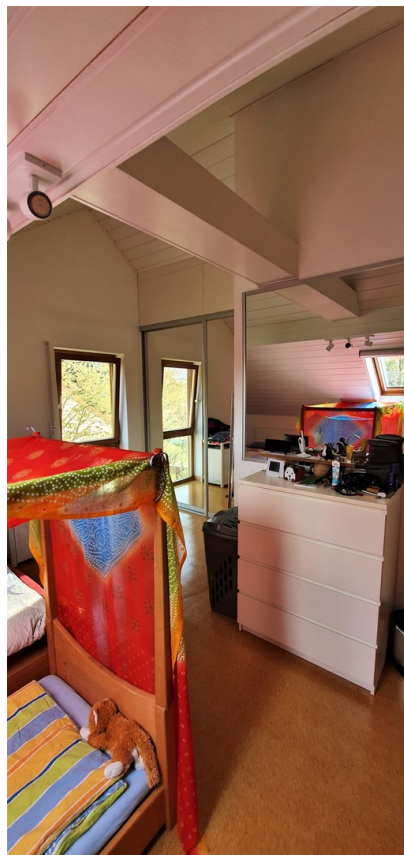
Schlaf- oder Kinderzimmer 1