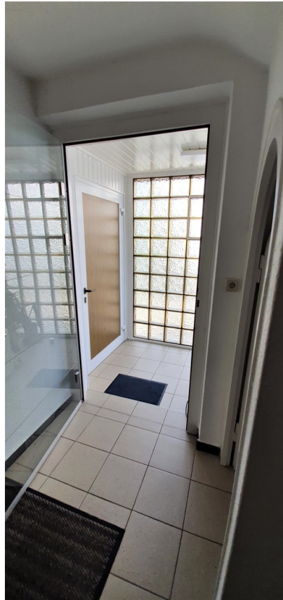
Eingang Haus mit Windfang