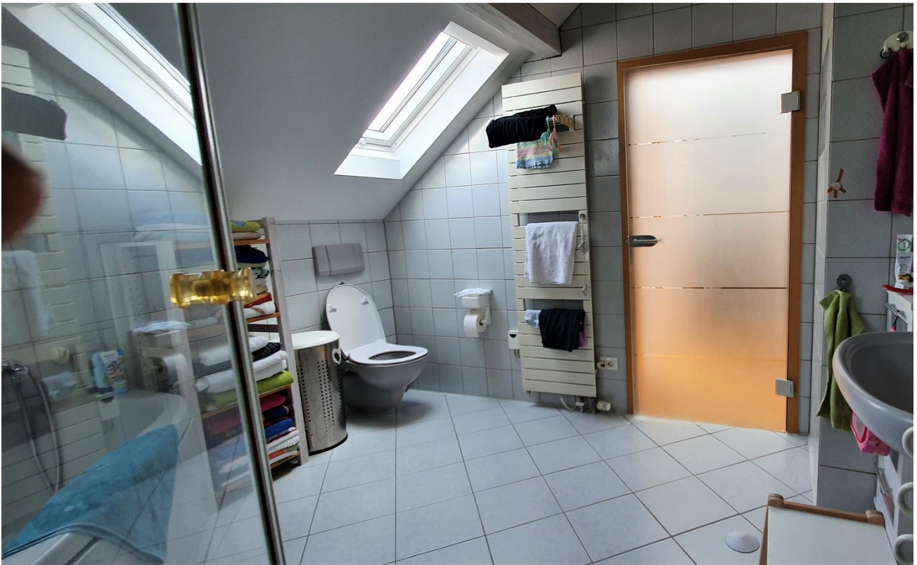
Großes Bad in 2. Ebene