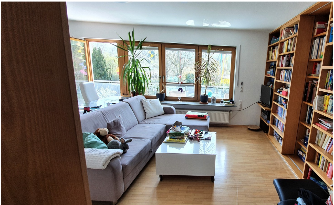
Wohn- und Arbeitszimmer