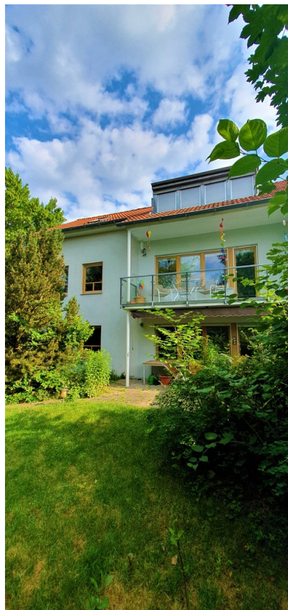
Haus umgeben von Grün