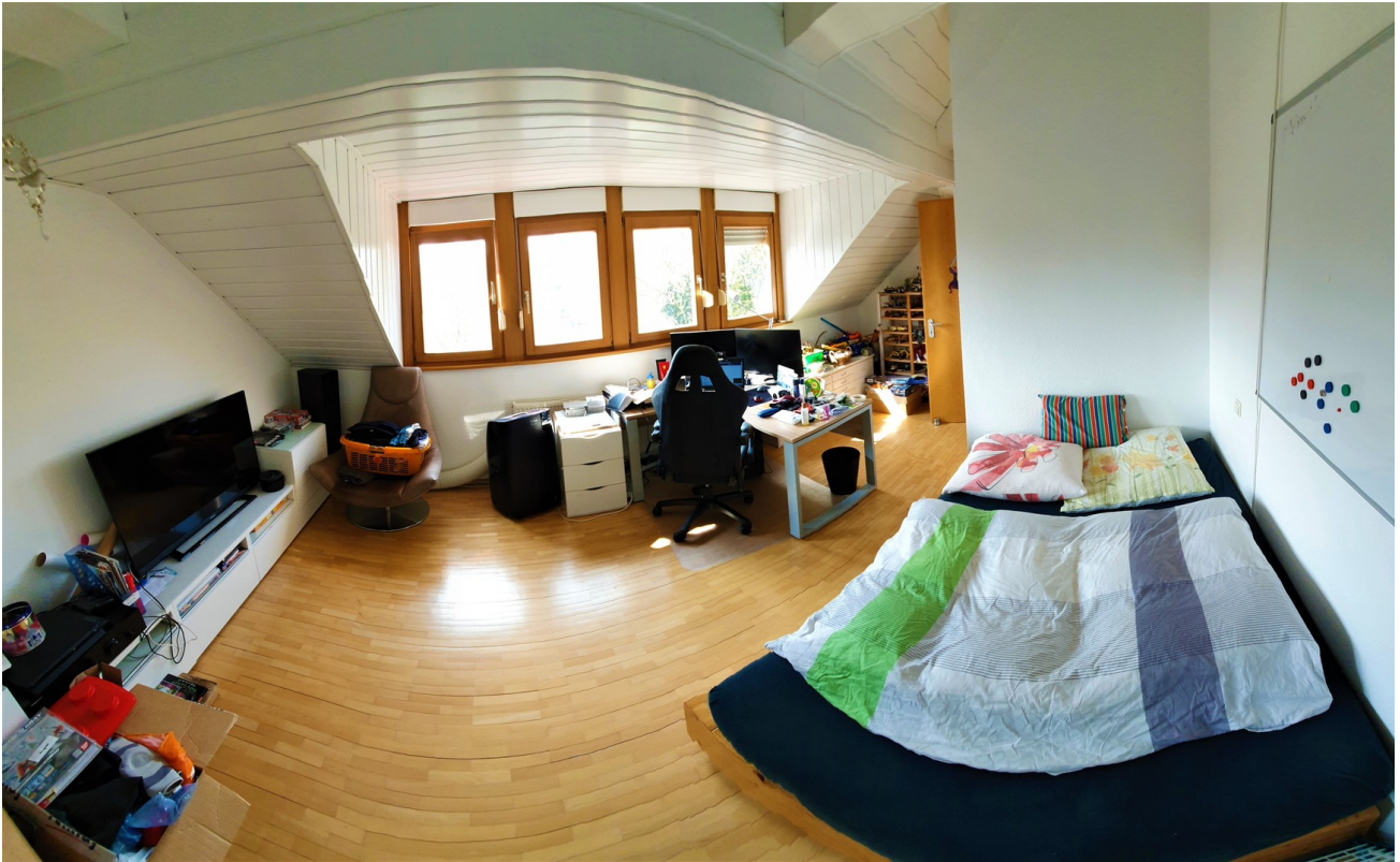
Schlaf- oder Kinderzimmer 2