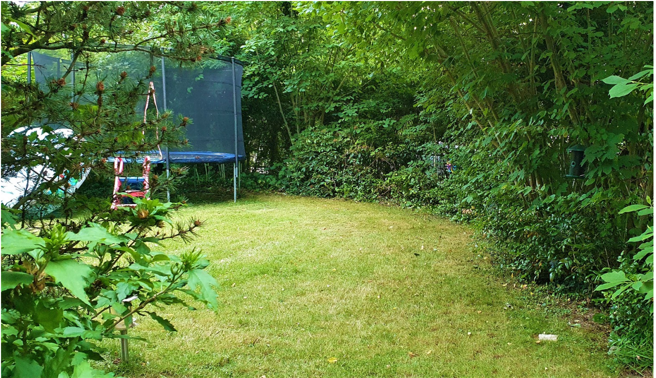
Garten 1 Südseite