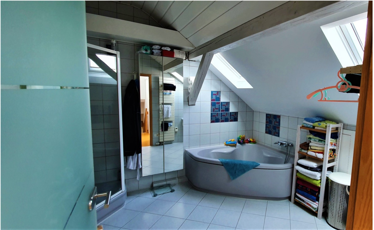
Großes Bad mit Eckbadewanne