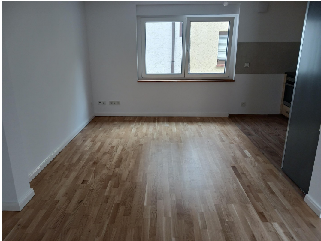
Wohnen & Essen