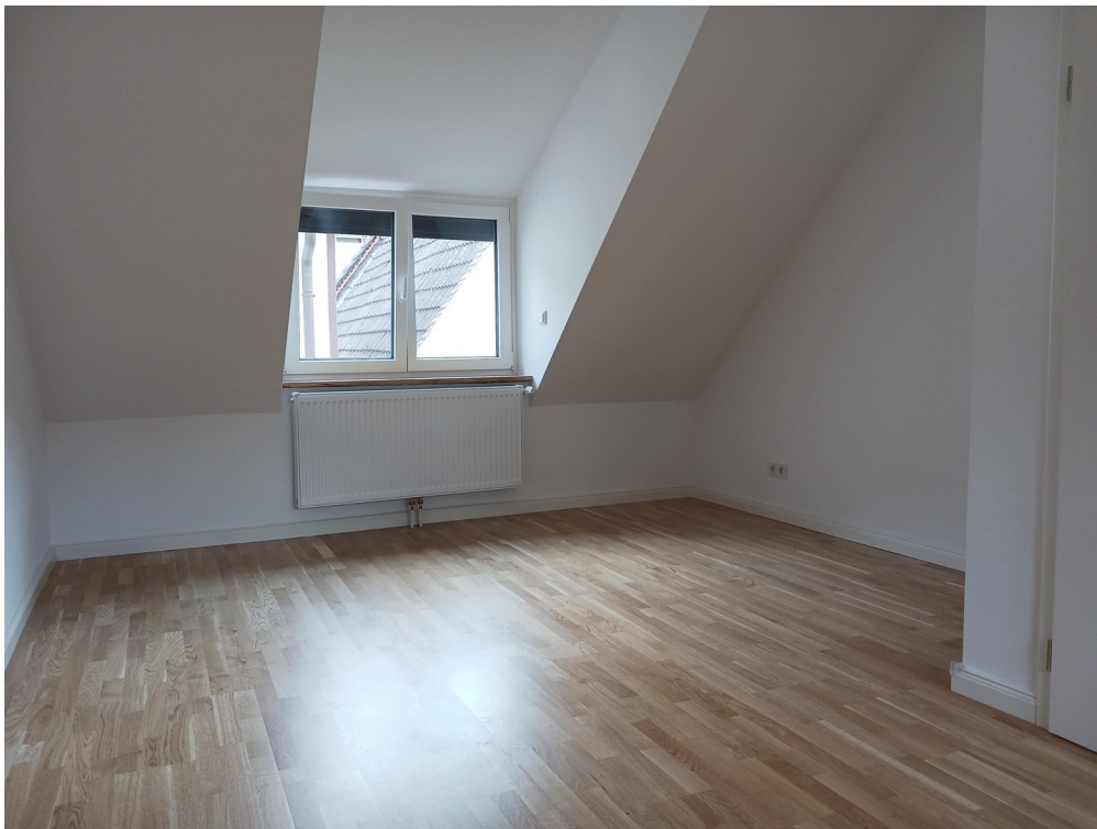
Großes Zimmer Dachgeschoss