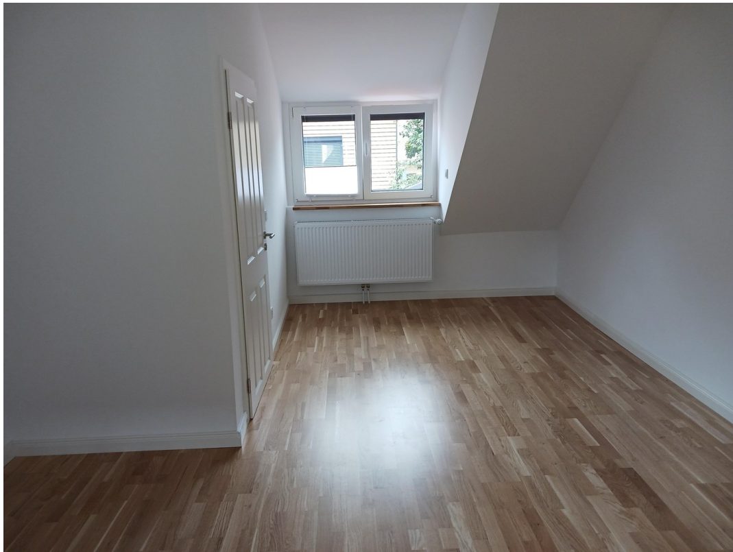
Großes Zimmer Dachgeschoss