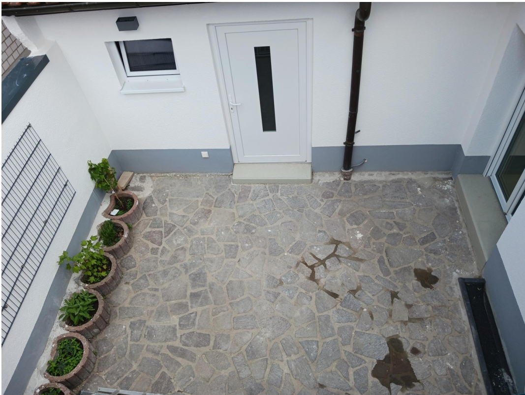
Terrasse im Erdgeschoss