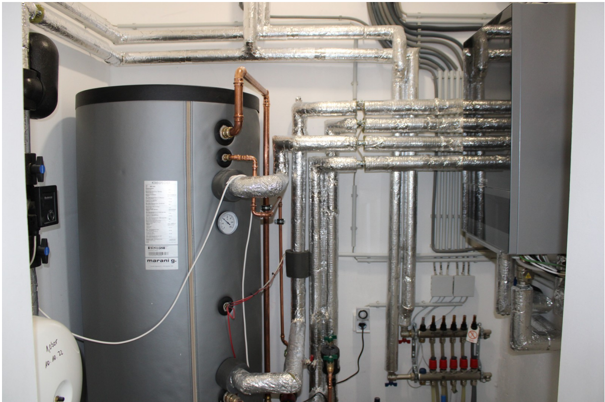
Haustechnik Heizung etc.