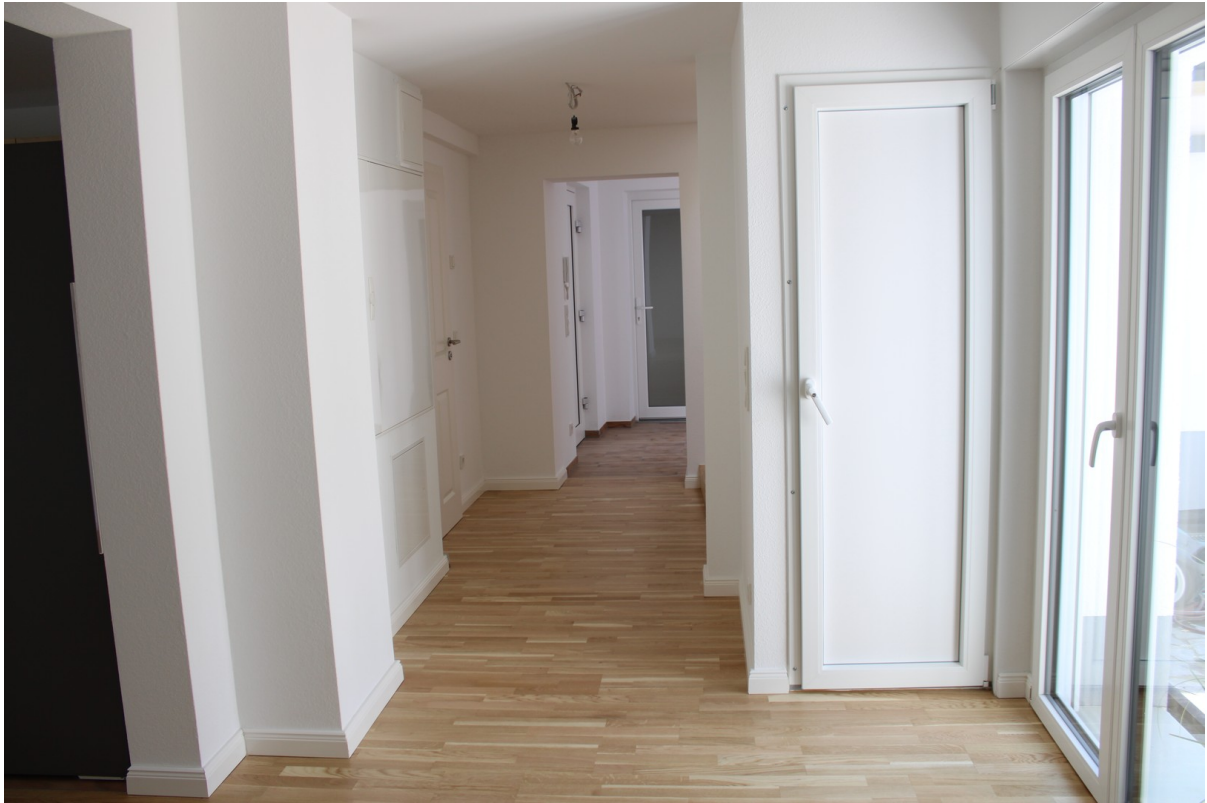
Flur zum Bad und Eingang