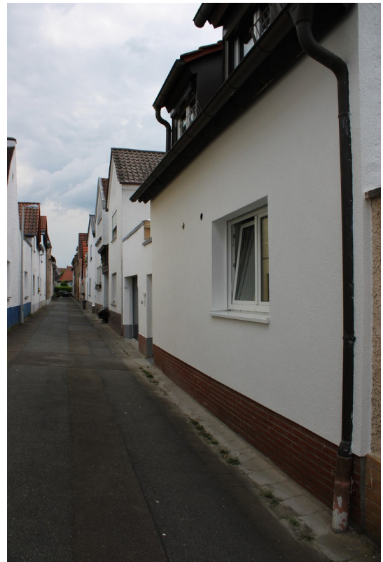
Straße / Gasse