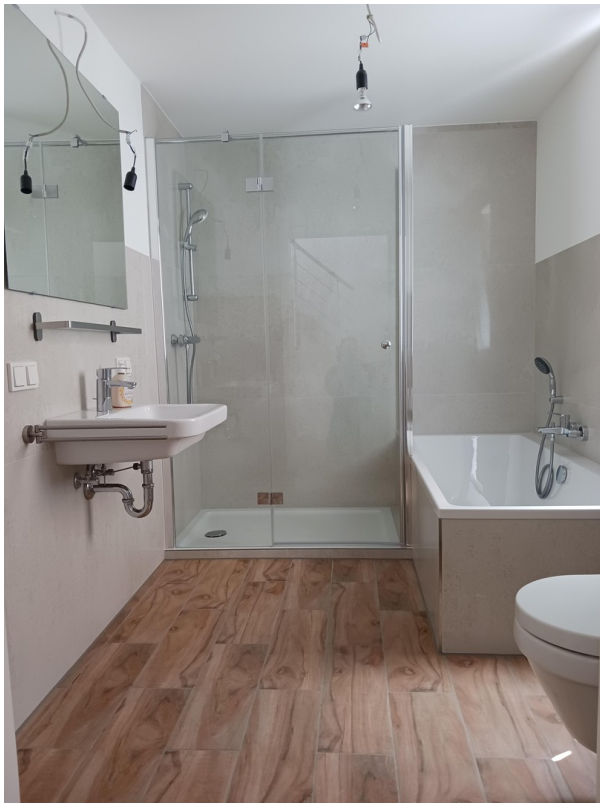
Großes Badezimmer Erdgeschoss