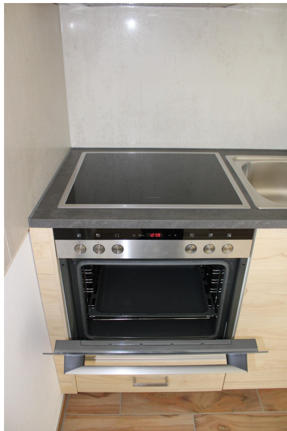
Herd und Backofen