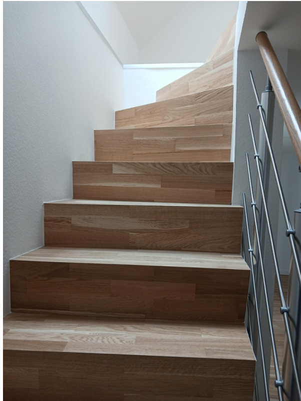
Treppe ins Dachgeschoss