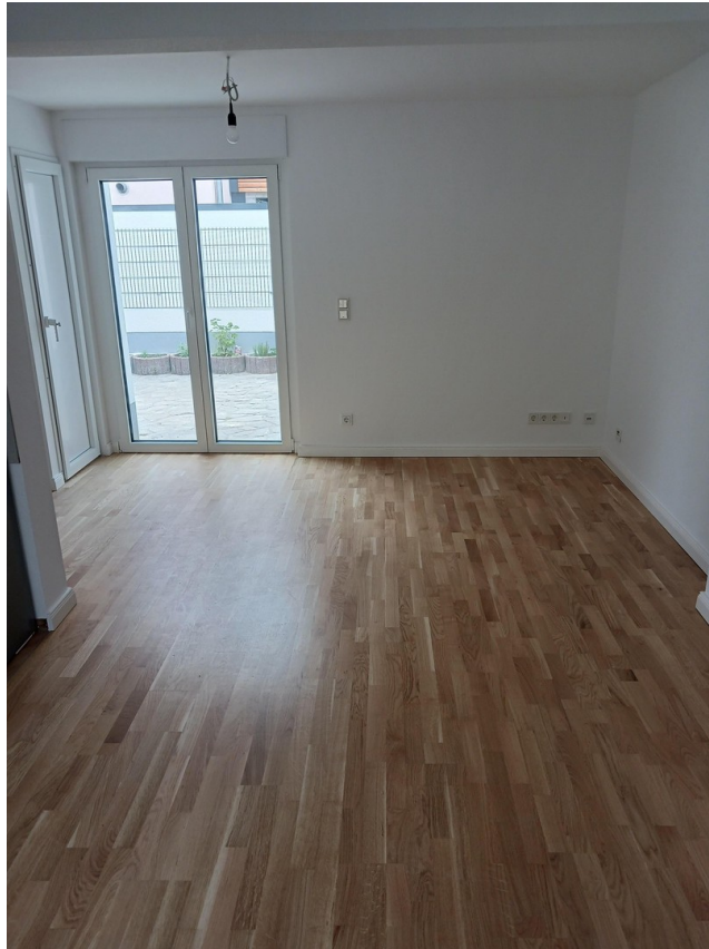
Wohnen & Essen