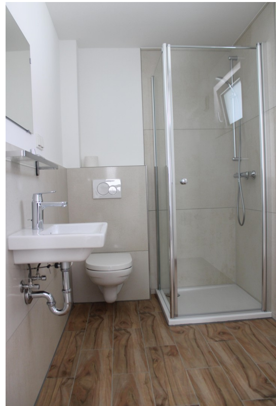
Kleines Badezimmer Erdgeschoss