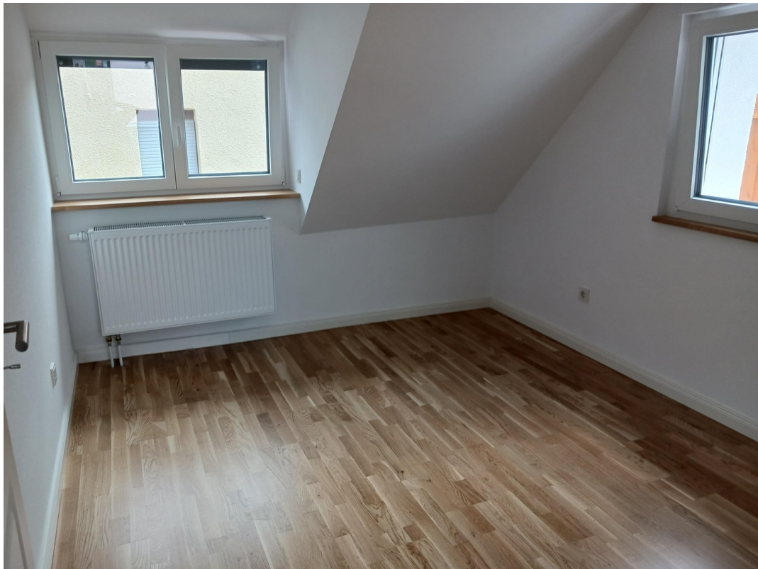
Kleines Zimmer Dachgeschoss