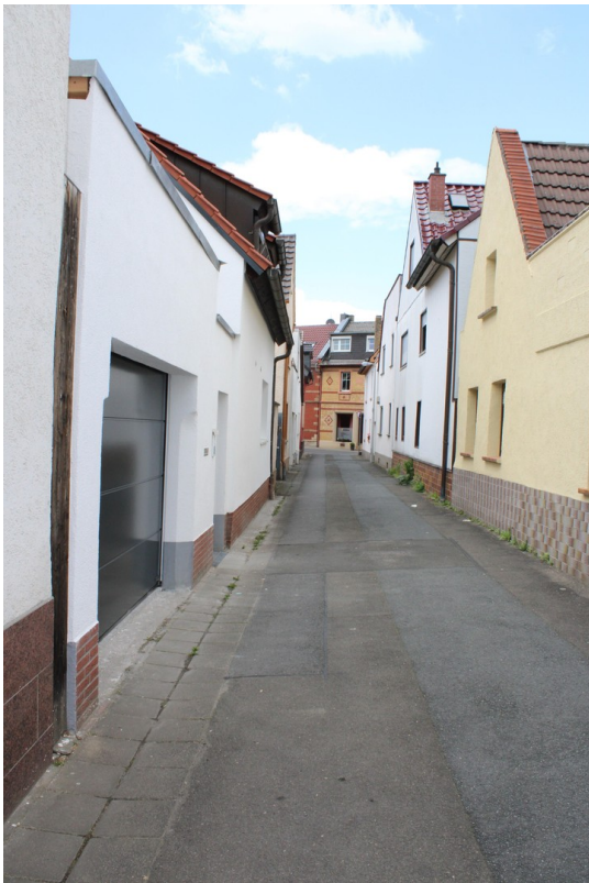
Straße / Gasse