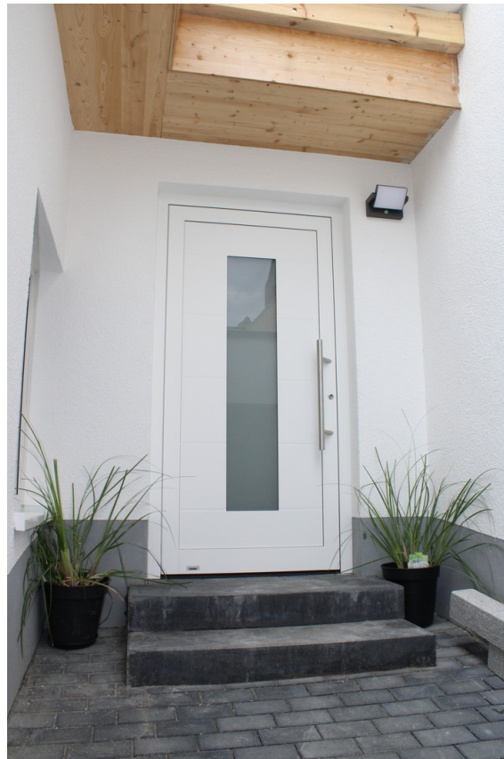
Eingangshof mit Haustür