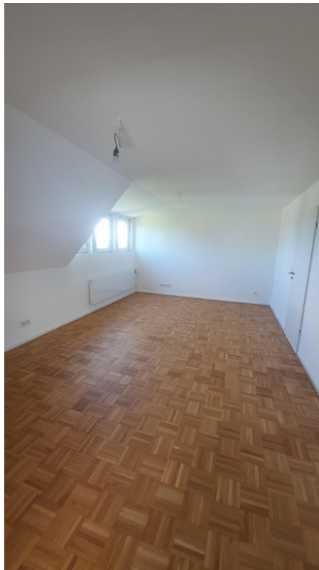
Schlafzimmer Eltern 1.St.