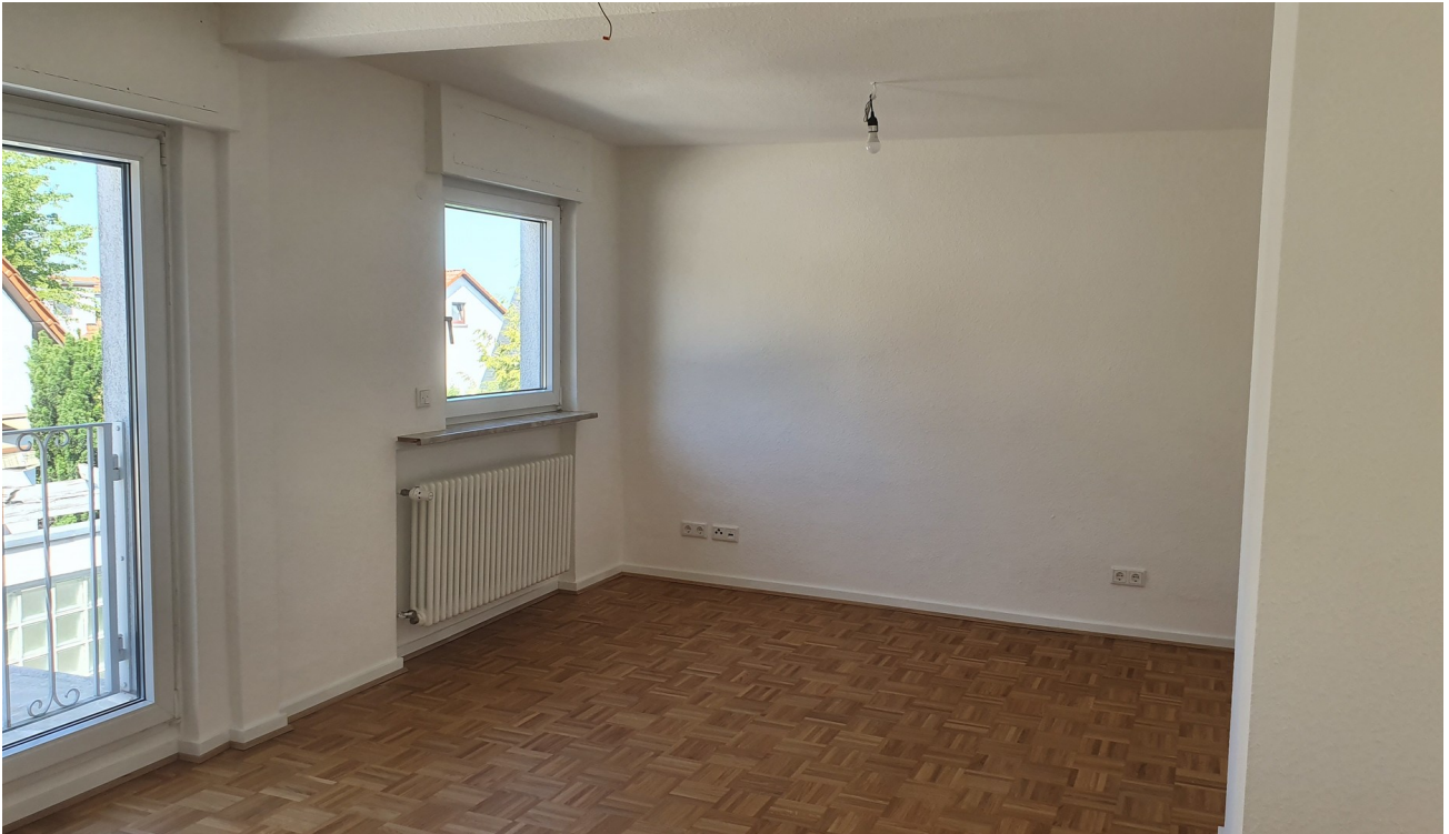
Schlafzimmer Kind 1. St.