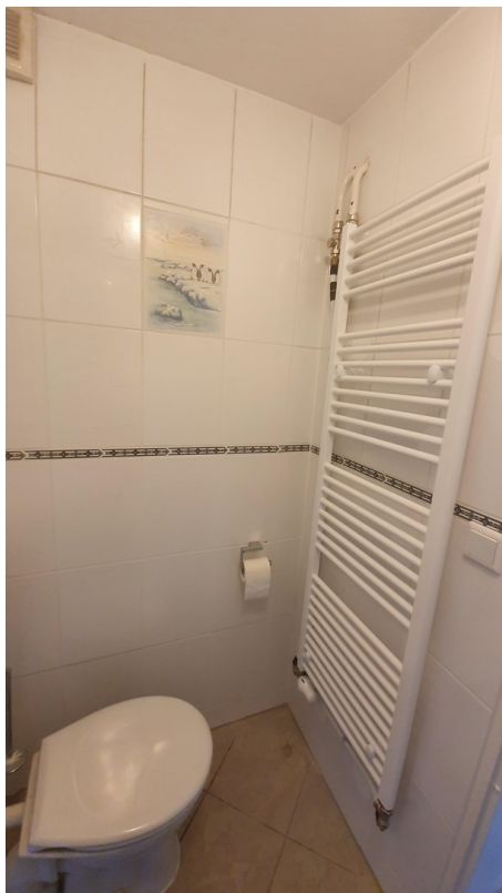
Weiteres Bad mit Dusche UG