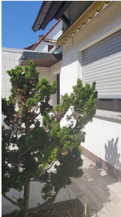
Kleiner Garten vor dem Haus