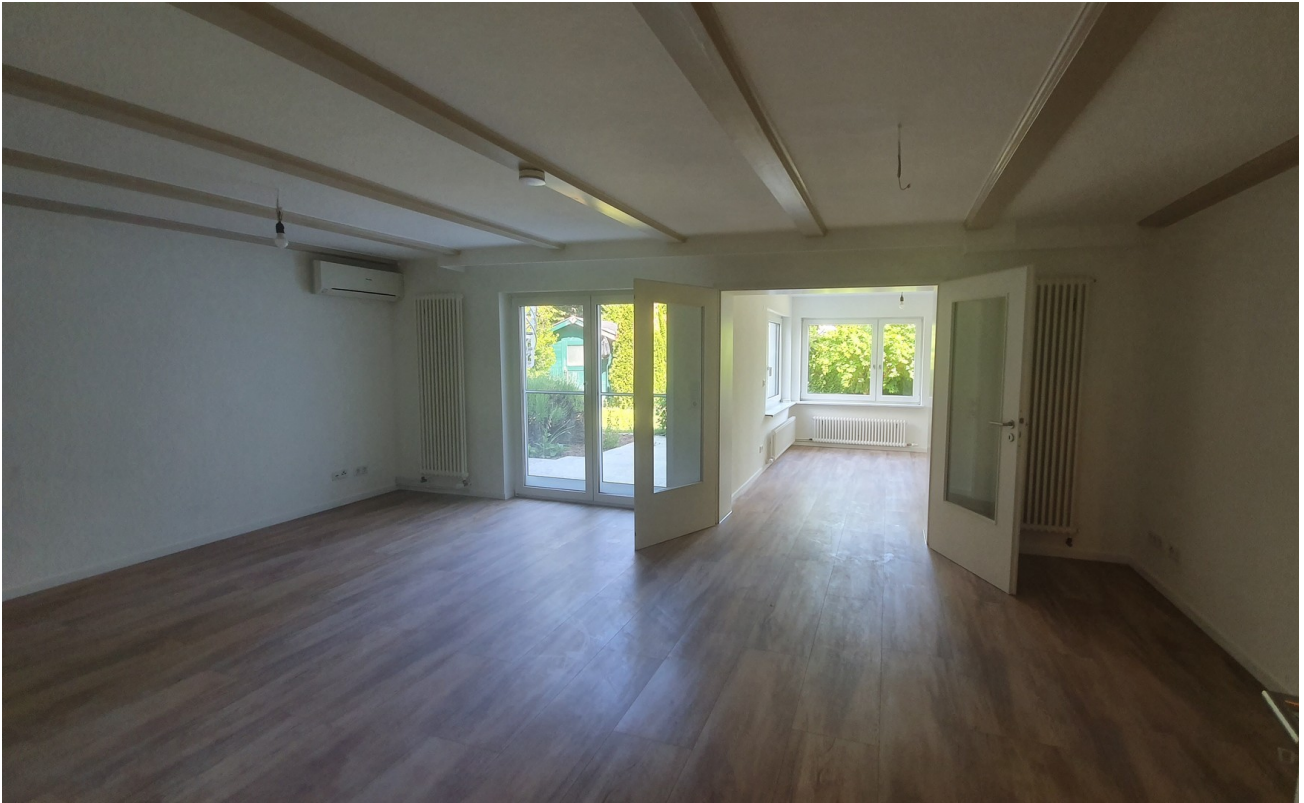
Wohn und Büroraum UG