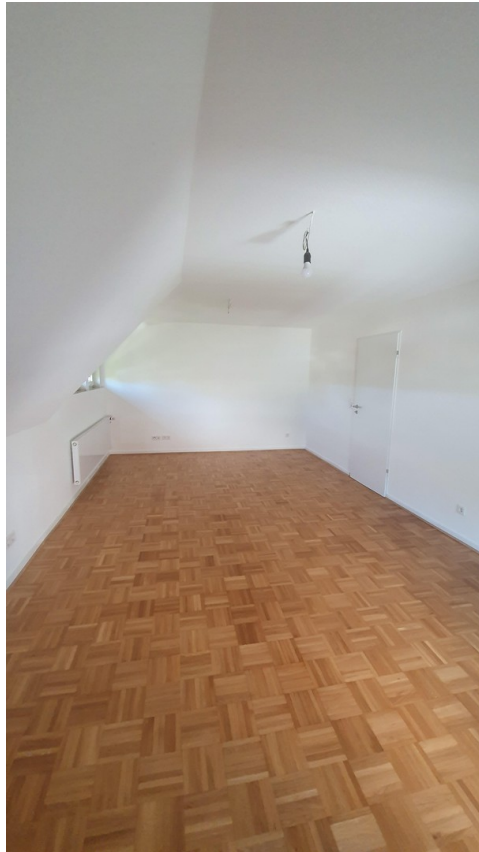
Schlafzimmer Eltern 1 St.