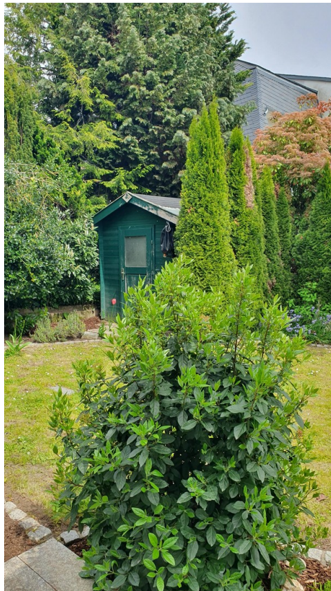
Garten hinter dem Haus 3