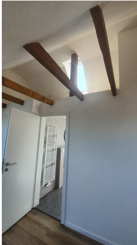
Dachgeschoss mit Bad