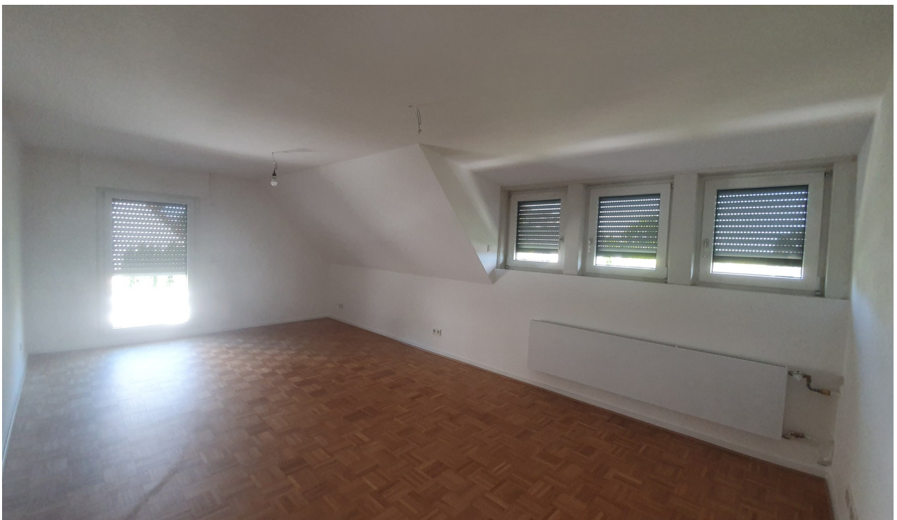
Schlafzimmer Eltern 1 St.