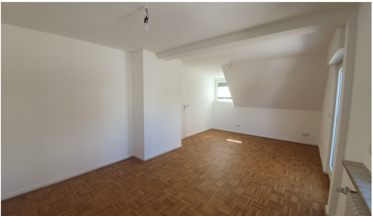
Schlafzimmer Kind 1. St.