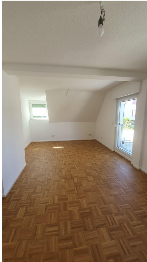
Schlafzimmer Kind 1.St.