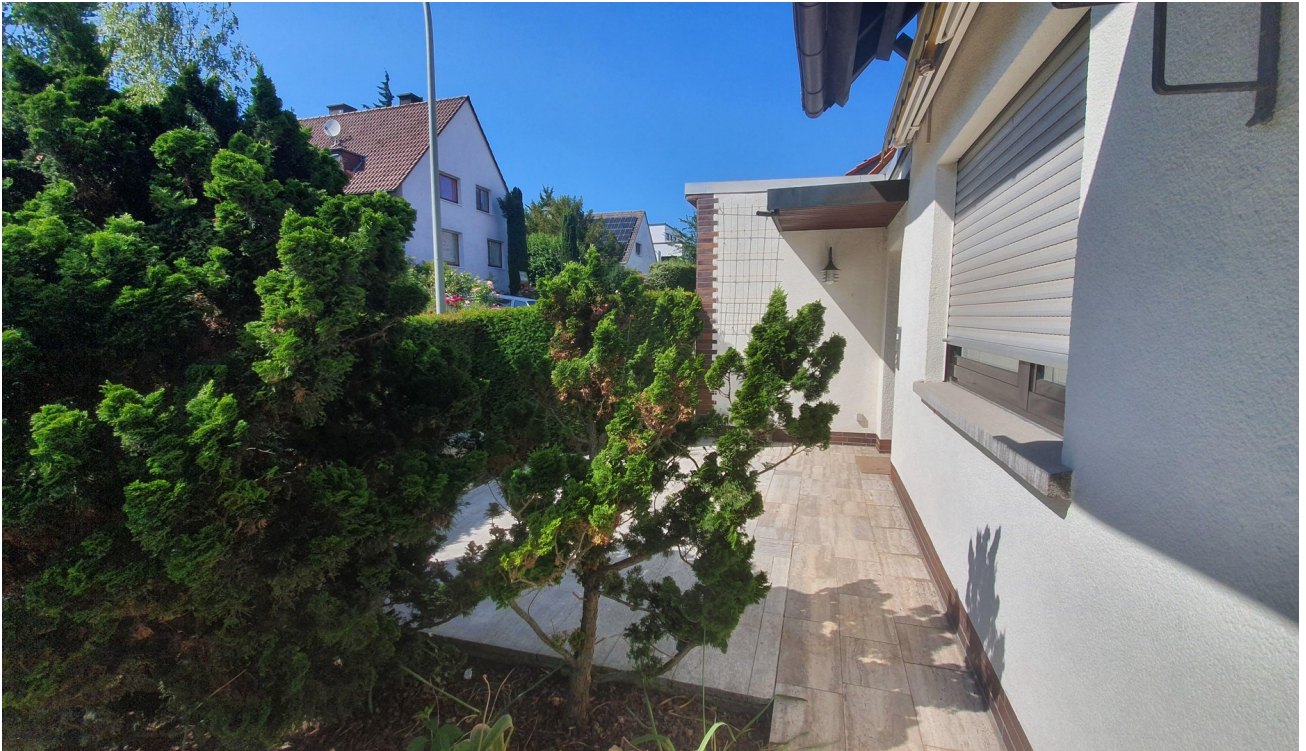
Vorgarten mit Terrasse