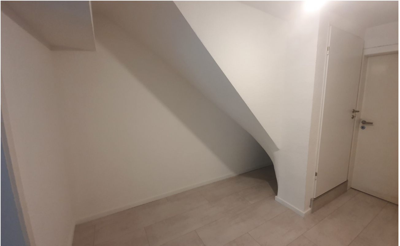
Keller / Elektrik / Heizung