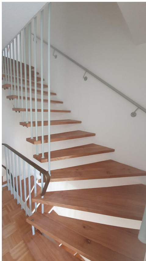
Haustreppe zum Dachgeschoss