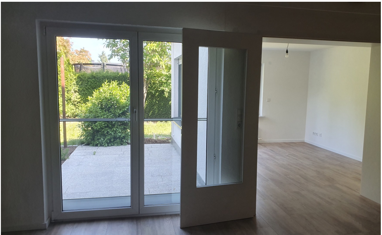
Wohn und Büroraum UG