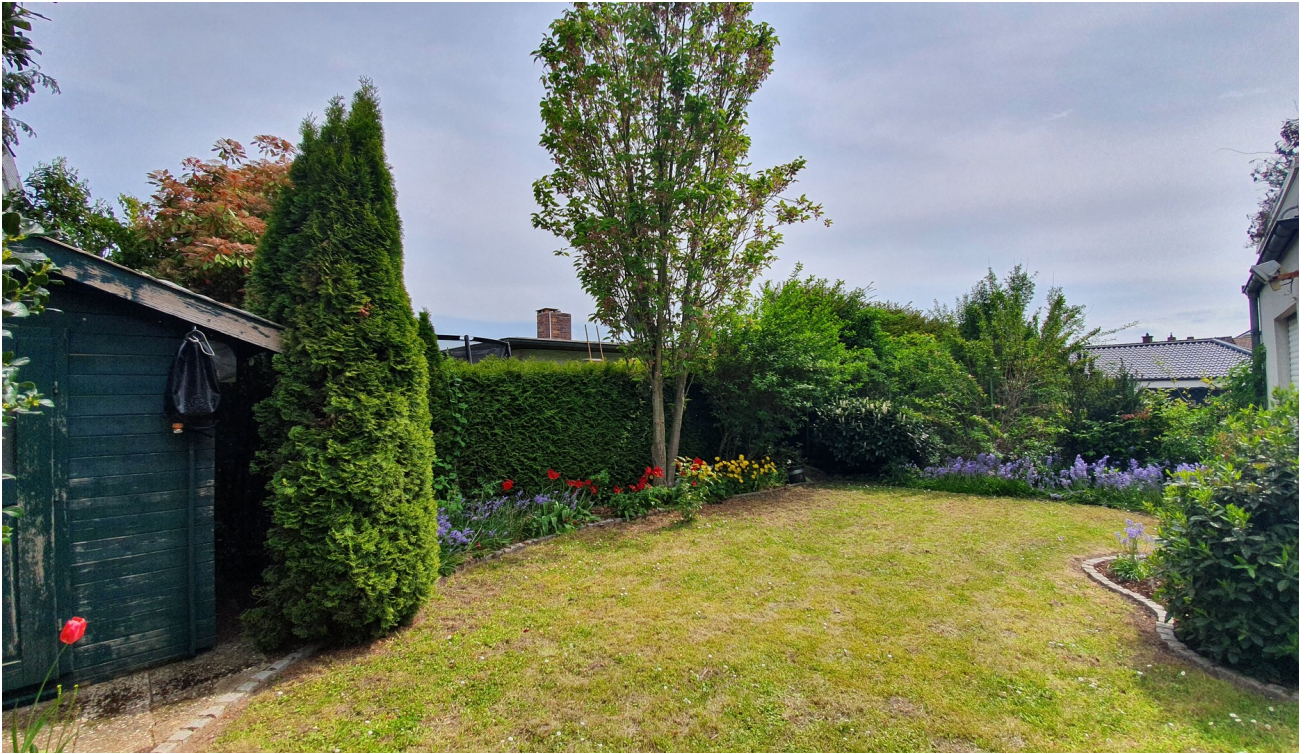
Garten hinter dem Haus 2