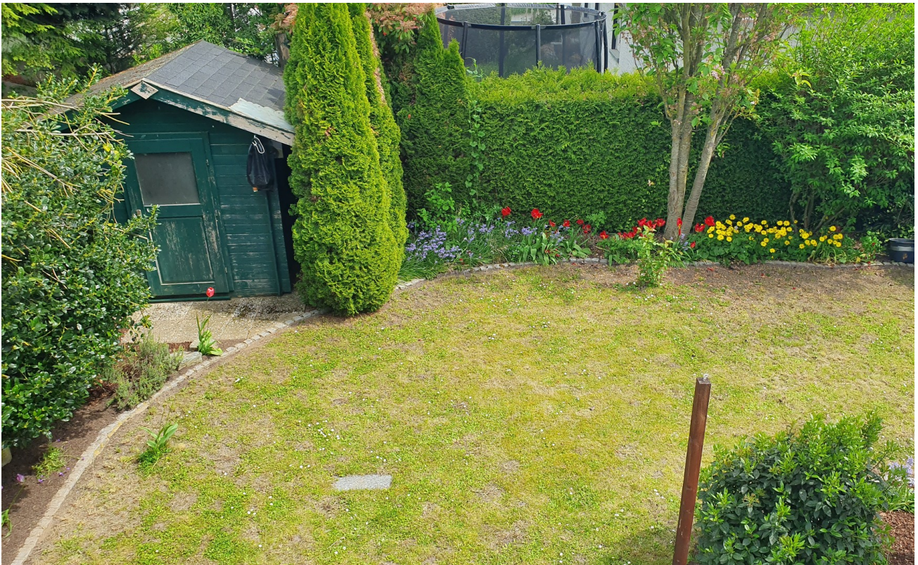
Garten hinter dem Haus 1