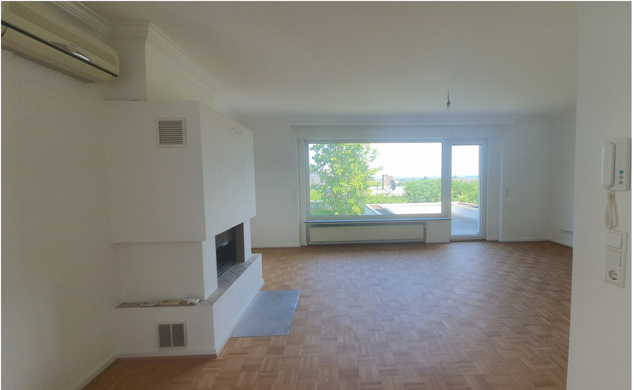
Kamin mit Wohnzimmer