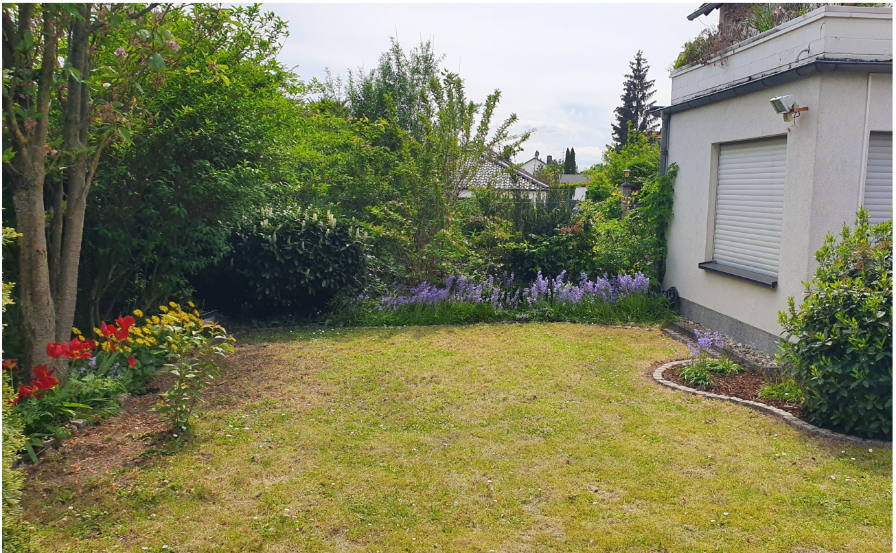
Garten hinter dem Haus 4