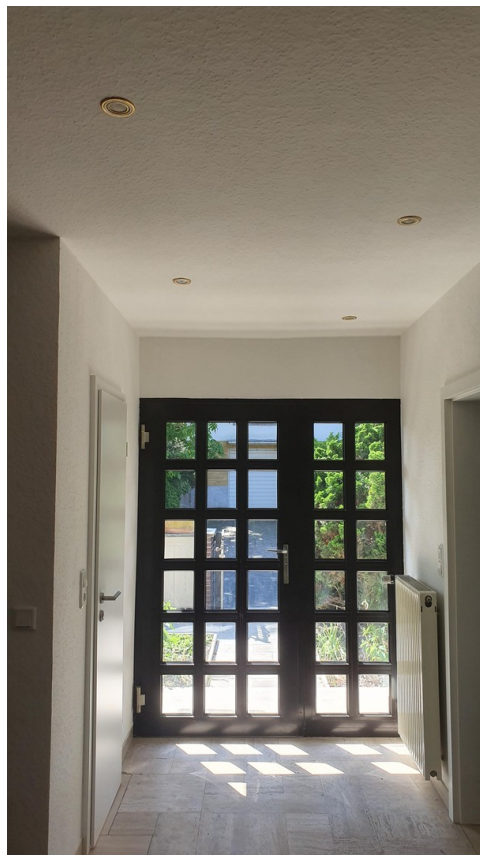
Eingangsbereich mit Haustür