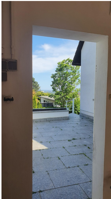
Terrasse vor Wohnzimmer