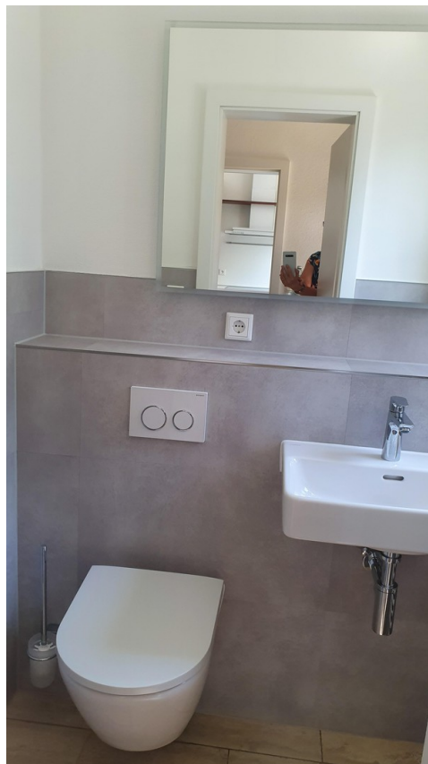
Gäste WC Erdgeschoss