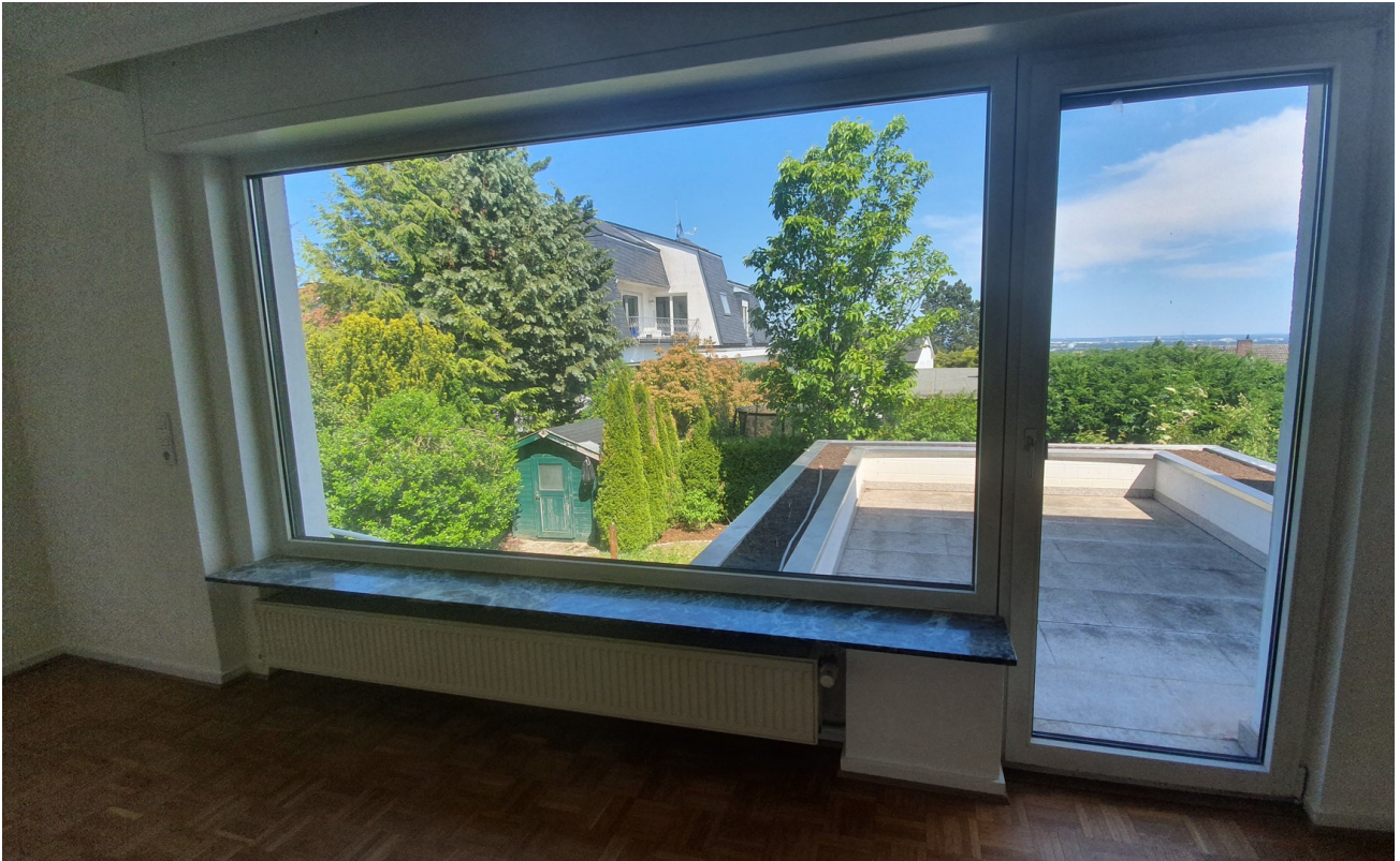
Ausblick aus dem Wohnzimmer