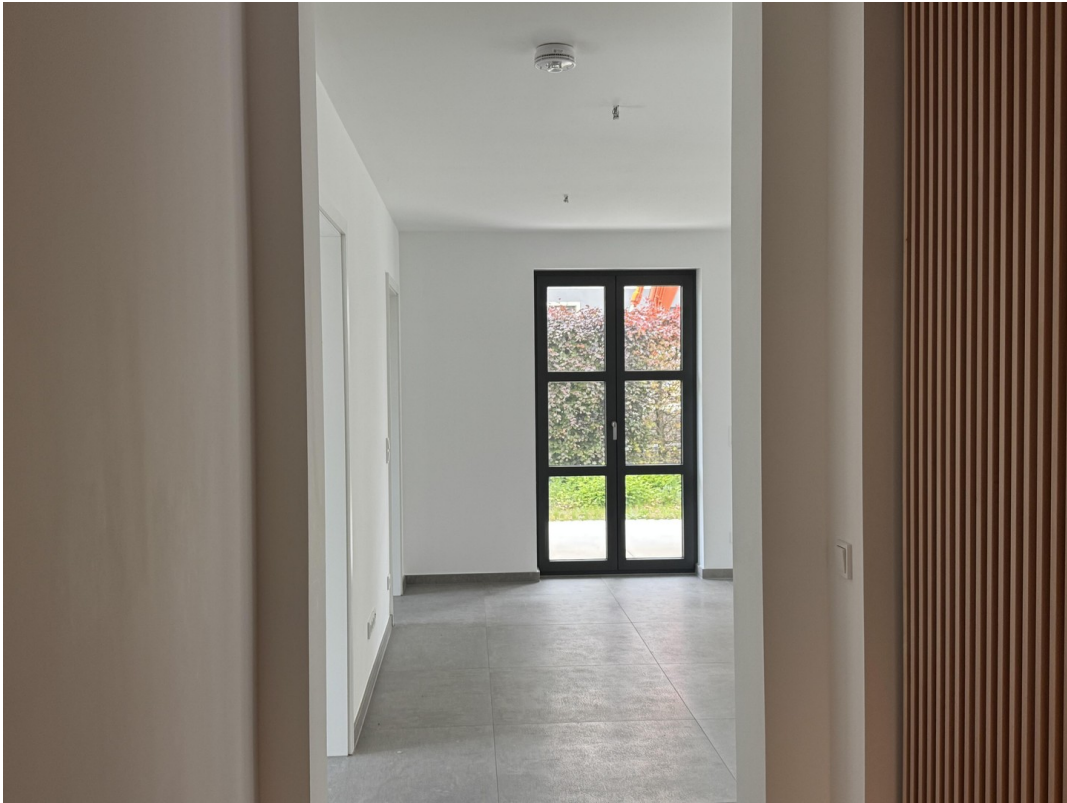
Eingang mit Garderrobenschränk