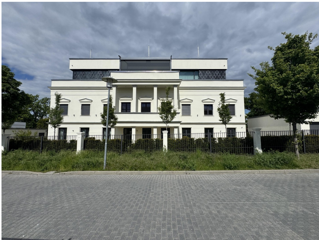
Ansicht von der Straße aus