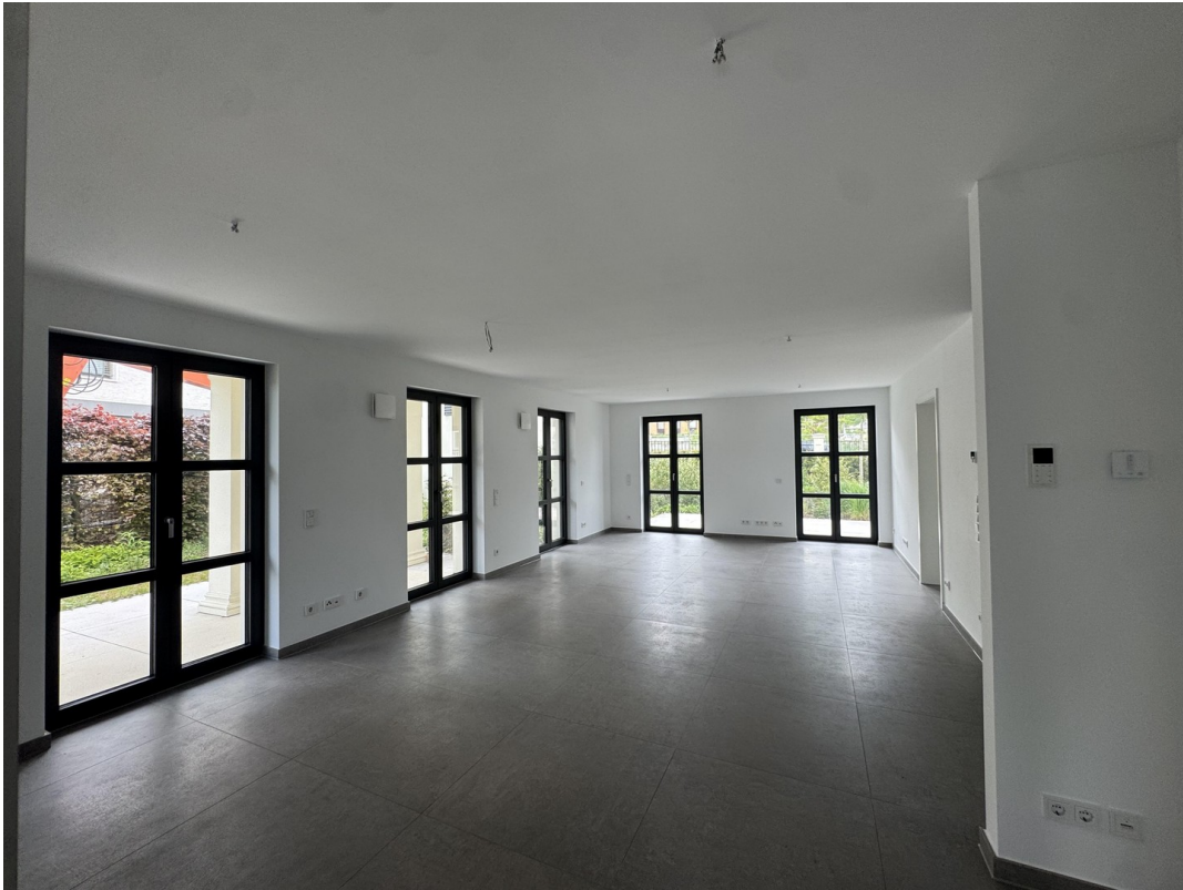
Wohnen sehr groß