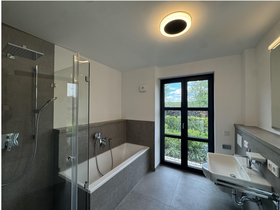
Badezimmer mit Blick ins Grüne