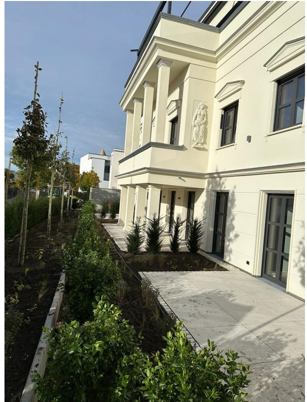
Blick von Osten auf das Haus