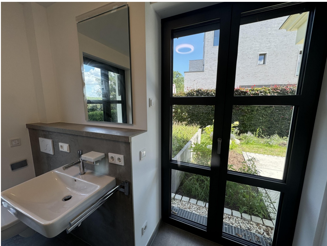
Waschtisch und mehr