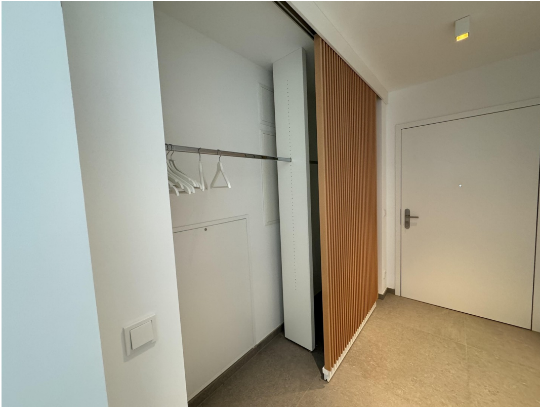
Hier ist viel Platz vorhanden