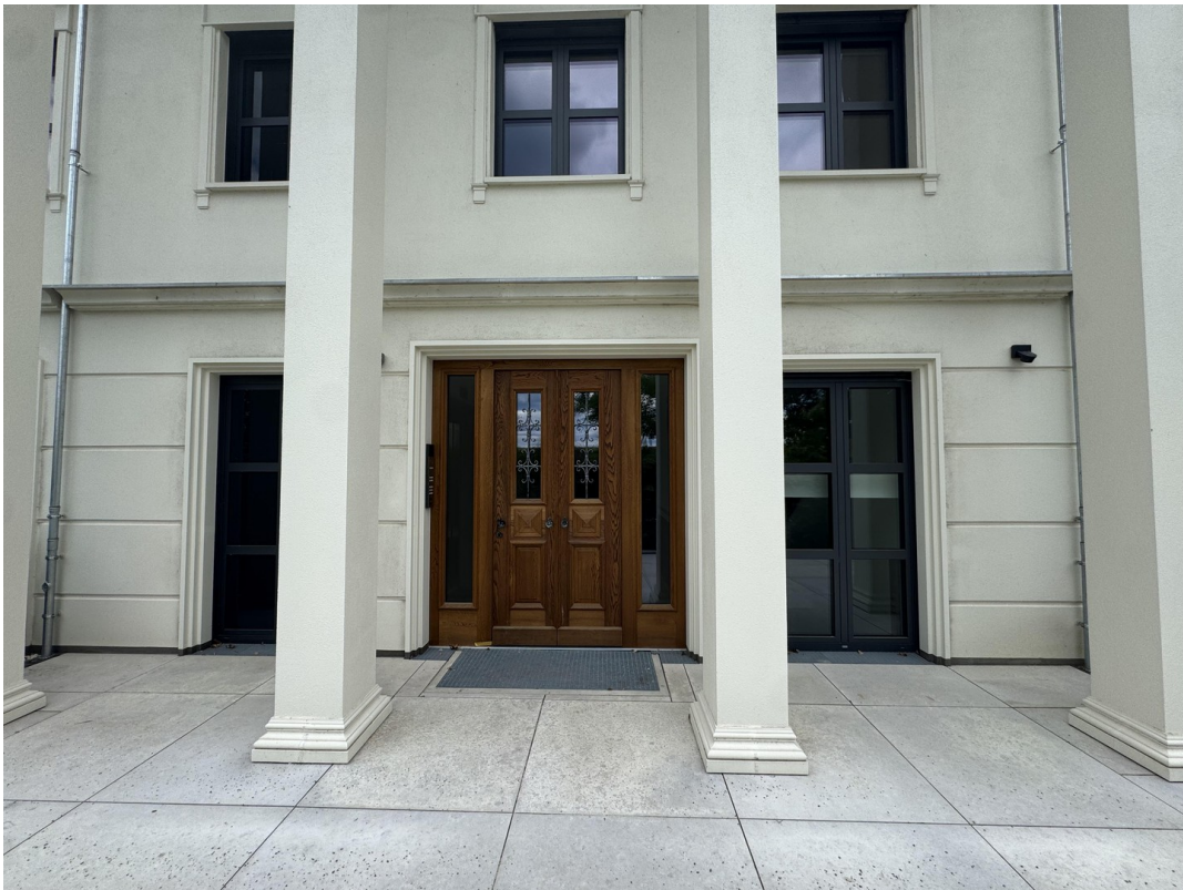
Hauseingang für nur 6 Parteien