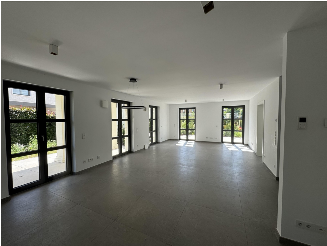
Wohnen mit Essen