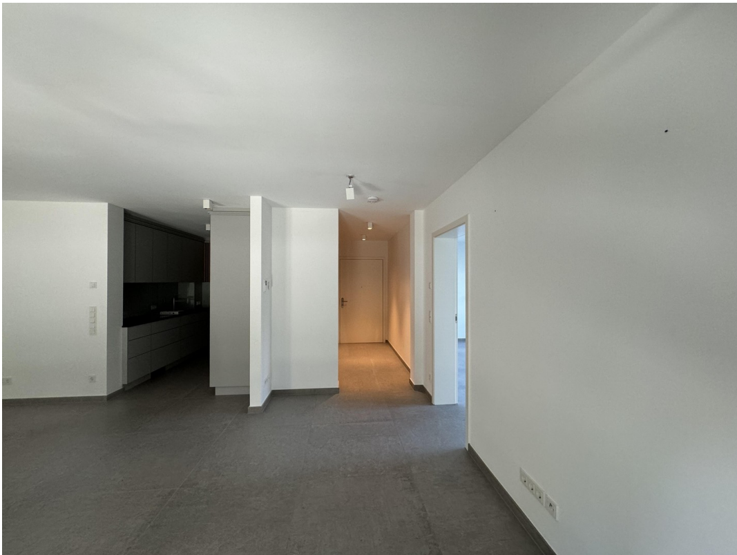
Blick zum Eingang der Wohnung