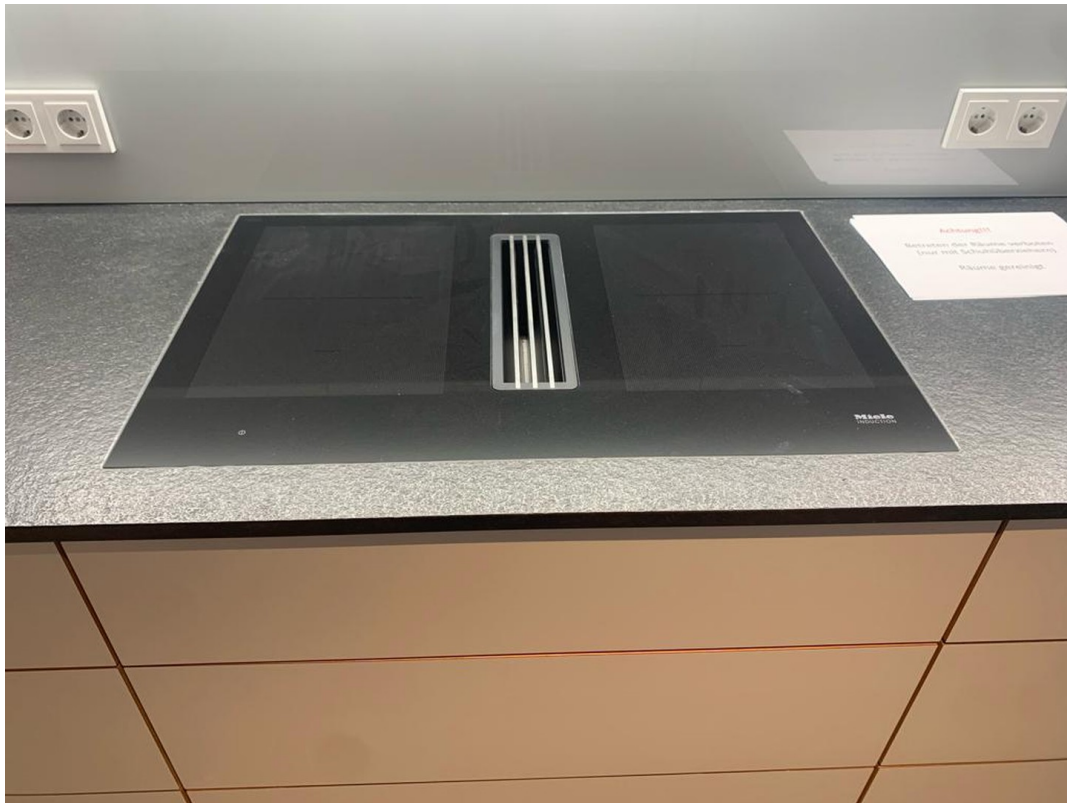
Herd von Miele mit Abzug