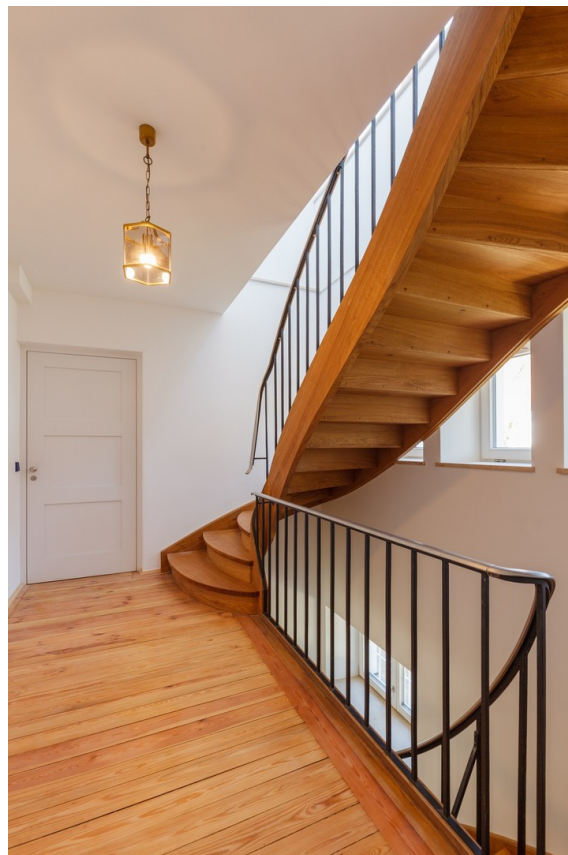
Treppenhaus und Eingang