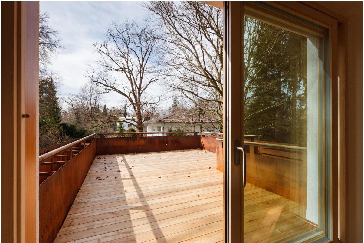
Süd-West-Terrasse mit Bäumen