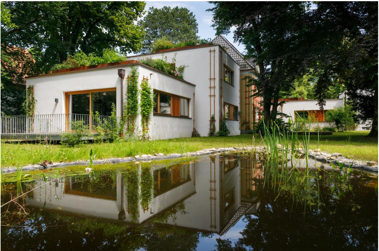
Blick vom Teich auf Terrasse