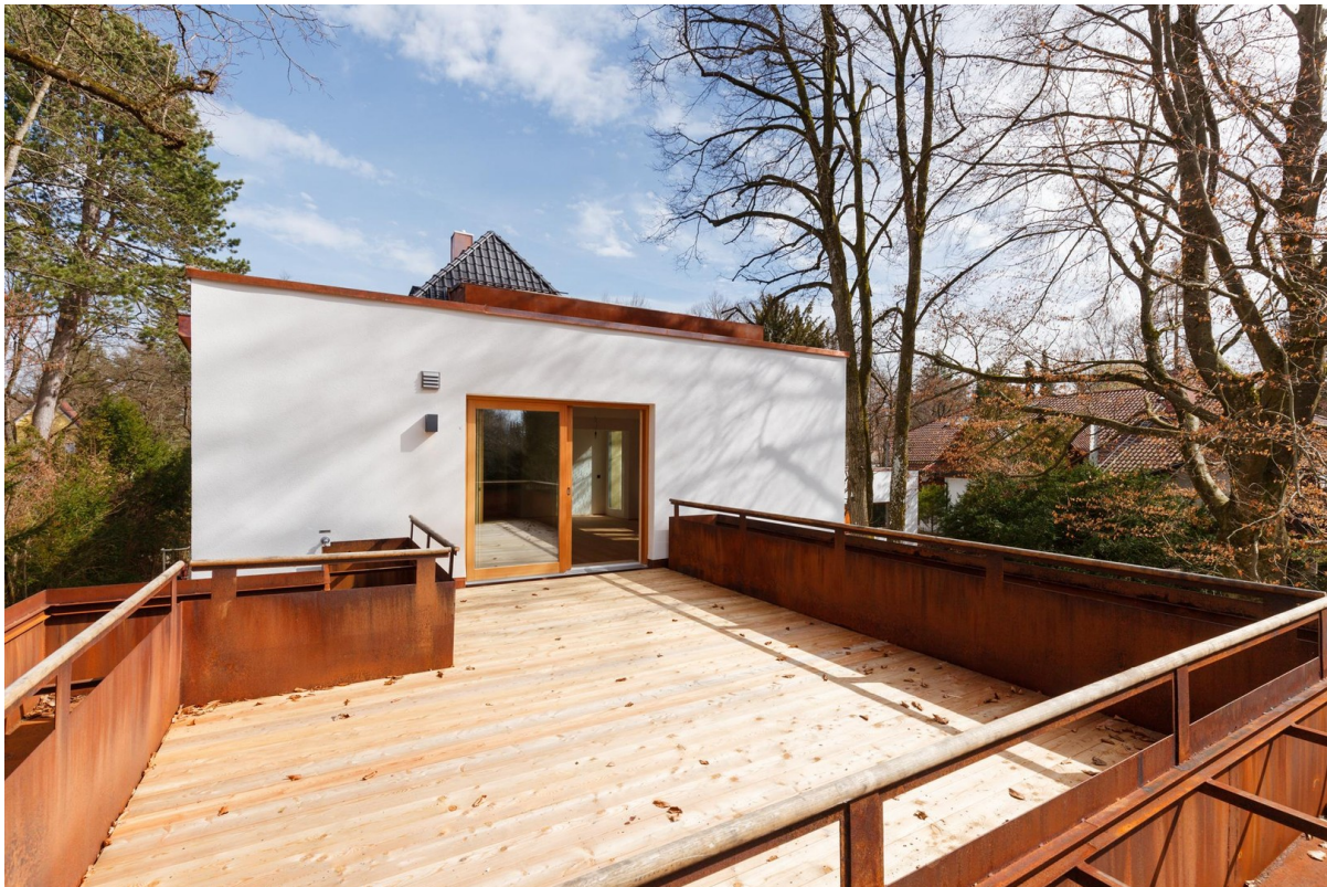
Süd-West-Terrasse mit Bäumen