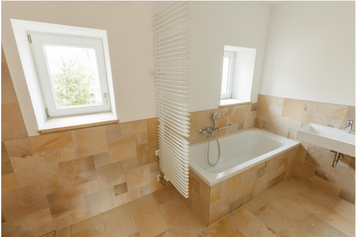
Dusch- und Wannenbad