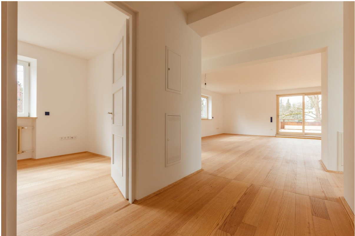
Schlafzimmer, Gang und Wohnen