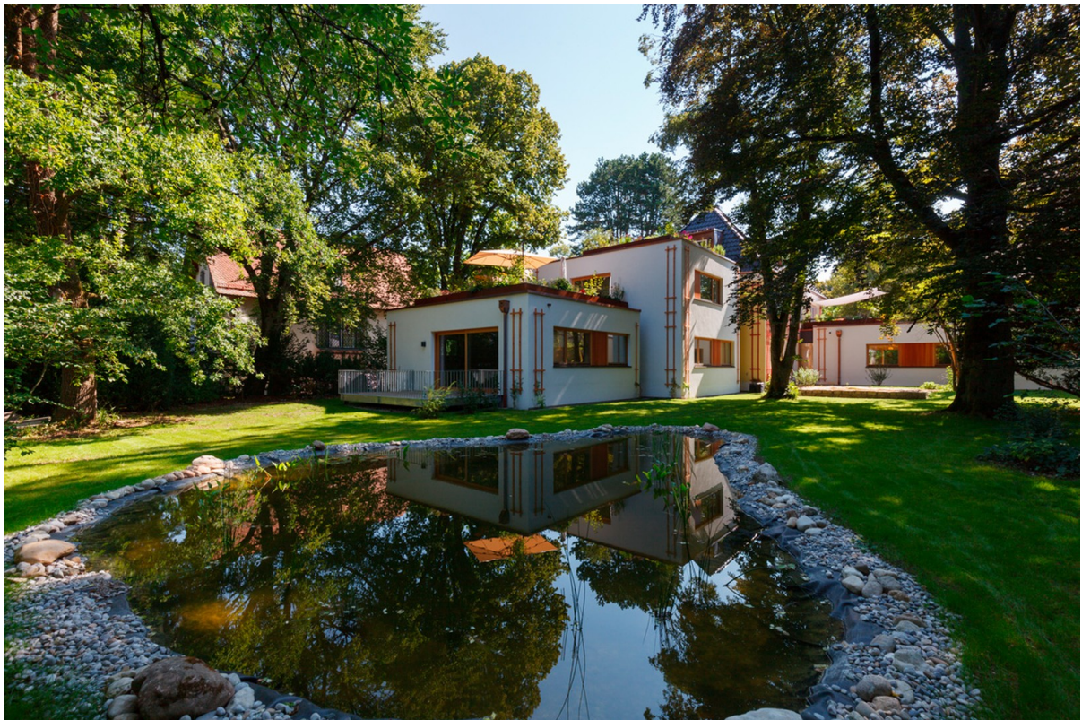
Blick vom Teich auf Terrasse