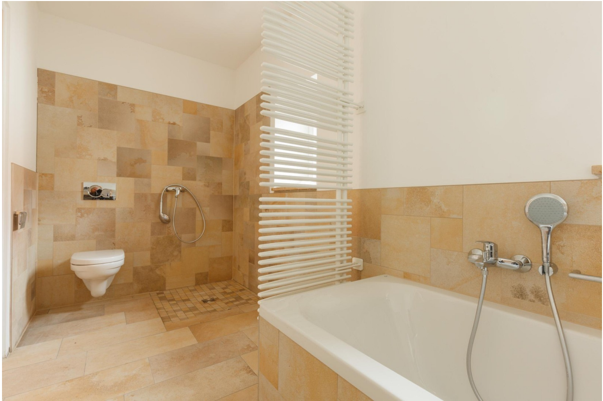
Dusch- und Wannenbad