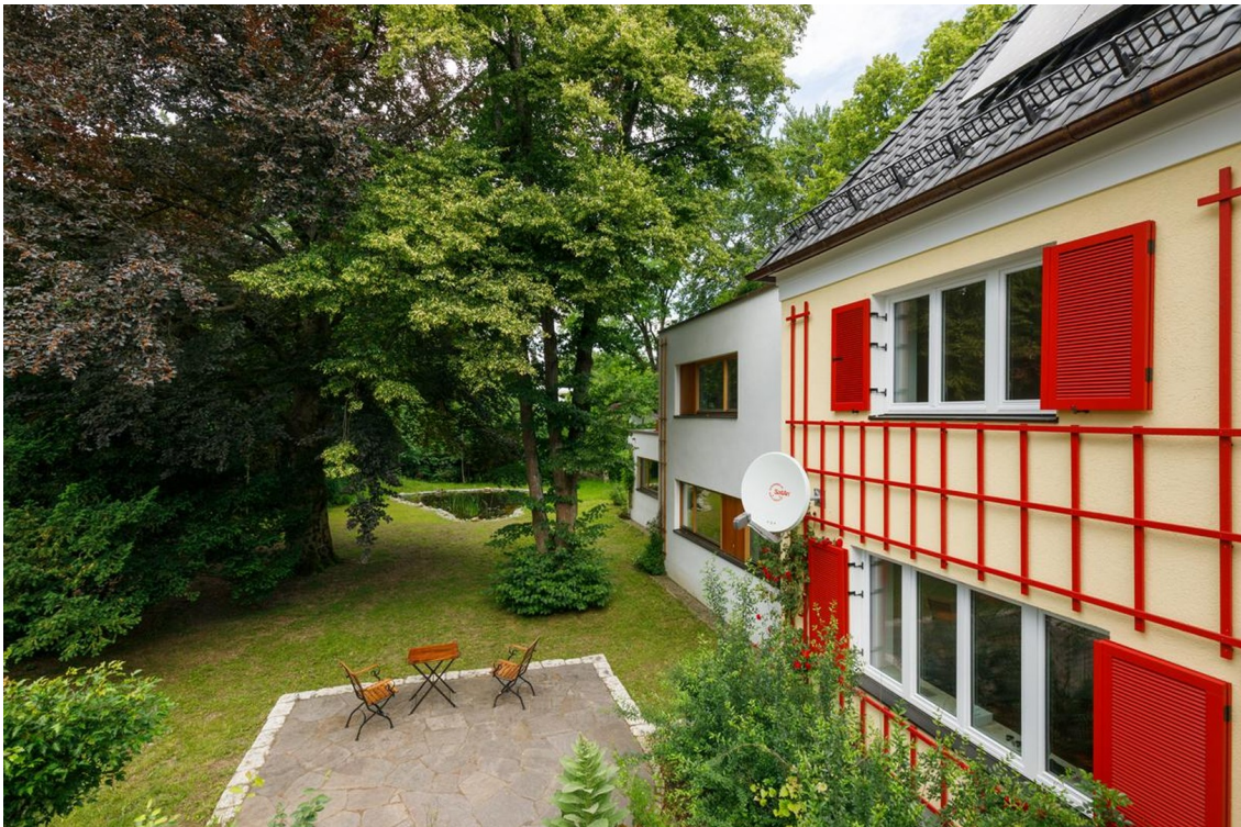
Sitzplatz und Wohnung