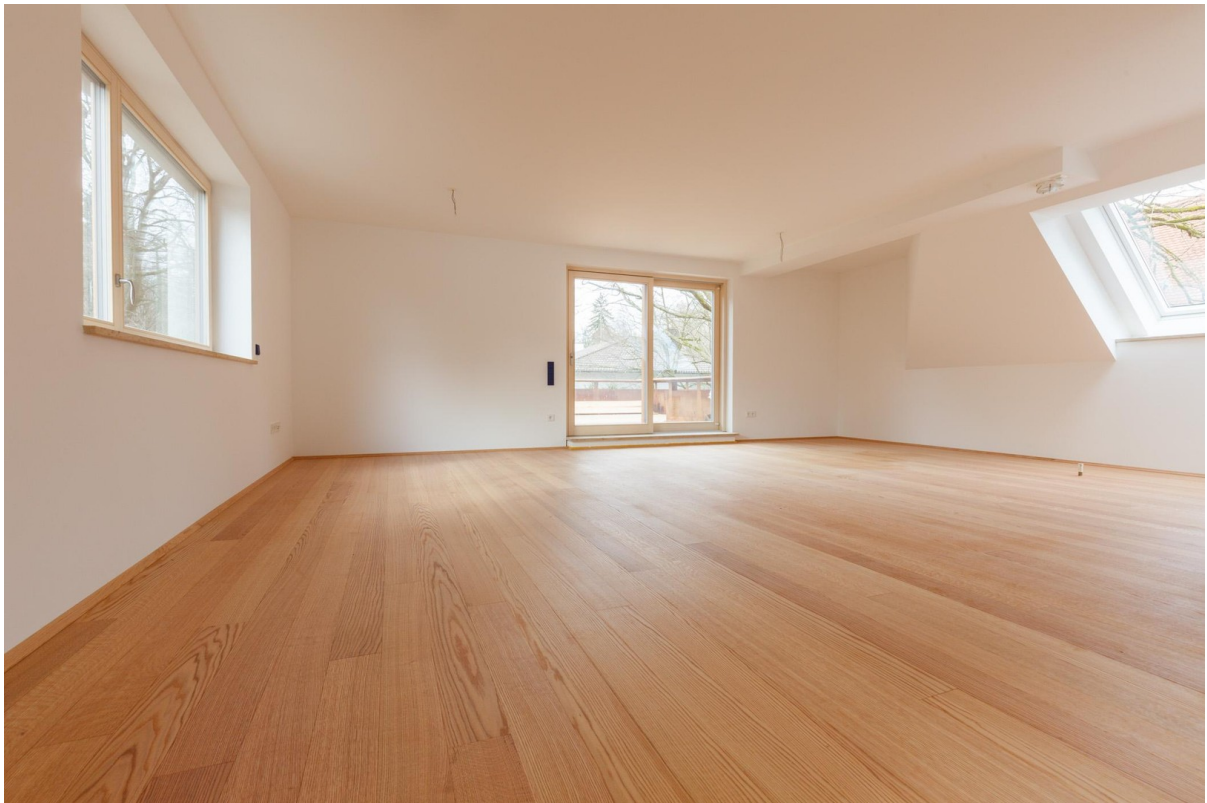
Wohn- und Küchenbereich