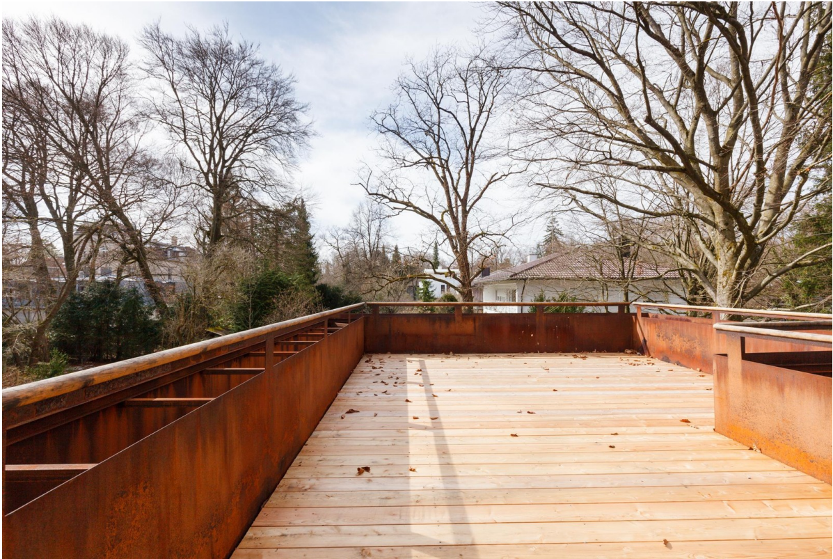
Süd-West-Terrasse mit Bäumen