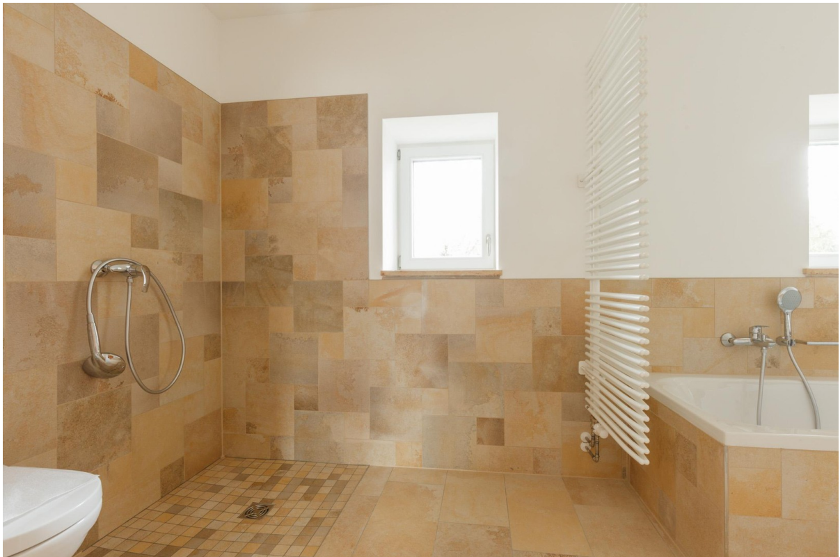
Dusch- und Wannenbad