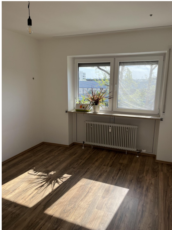
Helles Kinderzimmer / Büro