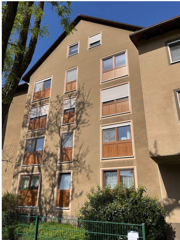
Wohnung im 3.Stock