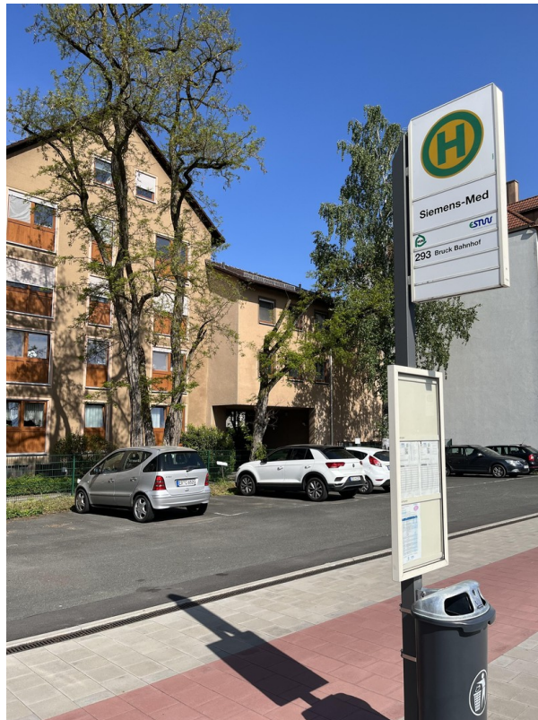
Bushaltestelle vor dem Haus