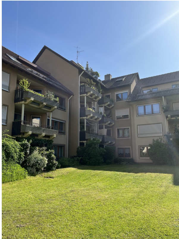
Schöner grüner Garten