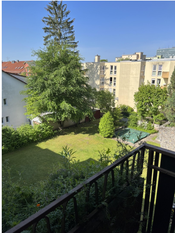
Blick vom Balkon in den Garten