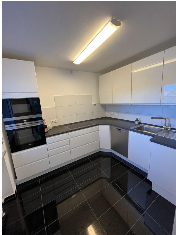
Weißer, moderne Hochglanz-Küche