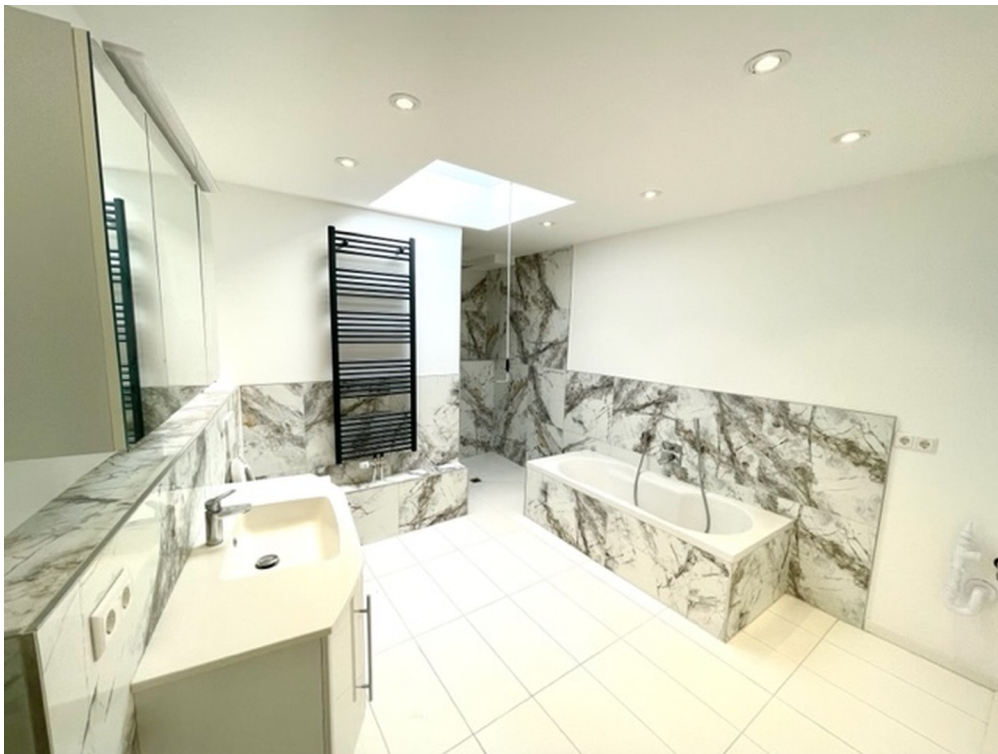
Bad mit XXL Dusche