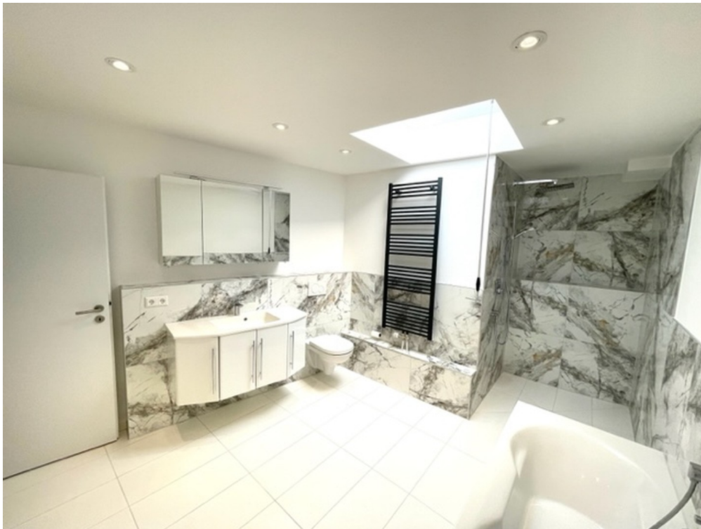
Bad mit XXL Dusche