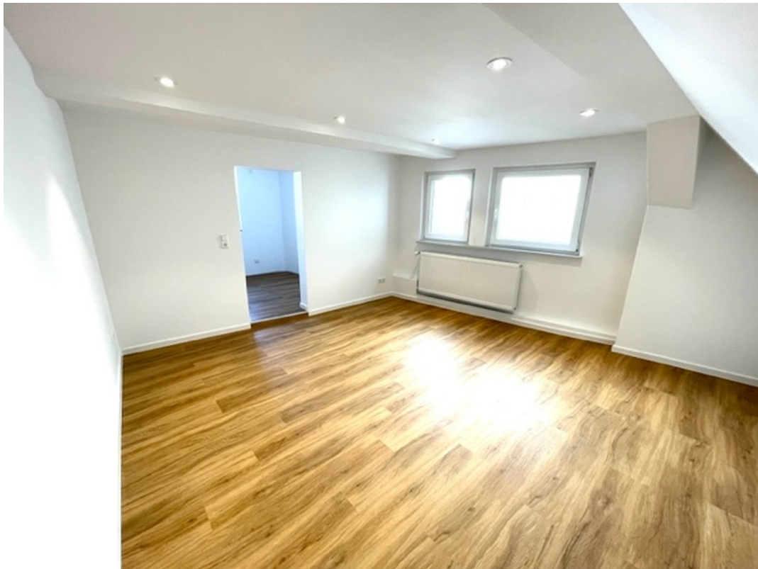
Wohn / Esszimmer