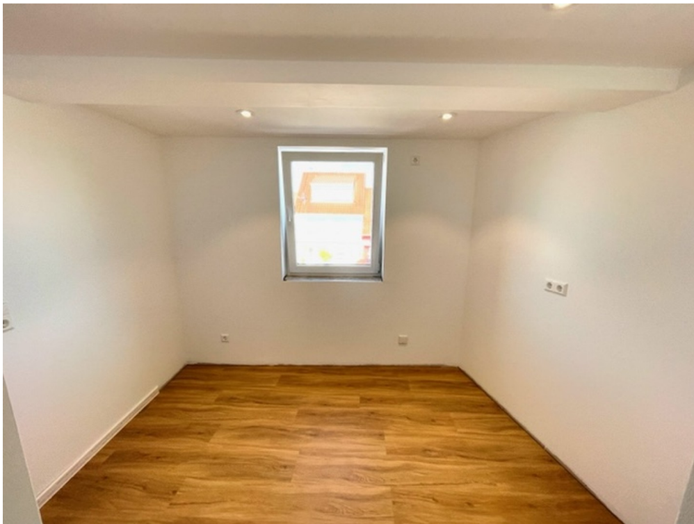
Büro oder Kinderzimmer