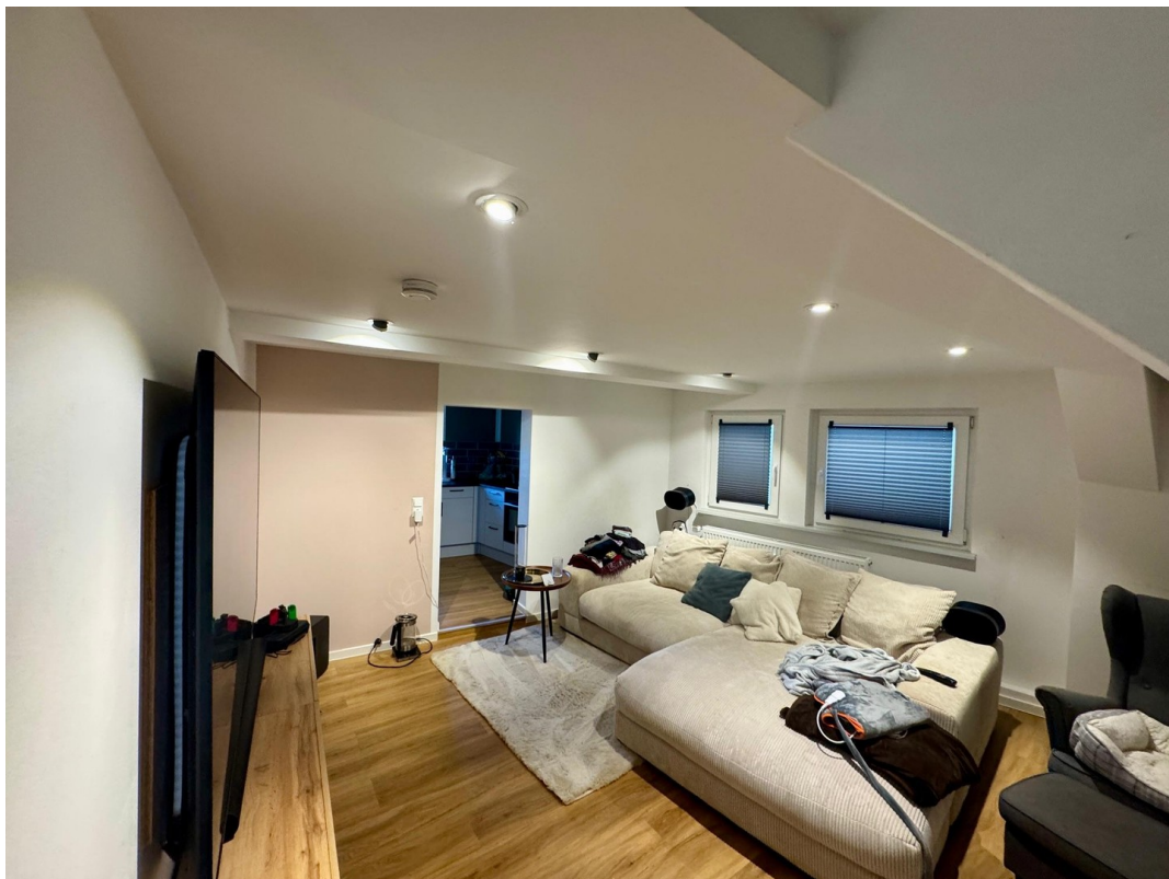
Wohnzimmer Blickwinkel Eingang