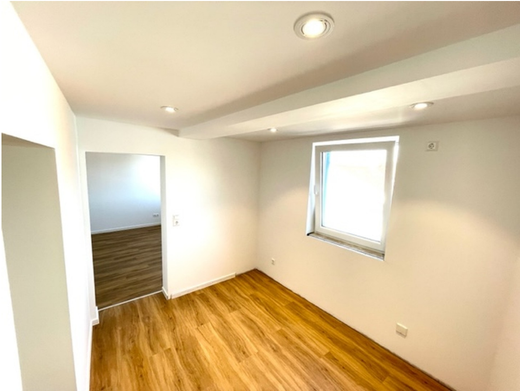
Büro oder Kinderzimmer