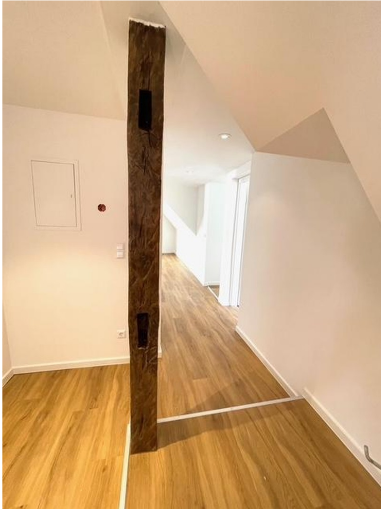
Eingangsbereich / Flur