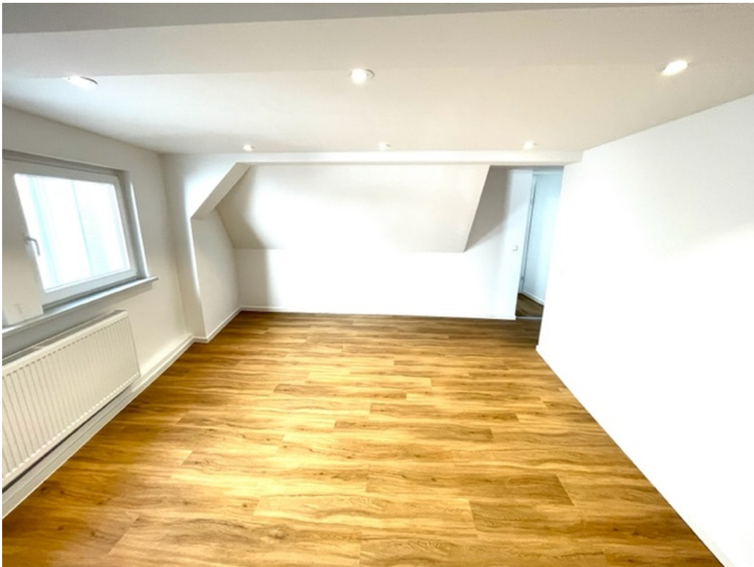
Wohn / Esszimmer