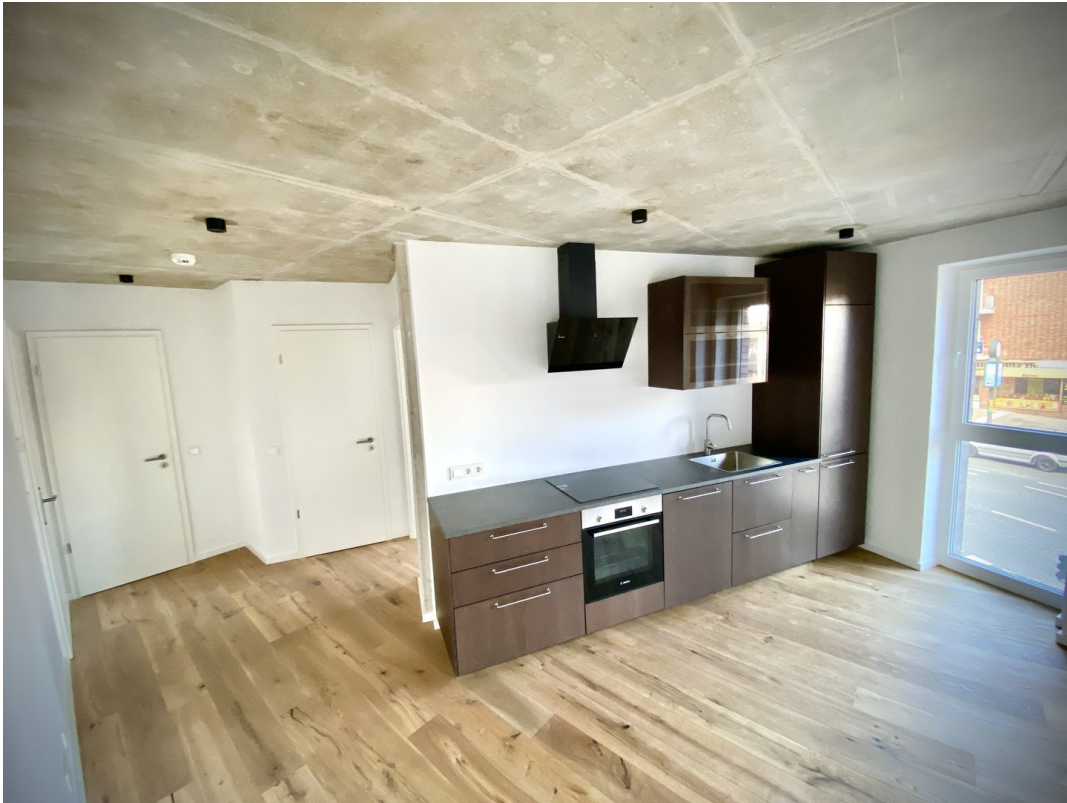
Wohnbereich inkl. Küche 2