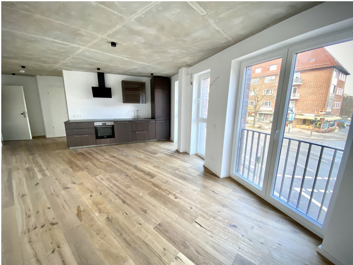
Wohnbereich inkl. Küche 1