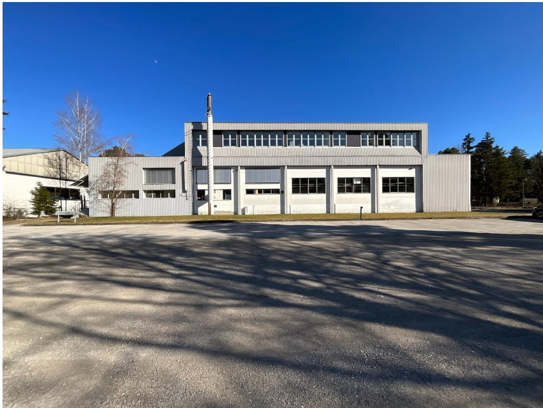
Eingang und Parkbereich PKW