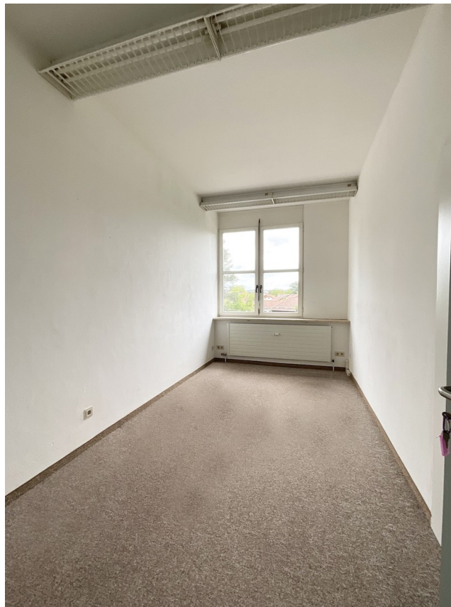
Einzelbüro mit 12,5 m 2