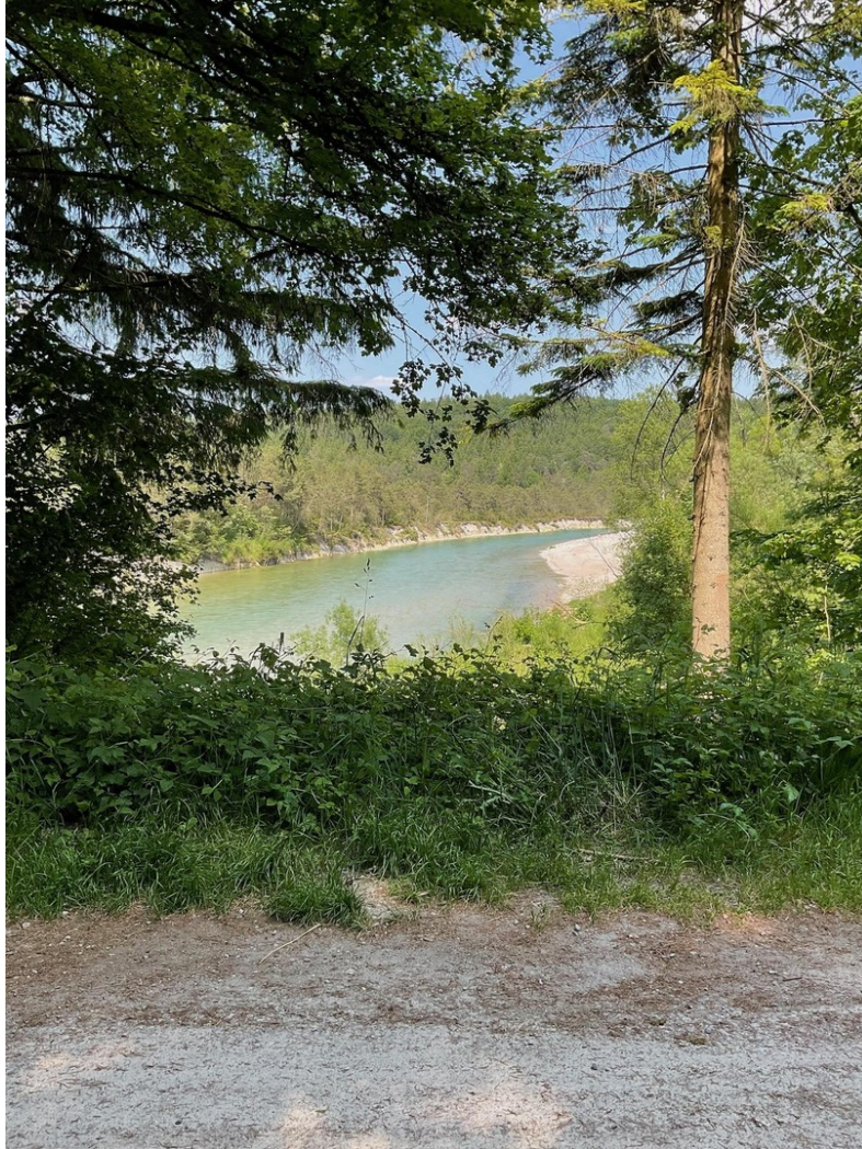
Isar in der Nähe