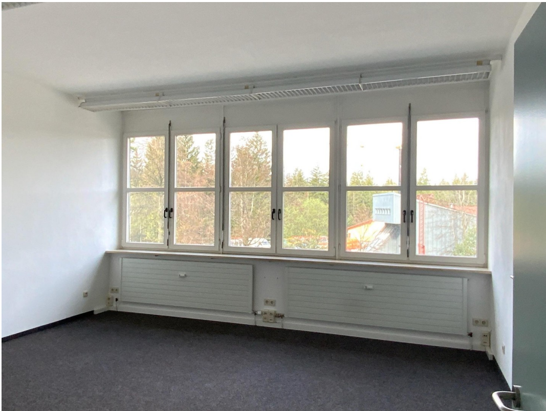
Raum 25 m2