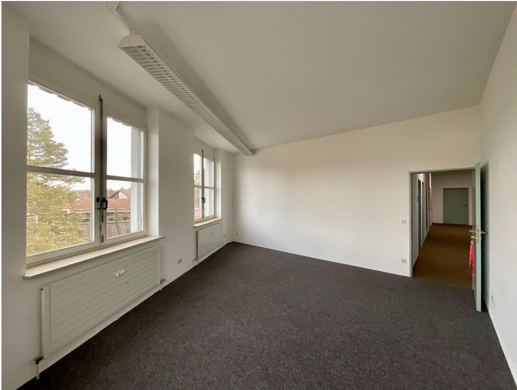
Büro mit 25 m 2