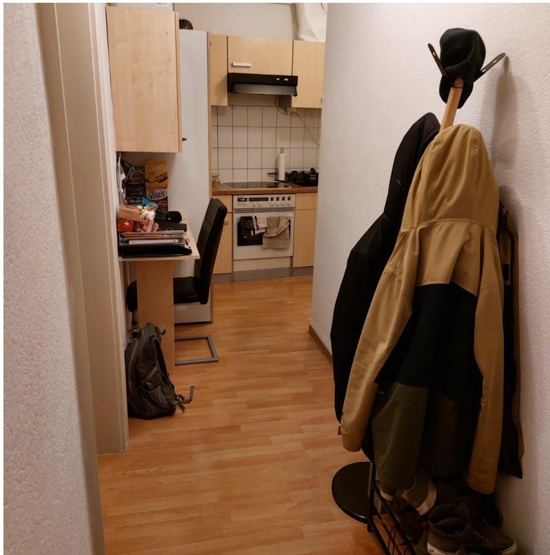
Küche- und Essbereich