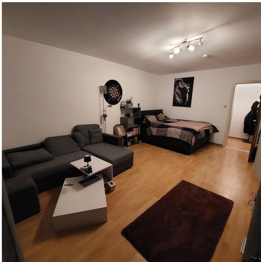
Wohn- und Schlafbereich 2