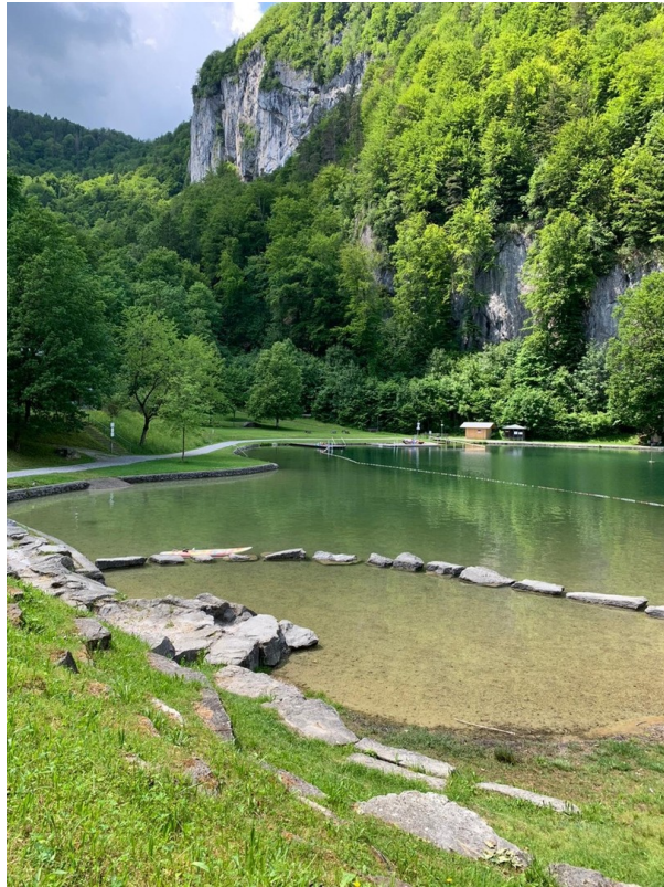
Wohnung ist direkt am Badesee