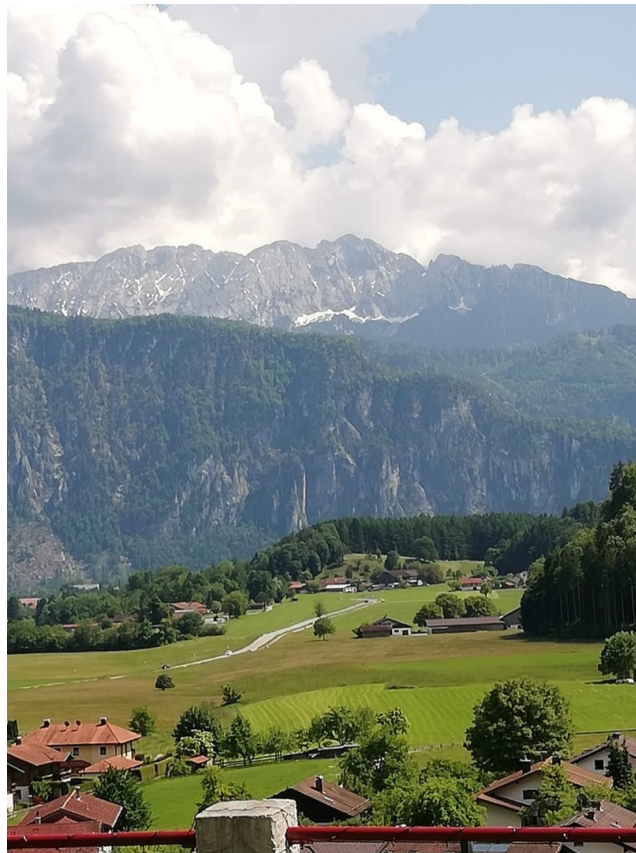
Blick von der Terrasse/Wohnzi.