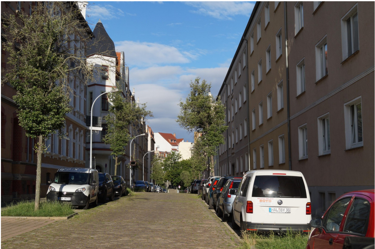
Straße Richtung Neumarkt