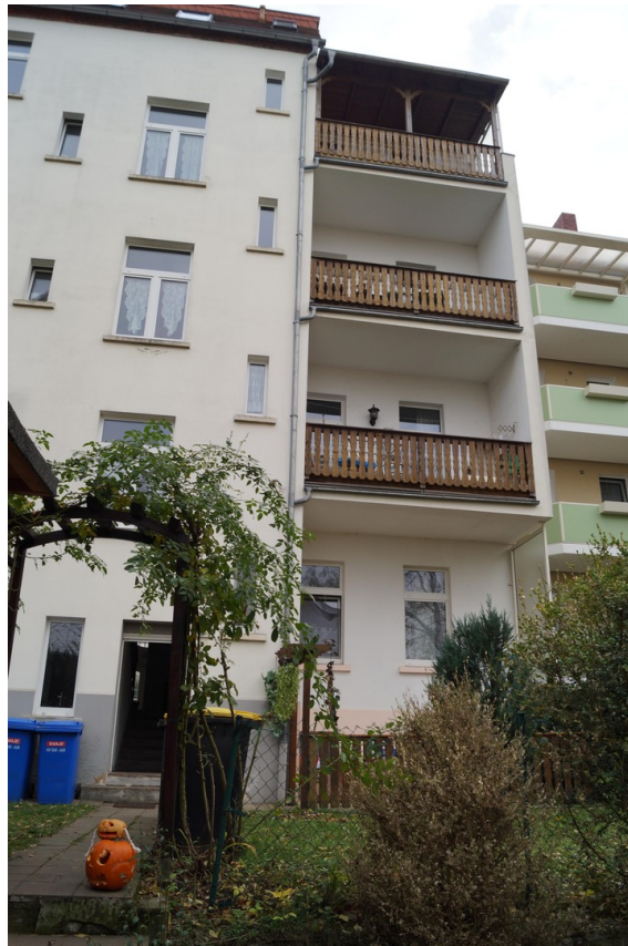
Loggia zur Hofseite