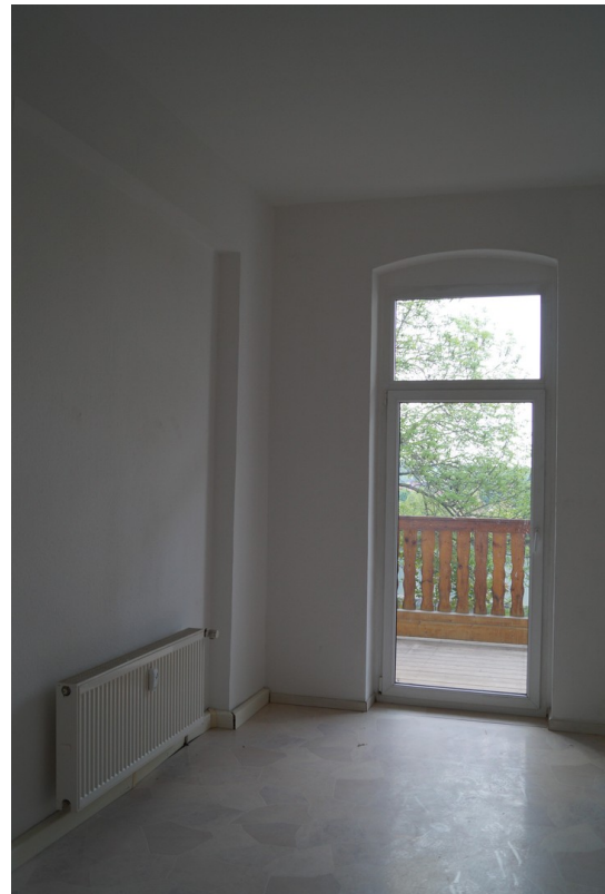
Küche mit Ausgang zur Loggia