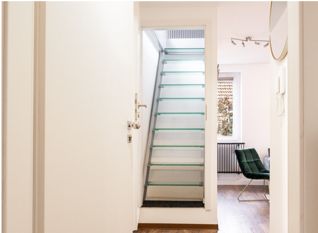
Aufgang 2 Stock